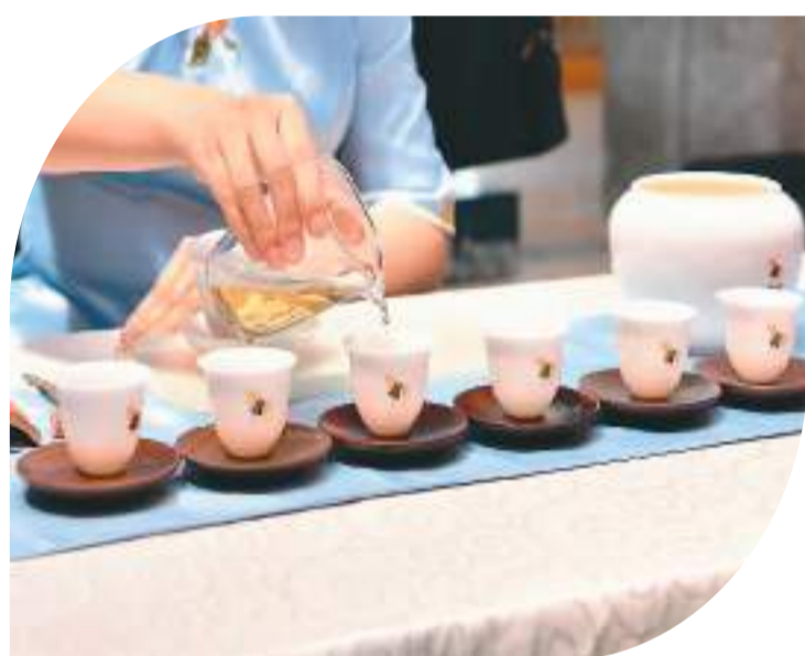
▲“福建安溪铁观音茶文化系统”是联合国粮农组织认定的全球重要农业文化遗产。因为位于意大利罗马的联合国粮农组织总部，福建安溪铁观音茶文化系统的代表在表演茶艺。