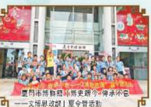
廈門市博物館舉辦「揚帆海絲少年行——文博研學營」夏令營活動

時時時開放試點工作列入省委、省政府「為民辦實事」項目。着力提升講解服務水平，加強講解員隊伍建設。在今年國家文物局指導下，中國博物館協會主辦的首屆「博博盃」全國博物館講解大賽中，福建選手榮獲專業組二等獎和志願組二等獎。社會文物管理服務水平不斷提升，完善文物市場風險監測預警處置機制，2023年完成13032件文物拍賣標的審核備案，建立文物鑒定公益性服務常態化機制，在「5·18國際博物館日」和「中國文化和自然遺產日」等重要時間節點，指導省考古研究院和各地市博物館開展文物鑒定免費諮詢、公益鑒定活動。