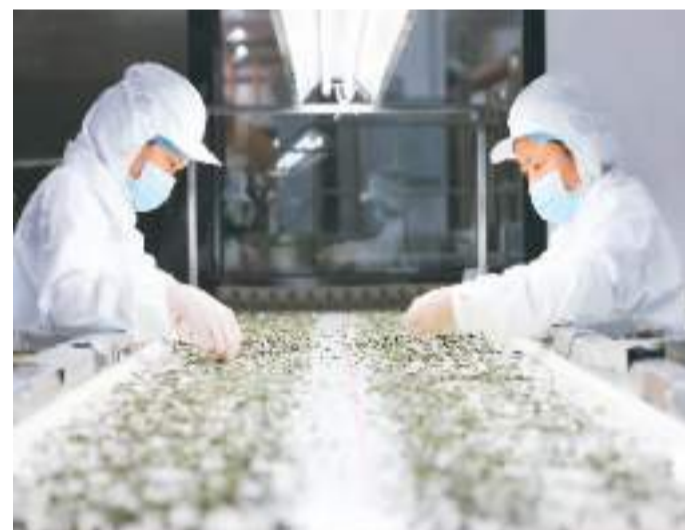
▲福建省福鼎市一家茶业公司的工人在自动化生产流水线上加工茶叶。