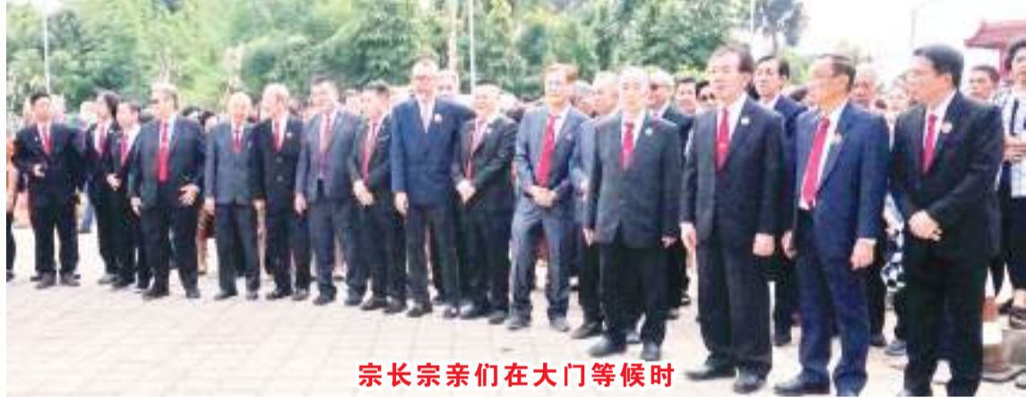
宗长宗亲们在大门等候时