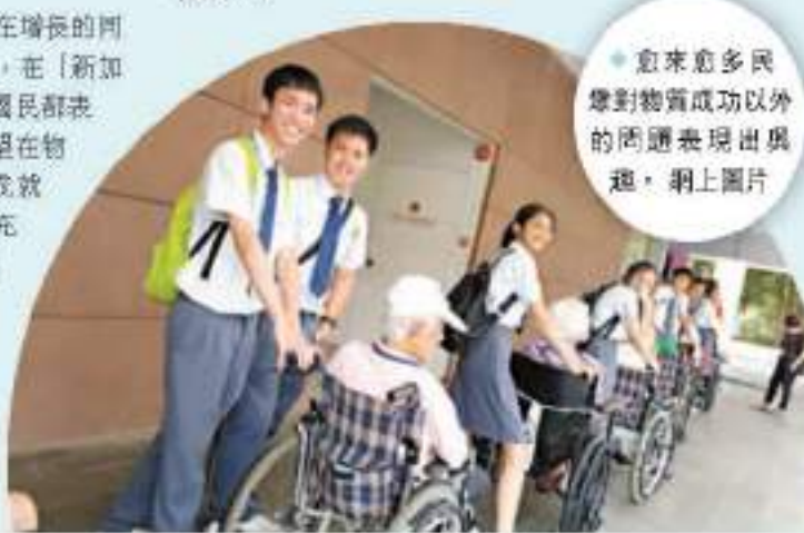
◆愈來愈多民眾對物質成功以外的問題表現出興趣。

質成功以外的興趣表現出興趣，包括環境、有意義的政治參與和多元化，這可能會影響他們的職業計劃，以及他們如何投入工作。他表示，雖然執政人民行動黨一直努力軟化自己的形象，並更多地與年輕人接觸，但目前尚未清楚這種接觸和形象管理，是否能轉化為政策上的具體變化。「黃循財如何在這些問題上朝着更明確、更大膽的方向前進，尤其是如何將一般原則和想法轉化為具體政策，還有待觀察。」