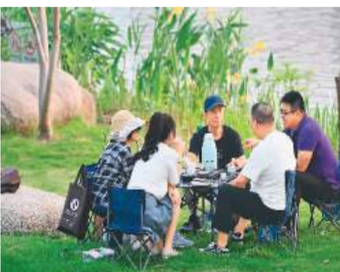
▲福建省福州市晋安湖公园，市民在湖畔喝茶聊天。