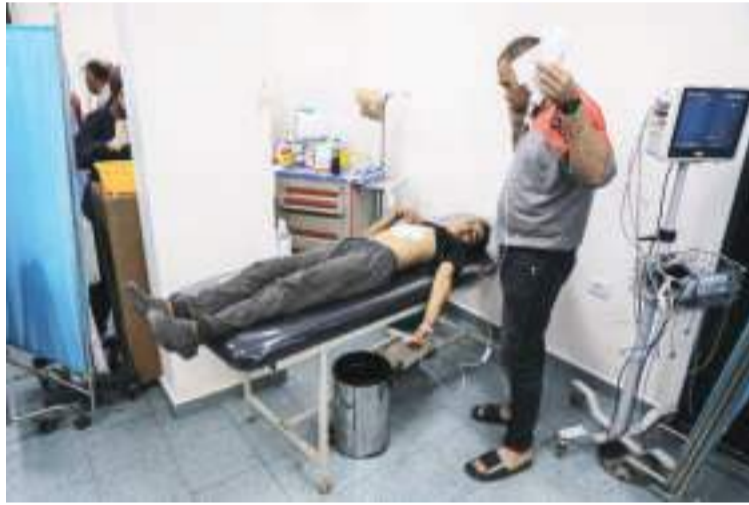
5月8日,在加沙地带南部城市拉法,一名伤者在临时诊所内接受救治。

新一轮巴以冲突爆发后,埃尔多安多次声援哈马斯,批评以色列。土耳其贸易部上月宣布对以色列实施出口限制,直至加沙地带实现停火。埃尔多安4月20日在伊斯坦布尔