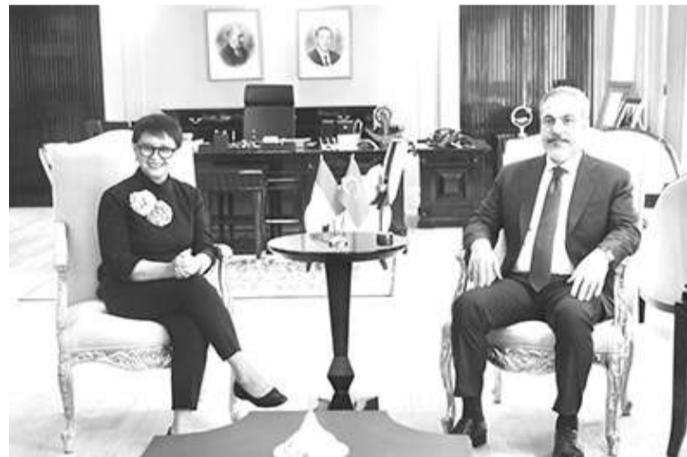
外交部长蕾特诺与土耳其外长会谈

【本报讯】5月1日，外交部长蕾特诺前往土耳其，将与土耳其外交部长哈坎·菲丹讨论巴勒斯坦加沙的局势。此外，两位部长将讨论其他地区问题和两国之间的双边合作关系。