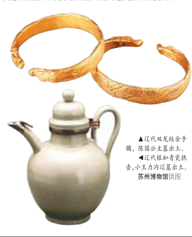
▲辽代双龙纹金手钏，陈国公主墓出土。 ▲辽代银扣青瓷执壶，小王力沟辽墓出土。

辽上京是草原丝绸之路的东端枢纽，来自各地的珍品在这里汇聚。辽代贵族墓中不乏西方舶来品，是草原丝绸之路商贸、文化交流的见证。陈国公主墓出土的乳钉纹高颈玻璃瓶，漏斗形细颈，球形腹，喇叭形高圈足。宽扁把连接口部与上腹部，由10层玻璃条堆成花式镂空状。口沿上涂一薄淡蓝色釉料，腹壁饰5周小乳钉纹。专家推测这件玻璃器来自埃及或叙利亚，在当时是价值非凡的奢侈品。