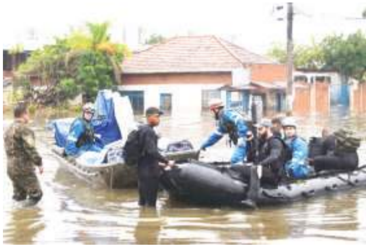
5月10日,救援人员在巴西南里奥格兰德州卡诺阿斯市用船搬运被淹医院的设备和药品。

按法新社说法,瓜伊巴河水位涨到3米时就会溢出。上周,这条河流的水位创下5.3米历史新高,在短暂消退后又开始上涨。阿雷格里港市政官员