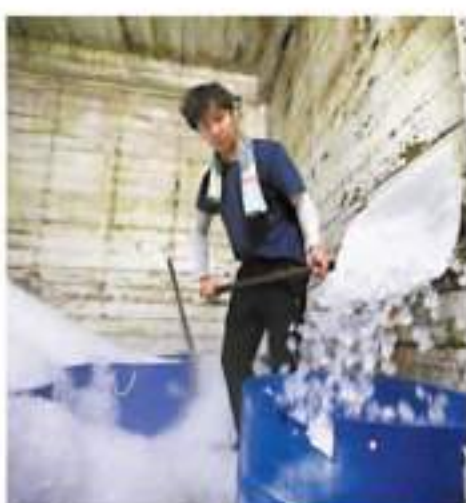
60年歷史的長洲冰廠，保留人手鑄冰。

除此之外，太平洋醮的醮棚、包山架以及製作平安包的傳統老舖亦是本次行程參觀的景點之一，均由當地的居民向遊客講解背後的歷史，以及配合旅遊的發展，各種傳統的改造。在一些歷史悠久的平安包食店或手工店，老闆及職員亦會為旅客講解背後的由來以及製作流程，有些店舖還開設工作坊。