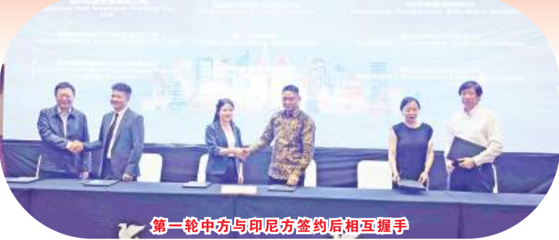
第一轮中方与印尼方签约后相互握手