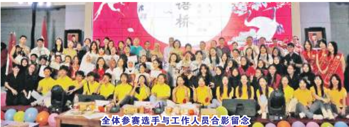
全体参赛选手与工作人员合影留念

【本报讯】2023年5月12日,印度尼西亚玛琅国立大学孔子学院(以下简称“玛琅孔院”)成功举办第23届世界大学生“汉语桥”中文水平比赛东爪哇省分赛(以下简称“汉语桥”比赛),此次“汉语桥”比赛的参赛者仍为“天下一家”,蕴含着我们对于中印尼两国友好往来,互助互利的深厚情谊的美好愿景。