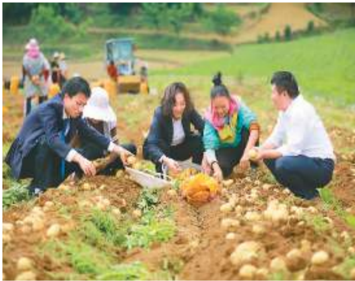
黔西农商银行雨朵支行强化金融服务“三农”，积极推行“产业贷”，助力当地土豆种植等特色产业。图为该行工作人员在贵州省黔西市雨朵镇平坝村了解土豆收获情况。

融风险监测评估，稳妥处置重点区域和重点机构风险。有序推进金融支持融资平台债务风险化解。强化金融稳定保障体系建设。