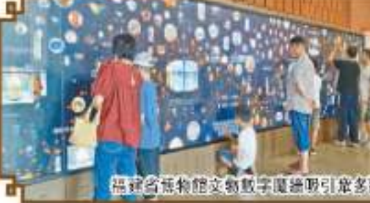
福建省博物館文物數字展廳吸引眾多觀眾

推進科技成果展示應用，在2022年數字中國建設峰會上主辦「數字化讓文物活起來——博物館數字化成果展」專題展區，展示福建博物院、福建閩越王城博物館、福建省晉江山連址博物館、福建民俗博物館、福州市博物館、廈門市博物館等近20家省內博物館數字化項目成果，取得良好效果。同年，在鄭州「博博會」上主辦「遇見文物發現文明——福建文物展區」，宣傳展示福建博物館數字化保護利用成果，受到參觀觀眾的廣泛好評。2023年「5·18國際博物館日」中國主會場活動在福建福州舉辦，活動期間福建博物院升級打造「智慧書院」「沉浸式光影秀展」等多個科技含量豐富的參觀互動點位，吸引大批觀眾來卡參觀。