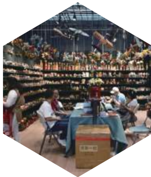
4月25日，第135屆廣交會上，參展商和採購商在禮品類展區相談甚歡。中新社記者 陳楚紅 攝

伴隨禮品市場消費不斷升級，禮物經濟行業也迎來新的發展時期。實用性強且美觀大方的中國“好禮”成爲不少海外採購商的選擇。