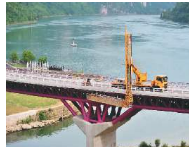
5月12日,专业技术人员对长江西陵峡畔的湖北省宜昌市夷陵区乐天溪镇莲沱大桥进行安全检查,形成“一桥一档”技术档案检查报告。

伊斯坦布尔南通道运输测试,成功开行新疆乌鲁木齐至意大利萨莱诺跨里海、黑海中欧班列,中欧班列南通道运输组织日益成熟,1至4月经南通道累计开行中欧班列12列,同比增长71%。运输效能不断增强。与周边国家铁路部门加强合作,优化中欧班列跨境运输组织,合理匹配境内外列车编组方式,提升中欧班列运输效率,节约运输成本。每周稳定开行5列西安与德国杜伊斯堡、成都与波兰罗兹间全程时刻表中欧班列。