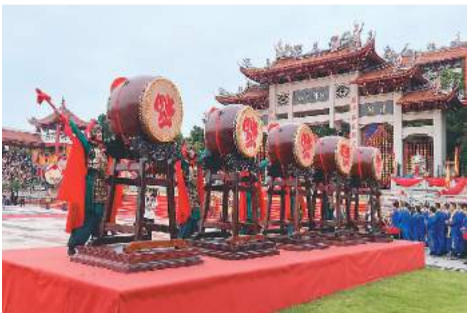
图为甲辰年春祭妈祖大典现场。

参加春祭妈祖大典、共同体验妈祖信俗、了解台胞在妈祖故里湄洲岛的创业生活情况……日前，“三月廿三媒体湄洲行”联合采风活动在福建莆田湄洲岛举办。来自海峡两岸的数十名媒体记者共同探寻妈祖文化，了解湄洲岛在探索两岸融合发展新路中的实践成果。