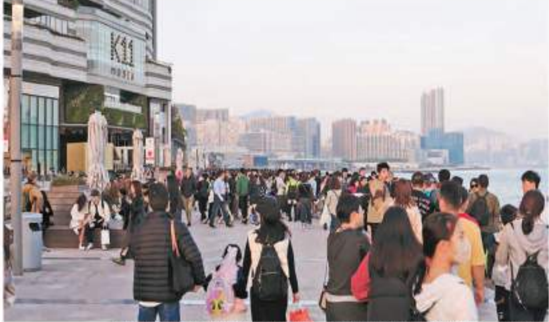
內地再開放多8個城市赴港「自由行」，業界估計對港有很大提振作用。

【香港商報訊】記者周偉立報導：國家出入境管理局上週六宣布，本月27日起再增8個內地城市開放港澳自由行，包括山西省太原市、黑龍江省哈爾濱市等，令自由行適用城市增至59個。文化體育及旅遊局局長楊潤雄昨日稱，會與相關部門及相關行業機構做好協調工作，令旅客從口岸接待到交通都能暢順，並於不同景點體驗香港的獨特旅遊特色。零售業界相信來自這8個地方的旅客，對香港會有很大新鮮感，因應部分旅客可能是少數民族，業界會密切留意情況，適時調節策略。有酒店業人士表示，今次政策對香港有很大提振作用，本港酒店有足夠承载力應付。