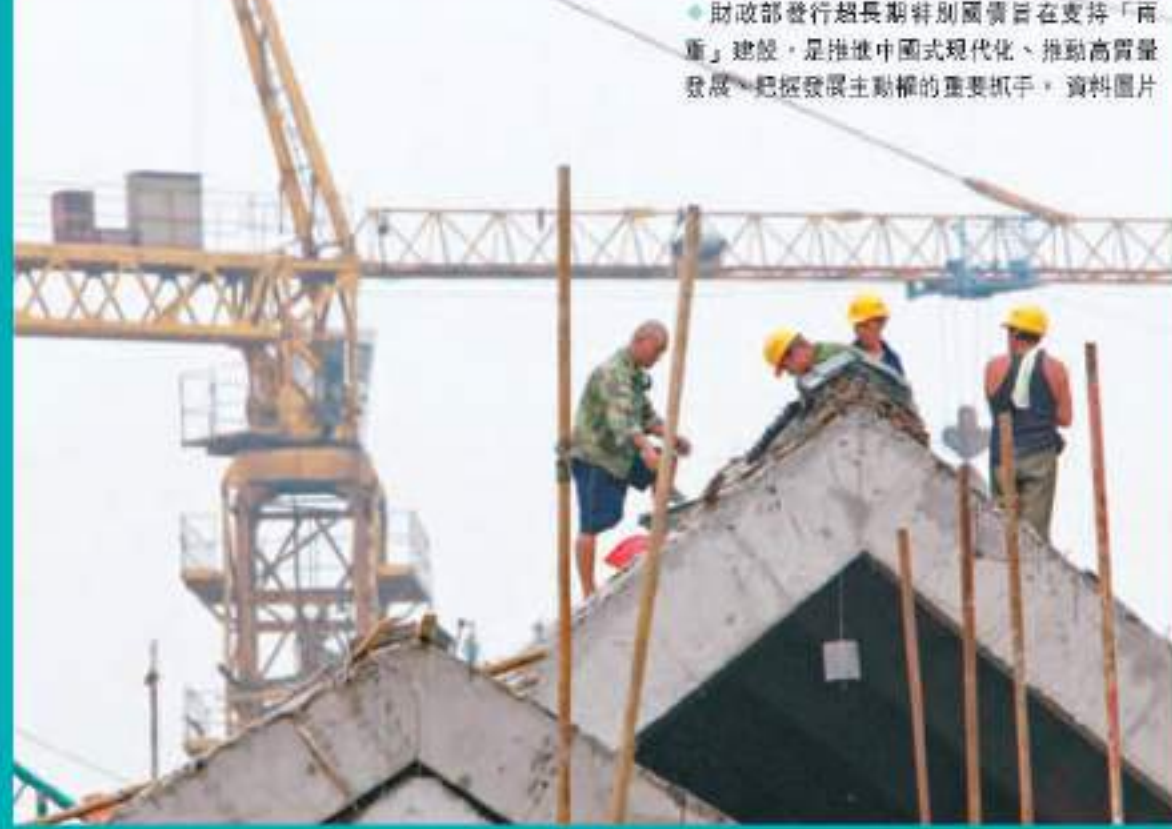
◆財政部發行超長期特別國債旨在支持「兩重」建設，是推進中國式現代化、推動高質量發展、把握發展主動權的重要抓手。資料圖片

中國財政部13日公布了2024年一般國債、超長期特別國債發行有關安排。其中，超長期特別國債擬自5月17日(本周五)至11月15日期間發行，債券期限分為20年、30年和50年，均按半年付息。按照財政部此後發布的公告，財政部將於17日招標首發400億元(人民幣，下同)30年期特別國債，為今年首期。從發行方式來看，市場預計，特別國債的發行方式可能更加偏向市場化發行，而非定向發行。有專家建議，超長期特別國債應同時面向機構和個人發行，讓居民也可參與認購投資。 ◆香港文匯報記者 海巖 北京報道