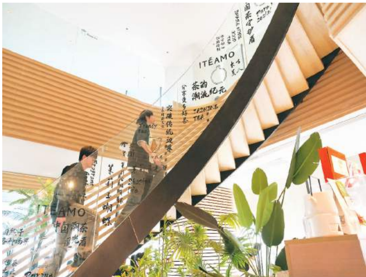
▲福建省福州市东百大楼内的泰伦ITEAMO茶空间。