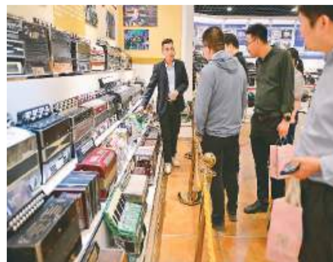
随着夏季来临，新疆维吾尔自治区伊犁哈萨克自治州伊宁市旅游市场持续升温。历史悠久的六星街、独具特色的喀赞其景区等地，吸引越来越多的游客前来观光游览。图为游客在伊宁市六星街亚历山大手风琴珍藏馆参观。

和重点领域安全能力建设，今年先发行1万亿元。根据发行安排，5月17日开始发行30年超长期特别国债，5月24日开始发行20年超长期特别国债，6月14日开始发行50年超长期特别国债。从发行批次来看，20年超长期特别国债有两批，分别分3—4次发行；30年超长期特别国债有三批，每批分4次发行；50年超长期特别国债有一批，分3次发行。