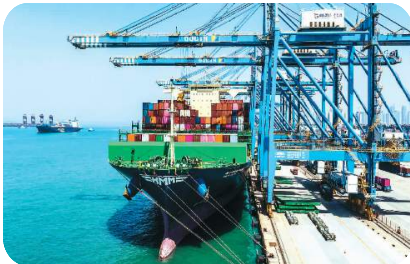
▲港口的自动化智能化技术正在为 AEO 制度发展提供更大空间。图为 5 月 1 日,在山东港口青岛港自动化码头,无人驾驶的吊装机将集装箱快速有序地装载到集装箱船上。

AEO 是英文 Authorized Economic Operator 的缩写,意思是“经认证的经营者”。AEO 制度是由海关对企业的信用状况、守法程度和安全水平进行认证,通过认证的企业可获得海关给予的优惠便利措施。作为 AEO 领域最高级别的全球性会议,本届大会上来自 100 多个国家和地区的 1200 余名代表共同就如何更好促进全球贸易分享经验、建言献策。