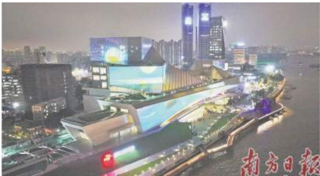
新時代的旋律—展灣區文藝時代風采