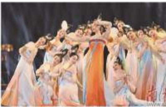
新時代的旋律—展灣區文藝時代風采

東省非物質文化遺產館、廣東文學館開館。重要灣區文化新地標珠江畔傲然屹立。5月1日起，白鵝潭大灣區藝術中心面向公眾開放。