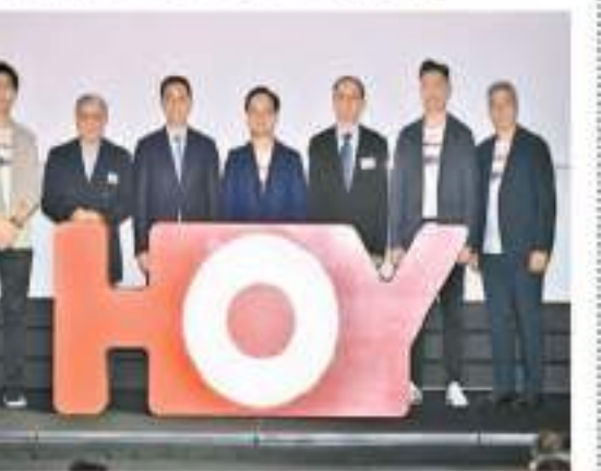
楊潤雄（左三）等嘉賓主持啟動儀式。

【香港商報訊】記者唐信恒報導：有線寬頻通訊有限公司昨日舉行有線電視HOY TV轉播「2024巴黎奧運會」啟動禮。文化體育及旅遊局局長楊潤雄為廣播機構利用政府購入的播映權安排電視轉播賽事，讓全港市民可為國家隊和中國香港隊打氣，回應香港社會在這方面的期望，並希望合作能發揮乘數效應，營造社會團結氛圍，可刺激經濟活動。