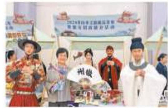
黃山市文旅新品發布暨敬親招商推介活動現場。

【香港商報訊】記者吳敏、通訊員吳熾、余晨輝報道：近年，歙縣堅持市場化、產業化、品牌化、數字化導向，積極打造豐富多彩的旅遊產品、旅遊場景和旅遊業態，通過提前「造勢」、引流留粉，在實現節假日旅遊市場人氣爆發式增長同時，實現節後错峰出遊的態勢，文旅產業一業興促百業旺的效應更加凸顯。