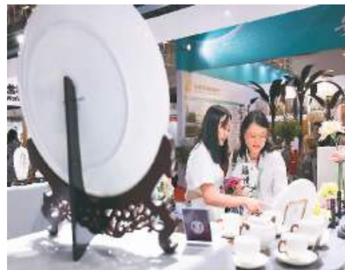
近年来，福建省福州市德化县整合当地资源，从科技创新、财政税收等领域出台多项举措，推动德化陶瓷从传统到高新、从低端到高端、从制造到智造的迭代升级，促进陶瓷产业高质量发展。图为5月12日，观众在第四届中国工艺美术博览会德化陶瓷展区参观。

中国汽车协会常务副会长兼秘书长付炳锋在活动上表示：“从最初的模仿与跟随，到如今的创新与引领，经历一代代汽车人的接续奋斗，当下中国汽车产业正以蓬勃活力，在高质量发展的新征程上，全面实现品牌向上。”