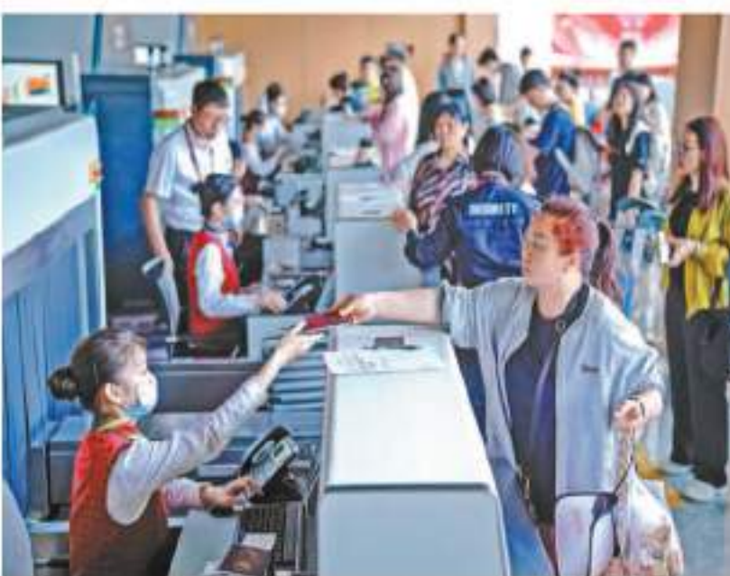
乘客在山西運城聖喬治國際機場辦理登機手續。

5月14日8時至15日8時，西南地區東南部、廣西西北部、海南島、台灣島東部等部分地區有中到大雨，其中，貴州西南部、海南島東南部等部分地區有暴雨（50-90毫米）。