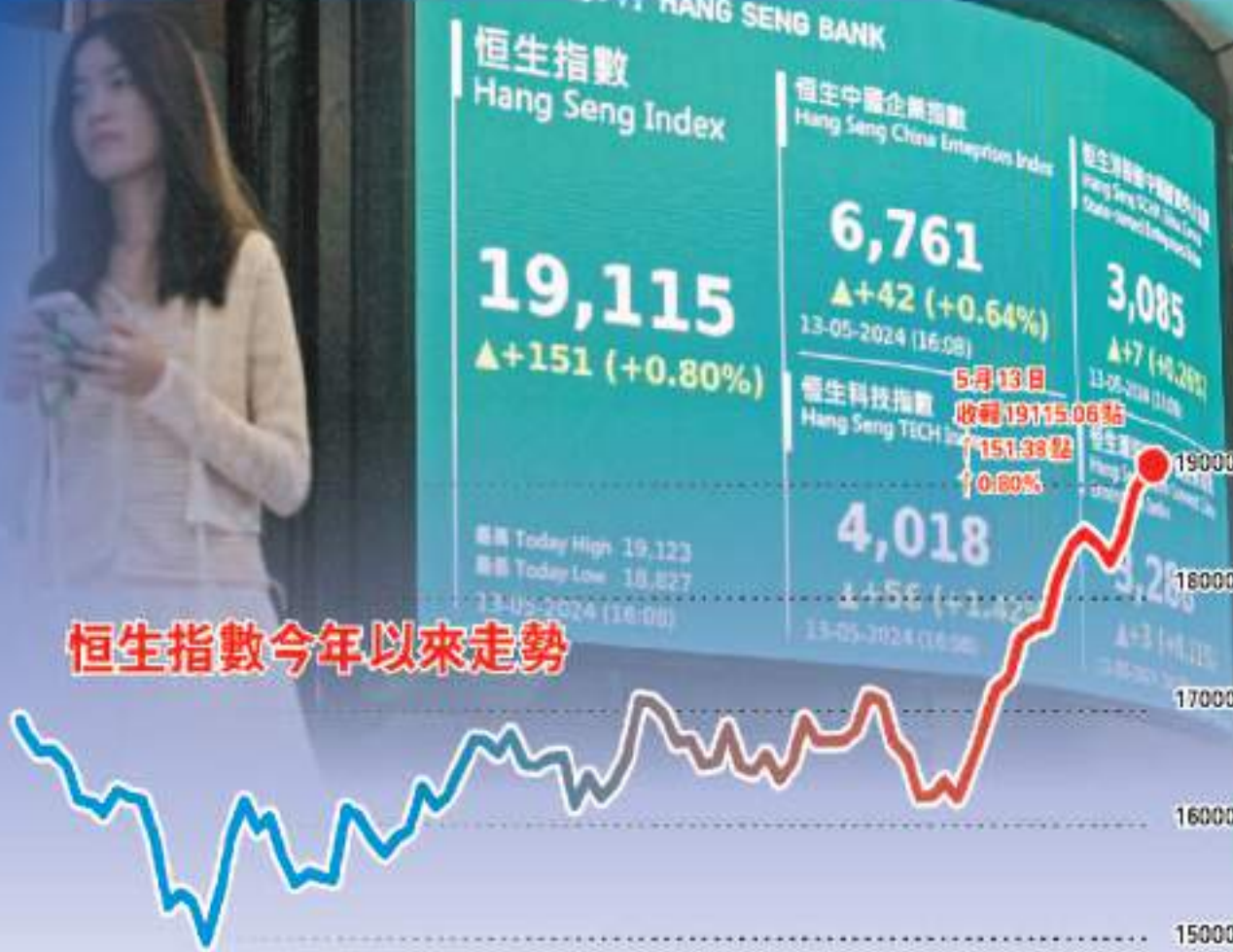
恒生指數今年以來走勢

【香港商報訊】記者鄭偉軒報道：放量上行連升三日，港股市重返牛犇角！昨日，恒生指數在ATM（即騰訊控股（700）、阿里巴巴（9988）及美團點評（3690））合力帶動下，突破19000點收市，報19115.06點，升151.38點，這是自去年8月以來首次，大市成交達1472億元。市場分析稱，短線將續呈「超買再超買」格局，料恒指後市有望高見20000點。