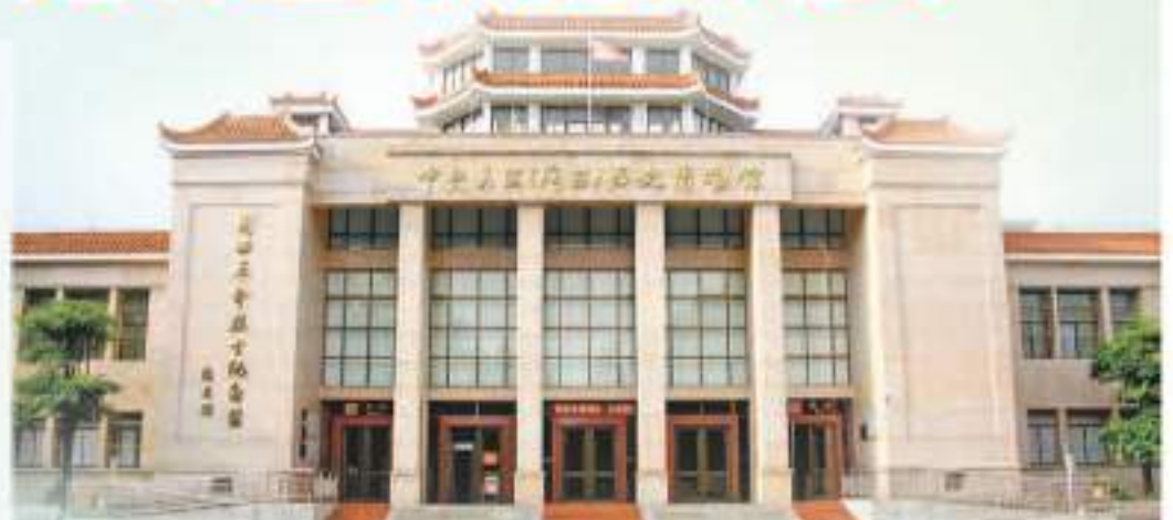
中央蘇區（閩西）歷史博物館

近年來，隨著中國博物館事業持續發展，博物館教育、研究職能進一步發揮，在促進人的全面發展和社會全面進步等方面的積極作用日益凸顯。福建省着眼精準高效提升博物館公共服務能力水平，不斷推出具有福建特色的陳列展覽、學術研討、公眾互動等活動，提高博物館管理和建設數字化、規範化、多樣化水平，博物館事業發展再上新台階。