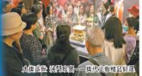
坑店遺址·張門遺址——唐代文物精品特展

發揮福建是「海上絲綢之路」核心區的優勢，認真踐行「一帶一路」倡議，加強海內外文化交流與合作，舉辦「儒冠之子·大美初見——亞美尼亞19-20世紀文化遺產展」，邀請亞美尼亞專家為展覽開幕。舉辦「絲綢韻——中國海上絲綢之路文物精品圖片展」，在亞美尼亞共和國首都埃里溫開展開幕，為中亞人文交往注入新的內涵。應法屬國家建築博物館邀請，在法國巴黎開幕「福建土樓活化利用」專題展覽，進一步深化中法兩地文化交流。組織德化白瓷首次赴紐約舉辦「中國白·德化瓷」國際巡展，提升德化白瓷國際影響力，增強中美人文交往內涵。