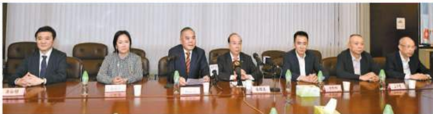
第二屆同鄉社團家鄉市集嘉年華將於6月初舉行，昨日記者會介紹詳情。

此外，今次市集比上屆再多兩個社團加入，分別是來自內蒙古和新疆兩個自治區同鄉社團，一共有28個社團參與。