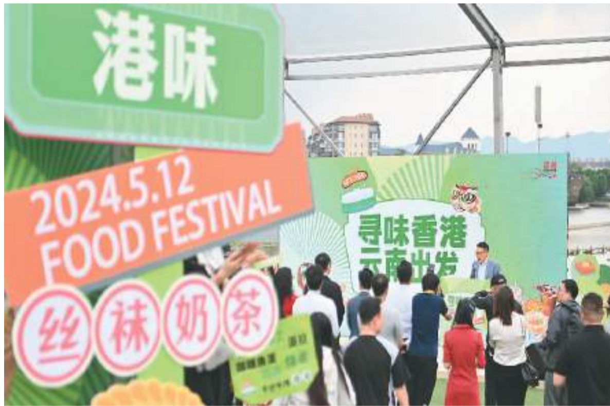
图为活动现场。

5月12日，“寻味香港 云南出发”香港云南美食交流活动在云南省昆明市举办，咖哩鱼蛋、港式丝袜奶茶、西多士等香港美食为现场市民带来“港式风情”。