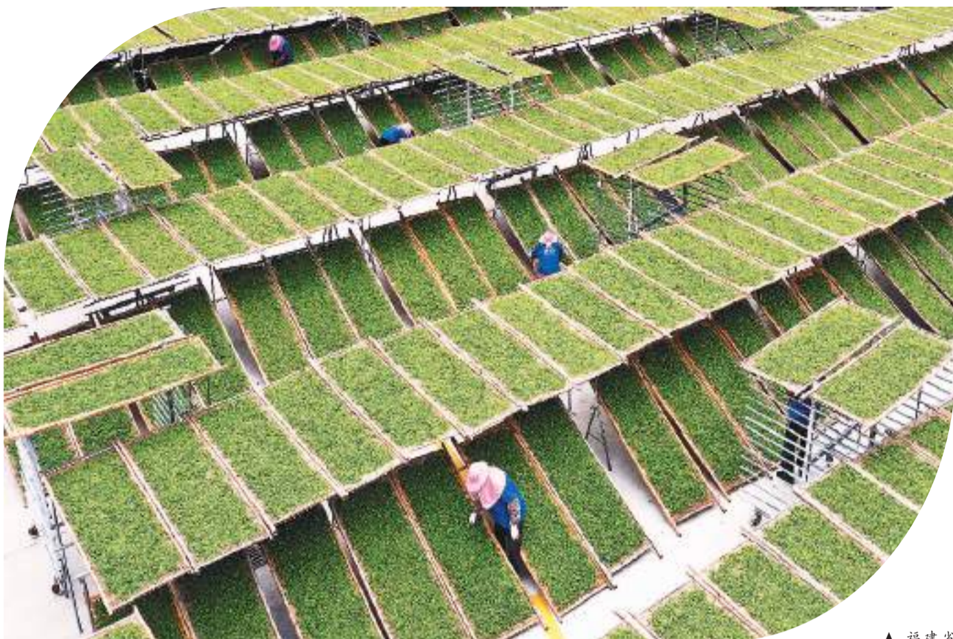
▲福建省福鼎市前岐镇小岳村，工人们在晾晒白茶。

中国是茶的故乡，福建是产茶大省。近年来，福建茶界持续开展茶文化、茶产业、茶科技的探讨、交流和研究，探索“三茶”统筹发展的创新模式。目前正值福鼎白茶、武夷岩茶、安溪铁观音等多种茶的采摘季。福建茶产业正加速融入文旅、餐饮、大健康等赛道，催生新茶饮、茶美食、茶庄园等新产品、新业态，形成新的茶文化元素。如今，古老的中国茶文化不断融入大众生活，正迎头赶上新“国潮”。