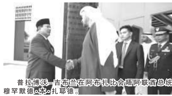
普拉博沃-吉布兰在阿布扎比会晤阿联酋总统穆罕默德·本·扎耶德。

【本报讯】5月14日，当选总统与副总统普拉博沃-吉布兰在阿布扎比的Al Shati 宫会见了阿拉伯联合酋长国总统穆罕默德·本·扎耶德（MBZ）。普拉博沃和吉布兰相应地穿着黑色西装出席会议，普拉博沃和吉布兰受到穆罕默德·本·扎耶德总统的亲