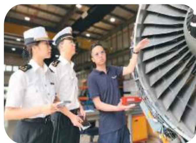
▲4月24日,深圳海关所属福强海关主动登门对深圳汉莎技术有限公司提供 AEO 便利化政策辅导,助力企业在航材维修领域更好发展。

既有思维,以全新的眼光看待全球贸易。特别是 AEO 国际互认,可以让企业凭借良好信用优势获得更多贸易伙伴国海关的认可,从而大幅降低贸易成本、激发贸易潜力。