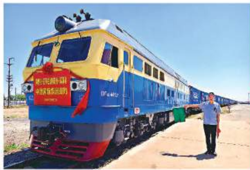
◀5月13日，河北滄州黃驊港至莫斯科中歐班列首次開行。▶ 中新社

香港文匯報訊 綜合央視新聞、新華社及中新社報道，今年1至4月，中歐班列累計開行6184列，發送貨物67.5萬標箱，同比分別增長10%、11%。截至2024年4月底，中歐班列已累計開行超8.9萬列，通達歐洲25個國家223個城市。今中國不斷開闢外貿新通道，多個港口、樞紐站煥發出新活力。