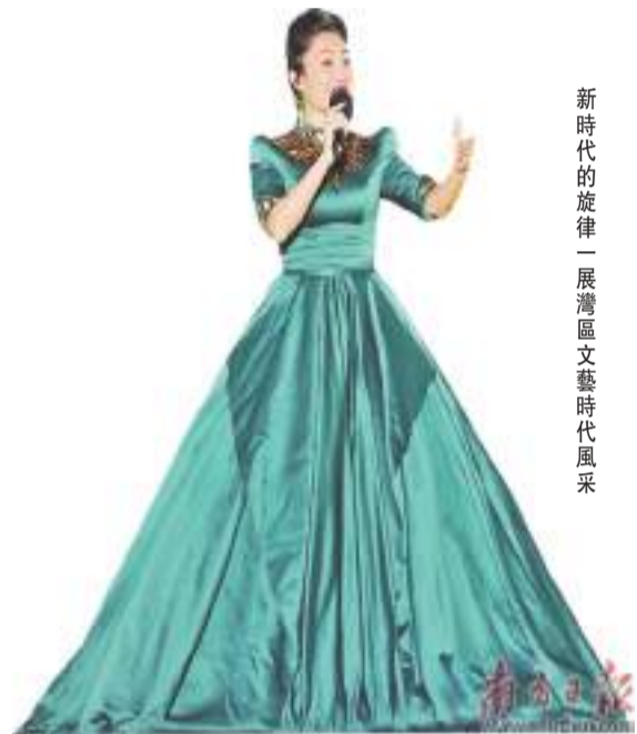
新時代的旋律—展灣區文藝時代風采