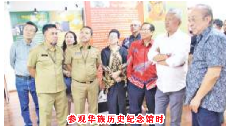
参观华族历史纪念馆时