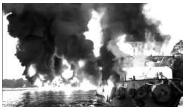
中加省南巴里托水域2艘船起火

几乎烧毁了拖船的整个船体，而木头制成的商船则被大火烧毁。中加里曼丹警区公关系主任埃兰·穆纳吉上校 (Erlan Munaji) 表示，两艘船的失火事件发生在早上5点30分许。该事件导致拖船上的8名船员失踪，1名船员幸存。商船上共有5人，其中2人失踪，3人幸