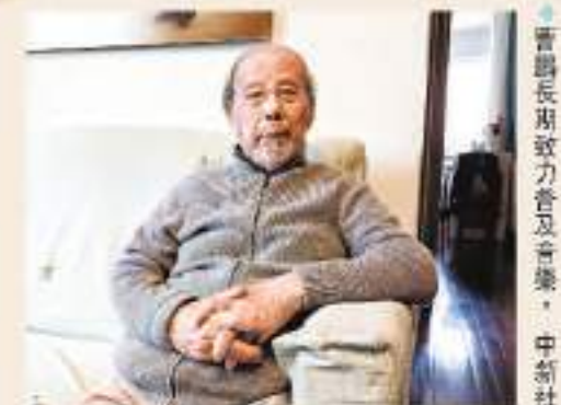
曹鵬長期致力普及音樂。

儘管自閉症孩子取得了常人難以想象的進步，但曹鵬的團隊並未止步於此。曹鵬認為，學音樂只是打開這些孩子的耳朵，還要學文化知識，讓他們和世界發生更多的連接。為此，他們開設了「愛課堂」「愛咖啡」等自閉症兒童關愛項目，幫助孩子們學會溝通、掌握知識、獲得技能、融