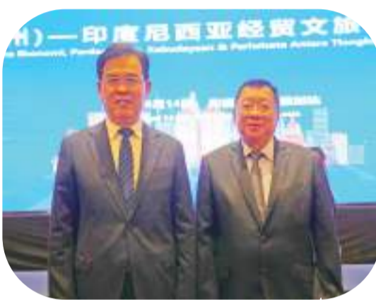
李炳军省长与张锦雄总主席