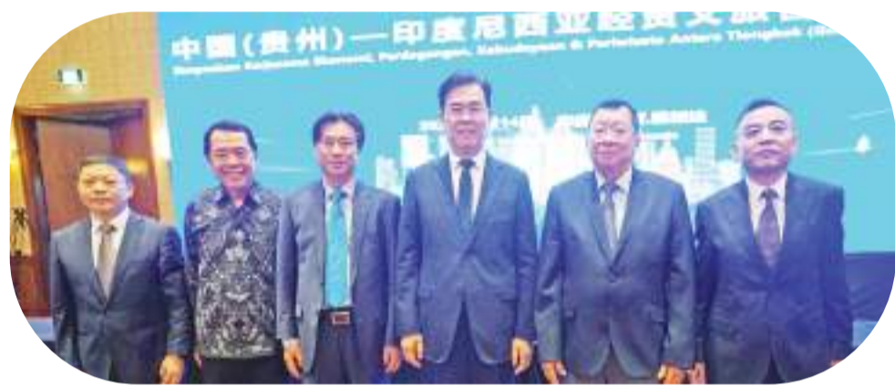
李炳军省长(右三起)周斌参赞、张锦雄(右二)、洪培才、李劲松、谢强(右一)

会上,李炳军省长致词表示感谢各位嘉宾莅临参与座谈会,他也介绍了贵州的人文、地理、旅游环境。贵州位于中国西南部,北接四川、重庆,东毗湖南、南邻广西、西连云南,是西南地区交通枢纽,长江经济带重要组成部分。总面积约为17.62万平方千米,常住人口近4000万人。是国家级大数据综合试验区,国家生态文明试验区,内陆开放型经济试验区。贵州历史