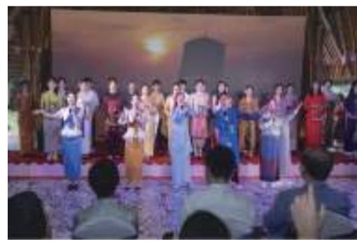
活動中，廣東外語外貿大學外教老師和學生，帶來具有東南亞風情的特色節目。

2024年是中國—東盟人文交流年，雙方將圍繞青年、民間、教育、文化等領域開展多場友好交流活動，以推動互利合作，促進包容共存，不斷提