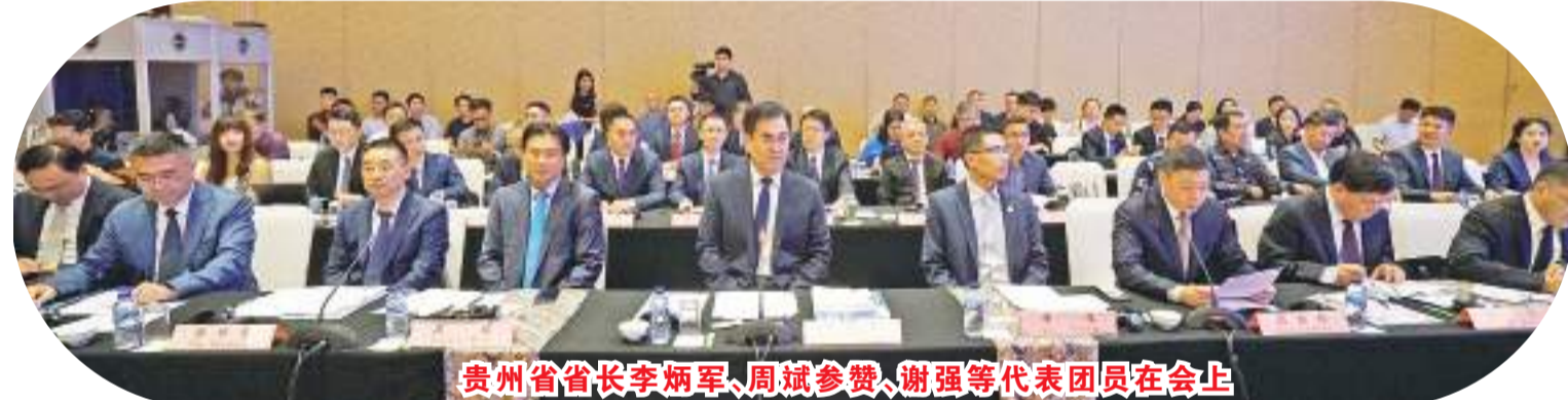
贵州省省长李炳军、周斌参赞、谢强等代表团员在会上

悠久,是中国古人类的发祥地和中国古文化的发源地之一。他说,“这次主要的重点是促进与东南亚国家东盟之间的合作(一)加强经贸合作,如从印尼进口橡胶、棕榈油等特色产品,促进两地的贸易,(二)加强文化与旅游领域合作,开拓雅加达-贵阳新航线,(三)加强矿产资源合作,(四)加强农业方面合作,如有机化肥、绿色农药、水稻种植。同时也包括渔业等。他最后说,“今也诚挚邀请各位到贵州旅游参观,我们在贵州等大家的到来。”