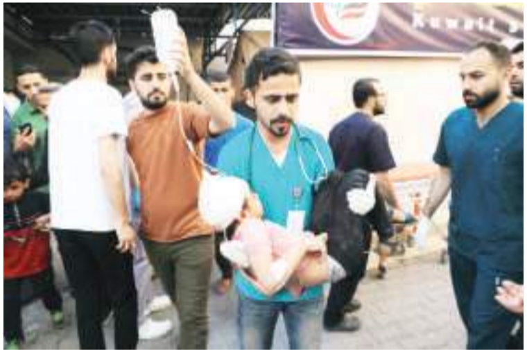
5月8日,医护人员在加沙地带南部城市拉法一处医院转移受伤的儿童。

新华社北京5月14日电 美国国防情报局前官员、陆军少校哈里森·曼13日在一封公开信中说,他去年11月辞职,是为了抗议美国支持以色列对加沙地带展开军事行动、造成平民死亡。