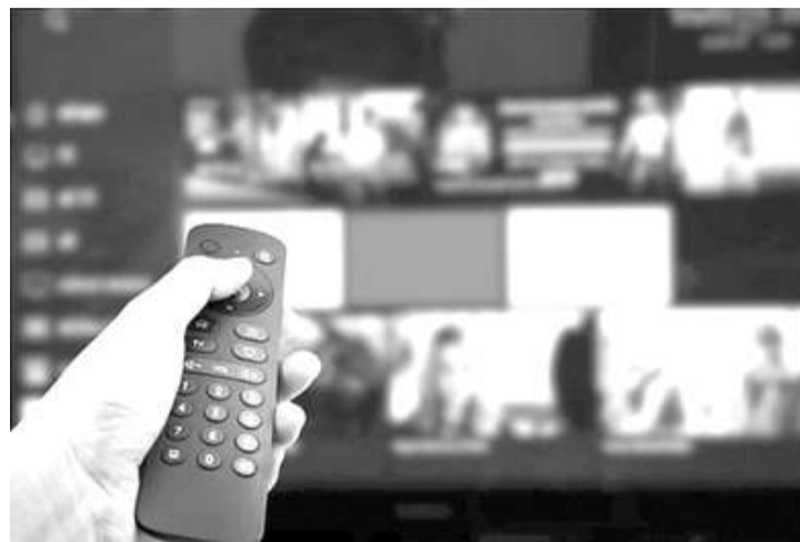
广播法案草案责令外国广播运营商在我国成立法人企业。

原来，宪法法院法的修订计划于2023年12月初由国会通过。然而当时国会确认，宪法法院法的修订不会在2023年12月5日举行的全体会议上通过。国会副议长达斯科 (Sufmi Dasco Ahmad) 表示，做出这一决定并不是因为当时的政治、法律与安全统筹部长马福于2023年12月4日提交了国会一封信。据悉，宪法法院法要修改的内容之一是，宪法法官的服务期从原来的最长15年或直到70岁恢复为5年。对于现任法官将被送还给提议机构，通过确认确定其命运。除服务期或任期外，宪法法官的最低年限或许也将从55岁改为60岁。（亮剑）