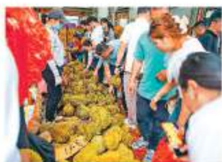
◀5月9日，在位於廣西南寧市壯觀大道的海吉星農產品國際物流中心，民眾在選購榴蓮。▶

中國好物不斷走出去的同時，外國好物也在不斷進來。廣西欽州港是西部陸海新通道陸海聯運的樞紐，大量來自中國西部地區和東盟國家的貨物在這裏集裝。截至5月12日，西部陸海新通道班列運輸集裝箱貨物今年已突破30萬標箱。