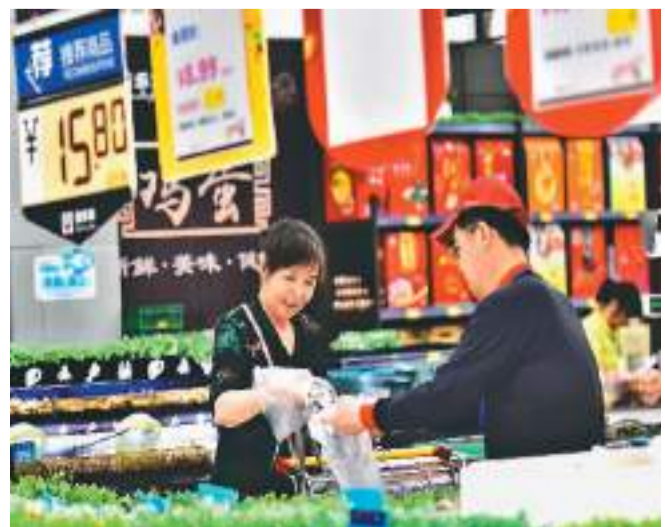
顾客日前在山东省青州市一家超市选购商品。

董菊娟表示，4月份，受国际原油、有色金属价格上行影响，国内石油和天然气开采业、石油煤炭及其他燃料加工业价格环比分别上涨3.4%和1.0%。煤炭供应充足，电煤需求季节性回落，煤炭开采和洗选业价格环比下降3.0%。消费品制造业中，文教工美体育和娱乐用品制造业、纺织服装服