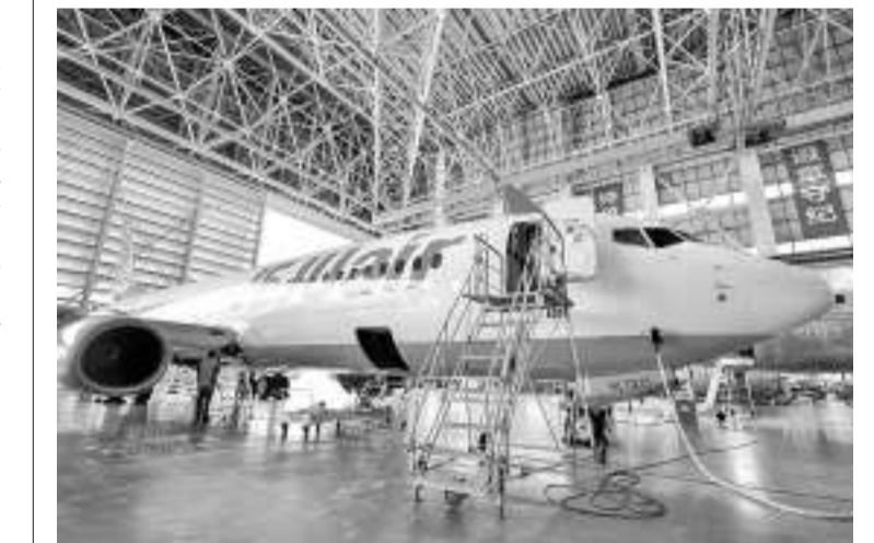
海南自贸港承接首单韩国进境飞机维修业务 5月13日,海航技术旗下大新华飞机维修服务有限公司的机务维修人员在对进境飞机进行检修。近日,一架来自韩国济州航空公司的波音737-800飞机来到海南自贸港一站式飞机维修产业基地定检机库内,接受海航技术旗下大新华飞机维修服务有限公司提供的专项维修服务。这是海南自贸港首次承接韩国进境飞机维修业务。本次韩国进境飞机执行的维修项目预计维修周期约为16天,可享受进境维修免保证金、加注保税航油、维修航材免税等海南自贸港优惠政策。

犯罪活动的坚定决心。驻菲使馆指出,中国法律禁止任何形式的赌博活动,包括网络博彩、在境外开设赌场并招揽中国公民参赌等行为都是违法的。中国政府一向严厉打击赌博。驻菲使馆将继续加强同菲方的务实执法合作,支持菲方早日彻底解决离岸博彩业相关顽疾。