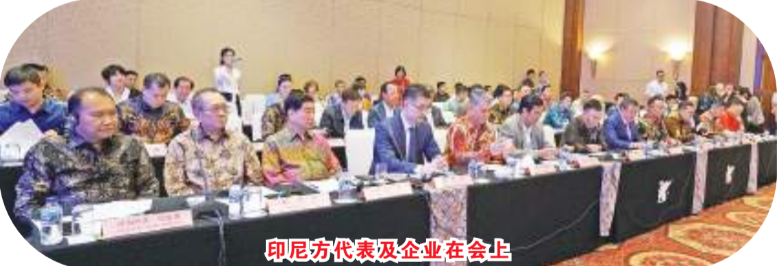
印尼方代表及企业在会上