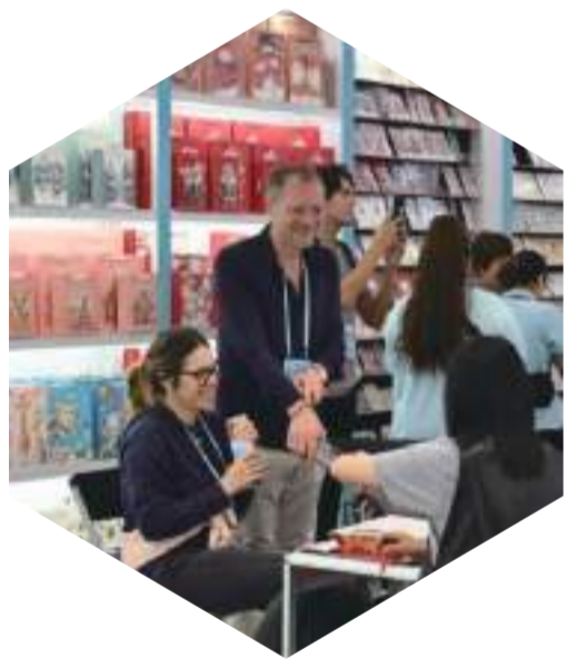
4月25日，第135屆廣交會上禮品類展區展品琳琅滿目。

“我們的產品算是一道別致的風景綫，產品展現出不同節日的氣氛，這讓來到我們展位的採購商大呼精彩。”該展位相關負責人表