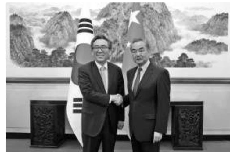
王毅同韩国外长赵兑烈举行会谈 5月13日,中共中央政治局委员、中国外交部长王毅同韩国外长赵兑烈在北京举行会谈。

韩国政府还对反对党喊话称,拿此次事件营造“反日”氛围不利于国家利益和企业保护,并要求政界就此开展跨党派合作。韩国政府对此事的应对遭在野党批评。祖国革新党代表曹国13日宣布当天登陆韩国存在主权争议的独岛(日本称竹岛),称尹锡悦政府为“历史上最糟糕的亲日政府、最糟糕的卖国政府”。日媒称,韩国政府正极力避免日韩关系因此事再度恶化。