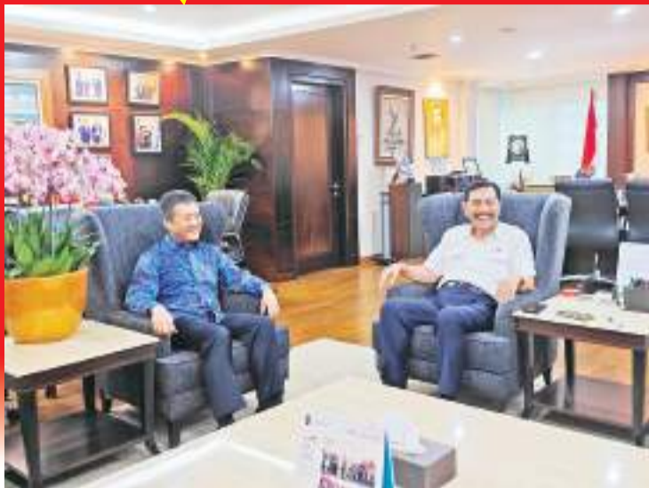
陆慷大使辞行拜会卢胡特统筹部长

【本报讯】据来自中国驻印尼使馆消息:5月13日,陆慷大使辞行拜会印尼对华合作牵头人、海洋与投资统筹部长卢胡特。