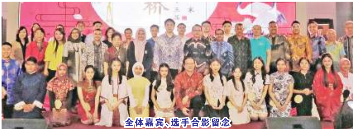
全体嘉宾、选手合影留念