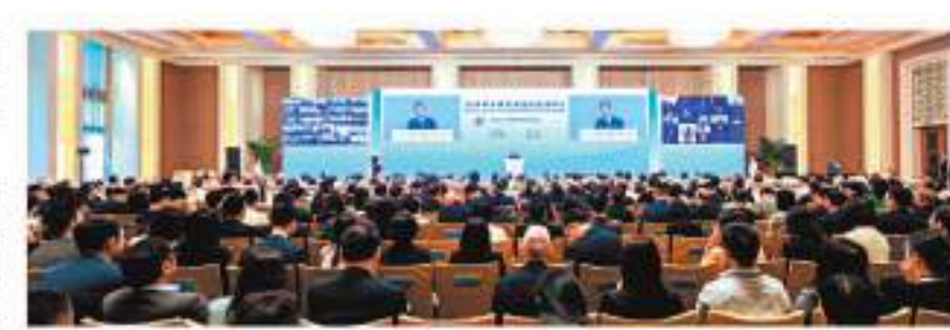
◀2024年全球貿易投資促進峰會15日在北京釣魚台國賓館舉辦。

香港文匯報訊 綜合報道，近日，特斯拉上海儲能超級工廠建設項目已完成施工許可證發給，這是特斯拉在美國本土以外的首個儲能超級工廠項目。 上海自貿試驗區临港新片區管委會消息，該上海儲能超級工廠將生產超大型商用儲能電池Megapack，該產品基於一體化系統集成和模塊化設計，幫助電網運營商、公用事業公司等更高效地存儲和分配可再生能源，是迄今為止世界上最大的電化學儲能設備。 據悉，Megapack每套機組可存儲超過3.9MWh（兆瓦時）的儲能，足以滿足3,600戶家庭1小時的用電需求，200多套Megapack可以組成一個儲能電廠，可儲存100萬度電，滿足舊金山市6個小時的用電需求。 據悉，Megapack每套機組可存儲超過3.9MWh（兆瓦時）的儲能，足以滿足3,600戶家庭1小時的用電需求，200多套Megapack可以組成一個儲能電廠，可儲存100萬度電，滿足舊金山市6個小時的用電需求。 據悉，Megapack每套機組可存儲超過3.9MWh（兆瓦時）的儲能，足以滿足3,600戶家庭1小時的用電需求，200多套Megapack可以組成一個儲能電廠，可儲存100萬度電，滿足舊金山市6個小時的用電需求。