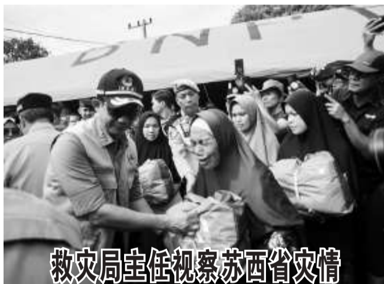
救灾局主任视察苏西省灾情 国家救灾机构(BNPB)主任苏哈延托(Suharyanto/左)在苏西省阿干(Agam)县进行实地视察,并向灾民分发粮食援助时声称,共有6个市县区发生了洪灾和土崩,在这起灾难中约有50人死亡,当地省府也宣布14天紧急应对期。

能工厂的开工建设,标志着我们的全球化进入了重要的一步。这也是我们对广阔的印尼市场的承诺。未来,我们将带来本公司最先进的工具和技术,打造现代化、智能化、数字化、环保的工厂。我们将在这里建立一个研究中心,以满足印尼人民的需求。工厂建成后,预计将创造3000多个新工作岗位。此外,雅迪公司还将积极培训新的本地专家,以鼓励这里的可持续增长。 Suryacipta工业城销售和营销副总裁Abednego Purnomo表示,雅迪公司还计划在印尼生产电池,甚至扩大其制造工厂。然而雅迪公司扩张的信号将很快实现,这对Suryacipta工业城来说无疑是个好消息。雅迪决定在加拉璜的Suryacipta工业城建立工厂,是因为靠近雅加达,周围还有许多供应链公司,专业的区域管理和Suryacipta工业城信息中新的一站式服务,这极大地帮助了租户在印尼开展业务。雅迪电机厂的入驻必将为印尼制造业做出重要贡献。此外,周边社区也可以感受到乘数效应,例如创造有助于改善当地经济的新就业机会。(亮剑)