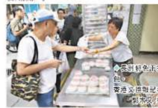
長洲特色平安包。

她又建議，相關航班的班次應該增加，「不過在這些城市開放後個人遊之後，我相信航班自然會增加，因為以前單向旅遊多，而航空公司一般傾向推出雙向航線。」