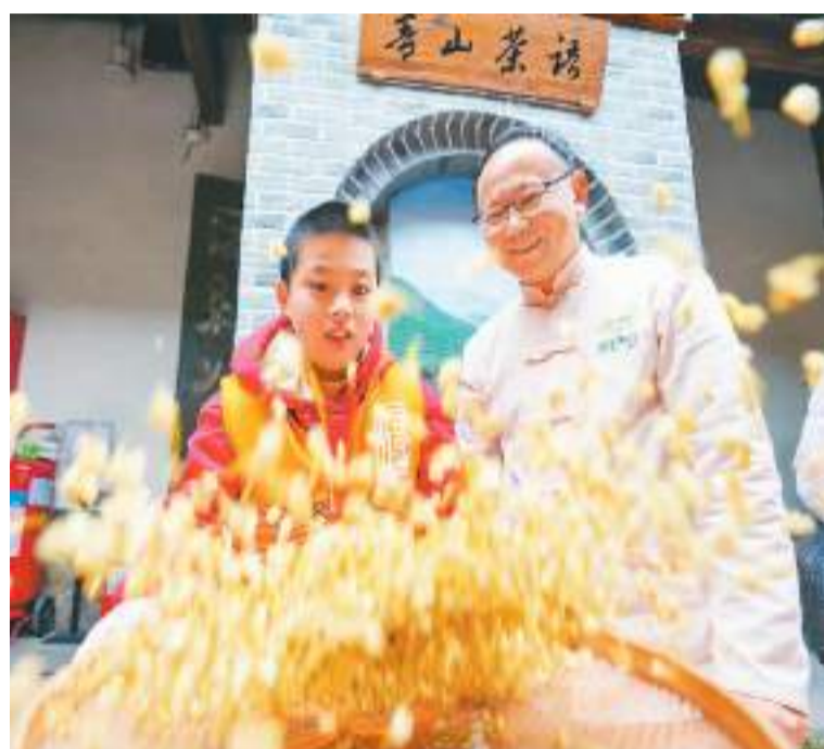
▲福建省福州市非物质文化遗产展示馆，小学生正在学习茉莉花茶窰制工艺。