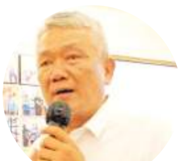
班邦提尔多市长致词

【万隆讯】5月7日,万隆兼任市长班邦提尔多(Bambang Tirta Yuliono)和民族团结和政治联盟机构官员、万隆旅游文化局局长及随员一行来到万隆渤良安基金会的华族历史纪念馆,一是做探亲拜访,二是参观华族历史纪念馆。