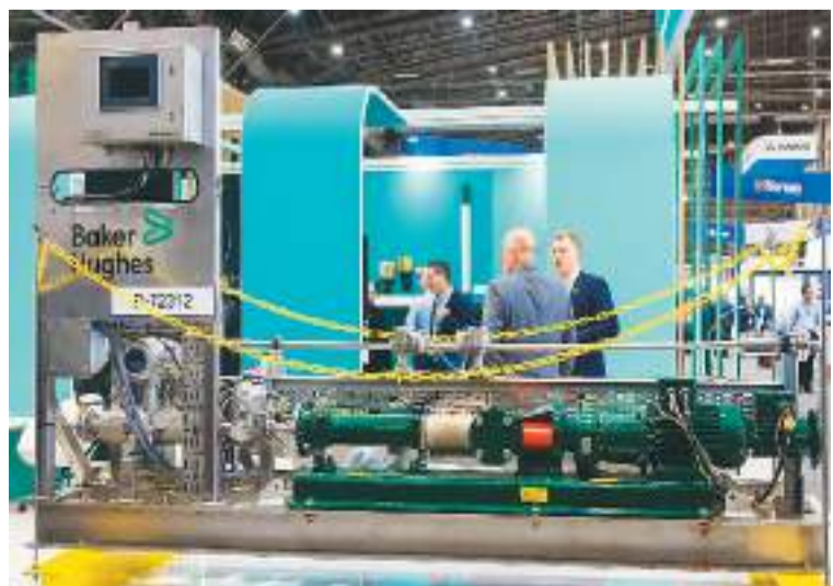
图为5月6日在休斯敦国际海洋油气技术大会及设备展上拍摄的展示装备。