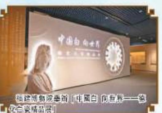
福建博物院舉辦「中國白·向世界——德化白瓷精品展」

博物館影響力持續擴大。成功舉辦2023年「5·18國際博物館日」中國主會場活動，舉辦了活動開幕式、主題展覽、學術論壇、博物館之夜等活動，得到了國家文物局和省領導的高度肯定，受到了社會各界廣泛關注和點讚。福建博物院推出「中國白·向世界——德化白瓷精品展」等多個具有福建特色的精品展覽。「華僑情懷 民族光輝——百國百僑百物展」榮獲2018年「全國博物館十大陳列展覽精品推介」、「宋詞裏的中國——閩山閩水物華新——福建省慶祝中華人民共和國成立75周年文物藏品專題展」等多個優秀展覽入選全國「弘揚中華優秀傳統文化，培育社會主義核心價值觀」主題展覽項目推介。推進文物與旅遊深度融合發展，使博物館成為特色旅遊目的地和文明旅遊典範，福建博物院「揚帆海絲少年行——2023年小小講解員研學營」、福建民俗博物館「四時非遺·福滿古厝」、廈門市博物館「夜讀廈門」和各地博物館「博物館裏過傳統節日」等諸多活動廣受群眾喜愛，吸引大批遊客前往打卡參觀。十年來，省內博物館累計舉辦各種展覽活動13000多場，參觀人數達2.7億人次，2023年參觀人數達3020萬人次。新度博後新高，「博物館」成為文化現象。「到博物館去」成為生活風尚。