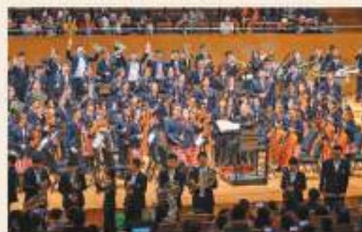
◆ 日前，一場主題為「愛在春天——曹鵬爺爺和他的孩子們」的交響音樂會登上第39屆上海之春國際音樂節的舞臺。

中新社記者日前前往曹鵬家中採訪，只見進門處用大提琴的面板做了裝飾，似乎告訴來客裏面住着一位音樂人。見到曹鵬時，他端坐在沙發上，手拉拐杖，目光炯炯有神。客廳裏擺滿了各