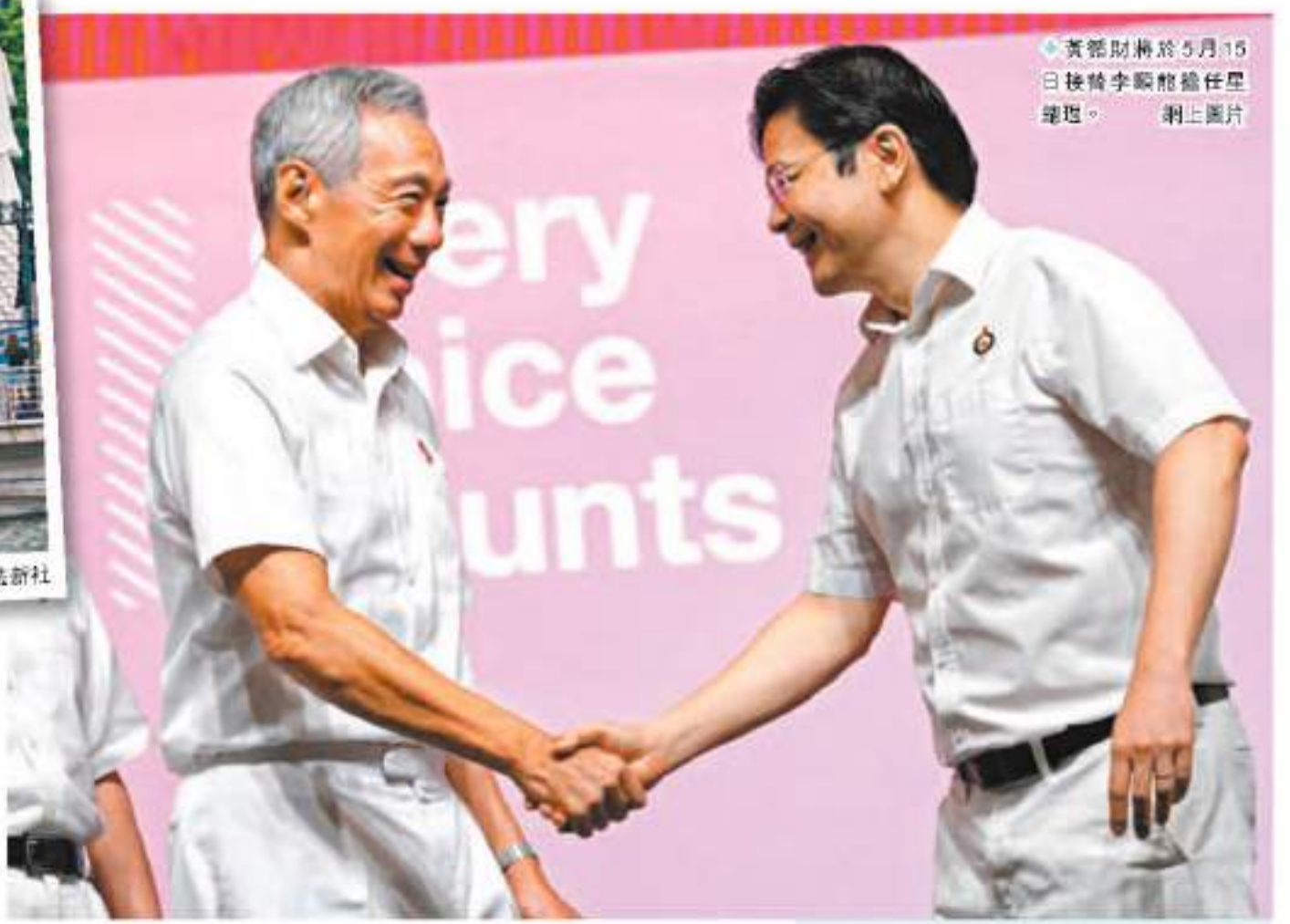
◆黃循財將於5月15日接替李顯龍擔任星總理。

香港文匯報訊 新加坡將於15日完成領導人交棒，現任副總理兼財長黃循財將接任總理，人口約600萬的新加坡，迎來20年來首位新總理。《金融時報》分析稱，新加坡的經濟發展、外籍勞工問題，以及執政人民行動黨數次爆出醜聞，都將考驗黃循財維持平衡的能力，他需要面對日益加劇的社會挑戰，以及正在升級的地緣政治緊張局勢。