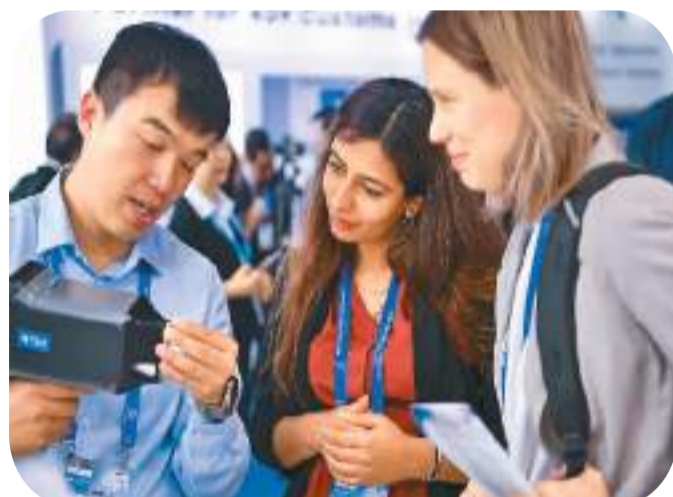
▲5月8日,外国嘉宾在第六届全球 AEO 大会中国海关展台上了解手持式再生金属分析仪。