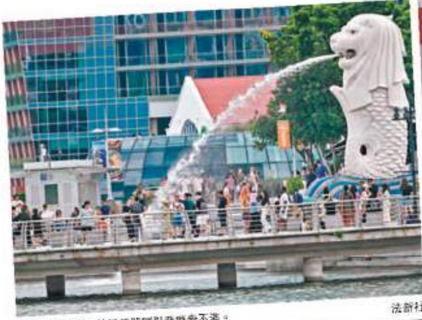
◆新加坡通脹、外勞等問題引發群眾不滿。