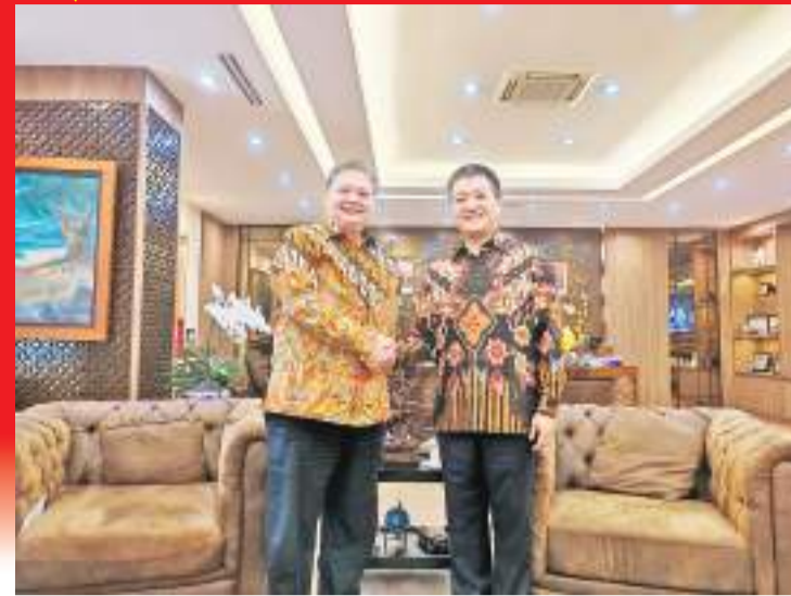
陆慷大使辞行拜会艾尔朗加统筹部长

【又讯】5月14日,陆慷大使辞行拜会印尼经济统筹部长、专业集团党总主席艾尔朗加。