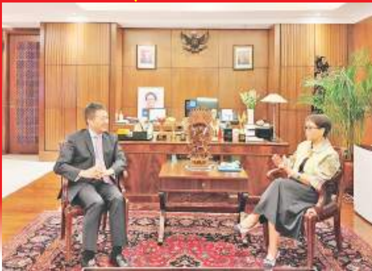
陆慷大使辞行拜会雷特诺外长

【本报讯】据来自中国驻印尼使馆消息:5月13日,陆慷大使辞行拜会印尼对华合作牵头人、海洋与投资统筹部长卢胡特。