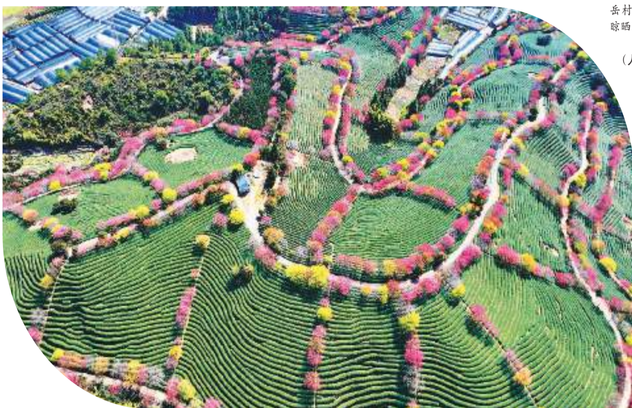
▲福建省漳平市吕坊村的一座高山茶园内，一株株嫣红的樱花与一垄垄嫩绿的茶树相互映衬。