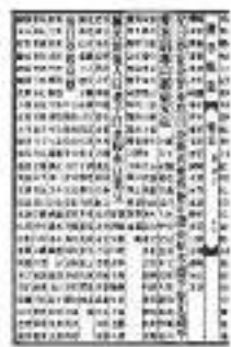
1933年《開平縣志》論「老豆」。

研究個別「方言詞本字」，經常是漢語方言學入面不容易攻克的課題，中國要到了解放之後才陸續在大範圍推行普及教育。到了今天除了高齡長者之外，完全沒有受過基礎教育而一字不識的中國人算是比較罕見。中國幅員廣闊，方言眾多，同一種物事在不同的方言區可以有差距很大的叫法。近日見到網上又有談論我們廣府稱呼父親為「老豆」當中的「豆」應該怎樣寫才對，當然，父親、老豆、阿爹……等等叫法都不可能與飽吃的「豆子」扯上任何關係，舊社會不識字的人，讀過書的少，不識字的人亦要跟讀書人說話，人家怎樣唸，自己跟着發音便是。若未識「方言詞本字」而又非要書寫不可，「同音假借」是唯一辦法。 香港文化界前輩若老師生前曾有言「老豆」當為「老頭」的一音之轉。他老人家曾經口吐雅語說「老豆」出自蒙學經典《三字經》中那個「置菘山，有義方，教五子，名俱揚。」便深悔誤導了讀者而要公開澄清，看來若老師還是過慮了！ 啟慎兼詩人金全甫學研究中「金庫 商管學」的葉基人。他的作品解決了歷來武俠小說迷的一大疑團，就是大俠以什麼辦法為生。歐陽人指出1933年出版余漢謀、張敬堯等修的《開平縣志》。書中就有「老頭」、「老竇」兩說並行的記載。這書出版的一年，剛好是容若老師的生年。故此縱有人杜撰「老豆」實為五代時「老竇」實幾山，也輪不到容若老師了，筆者便從容若老師會聽人說過，或在書上看到，才有忽然胃口而以為是自己杜撰。 但是字義方面說「豆」與「頭」之間的轉化就有點牽強了。現代漢語多用雙字詞；古代漢語多用單字詞。廣府話在這方面繼承古義較多。豆互兩字同音，同音假借確是有可能。但固肯定是冷僻字，筆者活大半輩子都沒有遇到過。前代廣府人為甚麼要由頭轉豆，或以頭表頭呢？《說文解字》釋「豆」為「項」，即是「頸項」，人體這個部位連接頭額和軀幹，內裏是七節頸椎。廣府人不說「項」，更不可能說「豆」。項項的前部稱「喉」，後部稱「頸」。欲知後事如何，且聽下回分解。（「老豆」本字之一）