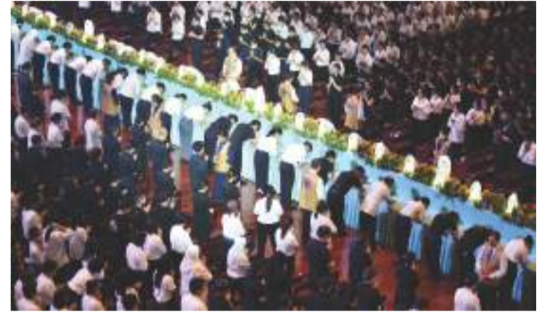
四十七位佛教諸山長老與法師帶領大眾浴佛。

2024年5月12日，慈濟印尼分會于靜思堂舉辦浴佛典禮，共有两千八百八十六人共同參與，人人虔誠一念心共沐佛恩、同沾法喜。