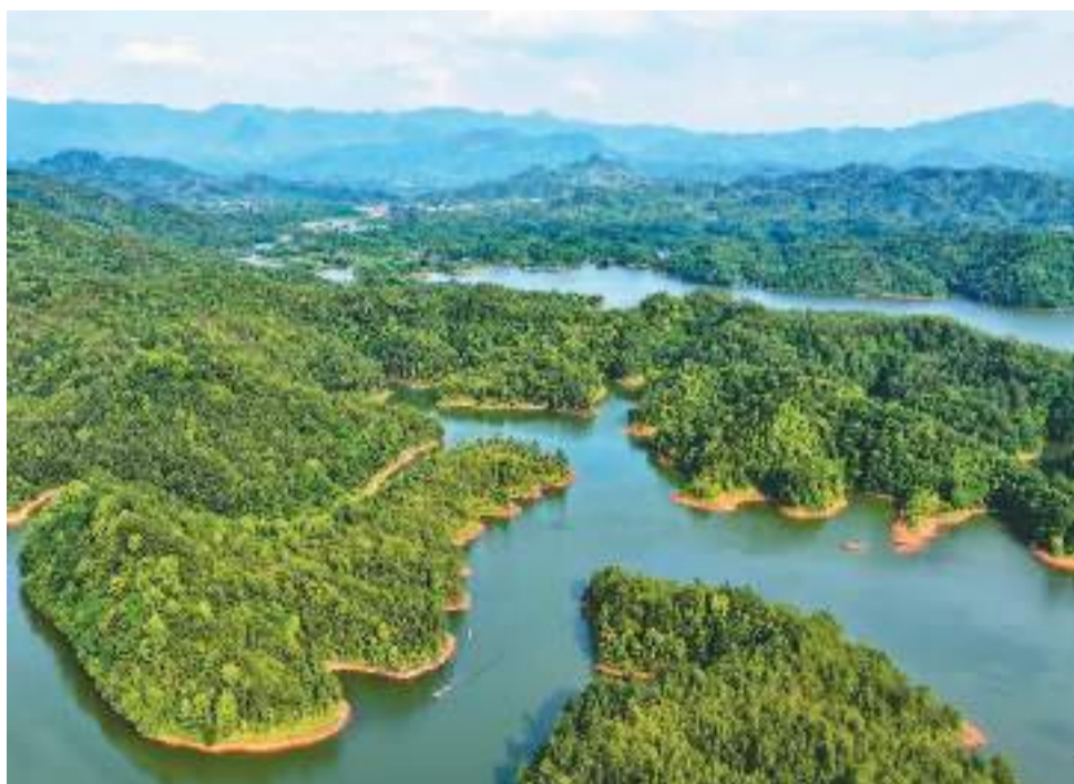
江西省瑞金市近年来坚持绿色发展理念，推行“河长制+党员生态巡护员”治水护水长效机制，深化河湖、水库生态安全。图为瑞金市日东乡日东水库，蓝天白云与清澈湖水交相辉映。

南方航空深圳—墨西哥城直飞航线每周两班。此前，旅客由国内飞往墨西哥或其他拉美国家，通常需要一到两次中转，部分中转地需过境签证，行程时间约三四十个小时。深圳—墨西哥城航线开通后，直飞墨西哥城只需16个小时，大大缩短了行程时间。