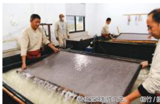
传统宣纸制作工艺。