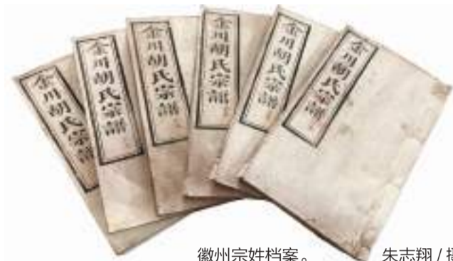
徽州宗姓档案。

5月8日,联合国教科文组织世界记忆亚太地区委员会第十次会议在蒙古国传来消息:“徽州文书——徽州千年宗姓档案”成功入选《世界记忆亚太地区名录》,这是安徽省首个人入选该名录的项目,为徽学研究和徽文化传承发展再添国际品牌。