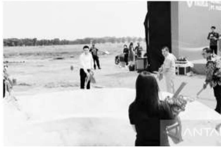
加拉璜电子摩托车厂奠基 5月13日,座落于加拉璜(Karawang)工业区的电子摩托车厂已经开始动工,这座工厂的土地面积约达27公顷。

990万吨(千升)的Pertalite汽油,政府制定的今年份额约共3170万吨,其中巴厘的份下份额约达22.1万吨,已经供应的达到7万2900吨。 为确保含津贴燃油的供应能够正确到位,政府自2022年7月份已经向普罗大众进行了宣传和教育活动,谁有权可享用含津贴Pertalite汽油。 除此之外,北塔米纳公司也通过正确到位纲领,推动了含津贴燃油供应数字化系统,也就是对使用Pertalite汽油的车辆进行登记,使加油站在执行加油任务时,就能真正的正确到位。 他补充说,“我们也非常感谢,执法机构和大众一直对Pertalite汽油的供应保驾护航,让弱势群体能真正享用上述含津贴能源。” (Sm)