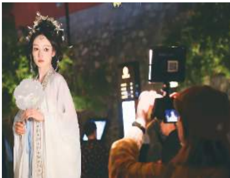
“五一”假期，沉浸式文旅产品受到游客青睐。图为身着汉服的游客在西安大唐不夜城拍摄写真。