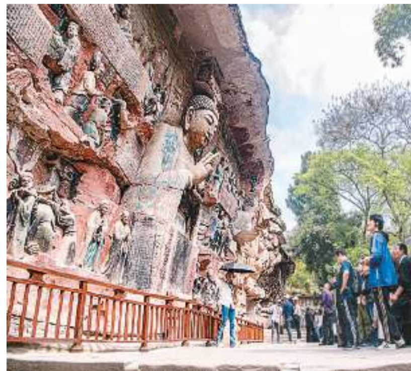
世界文化遗产大足石刻位于重庆市大足区内，始建于初唐，两宋达到鼎盛。1999年，大足石刻被列入《世界遗产名录》。图为游客在大足石刻景区参观。

此刻，打开数字博物馆，进入“全景大足”中的北山石刻景区，屏幕中的场景开始转动，我们又看到了84年前的那张照片，展示在当年拍摄点几乎相同的位置。既是今昔对比，也是致敬。