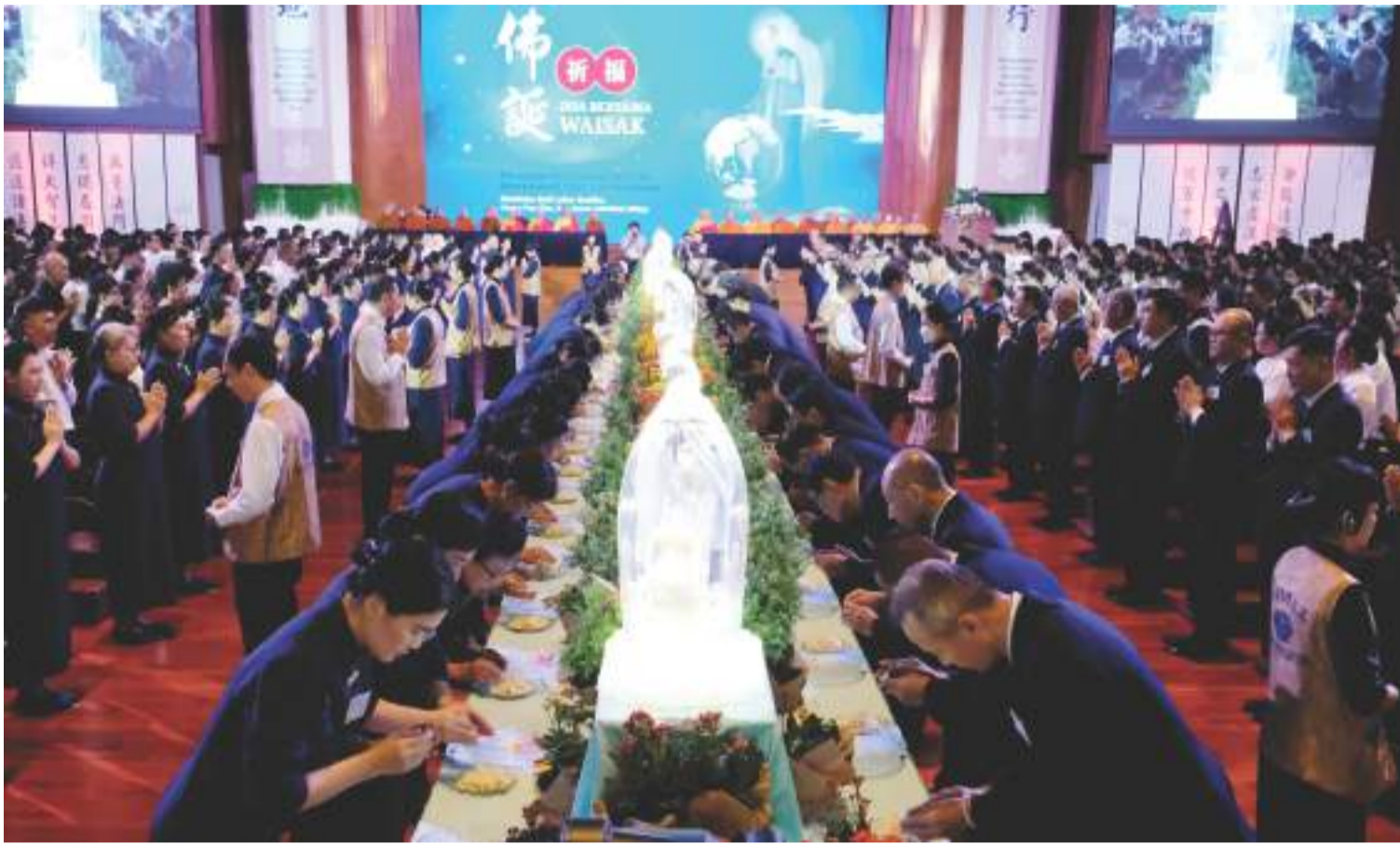
2024年5月12日，慈濟印尼分會于靜思堂舉辦浴佛典禮，共有两千八百八十六人共同參與。