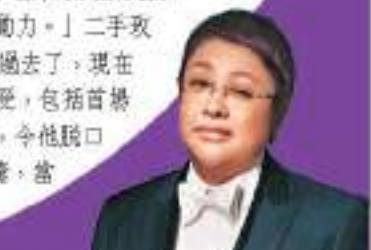
◆韓紅發微博主動請戰《歌手》。