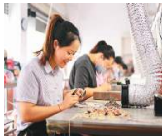
图为在湖南省怀化市通道侗族自治县礼雅小学附近的一家微工厂内，宝妈们趁着孩子上学时忙着加工元件。