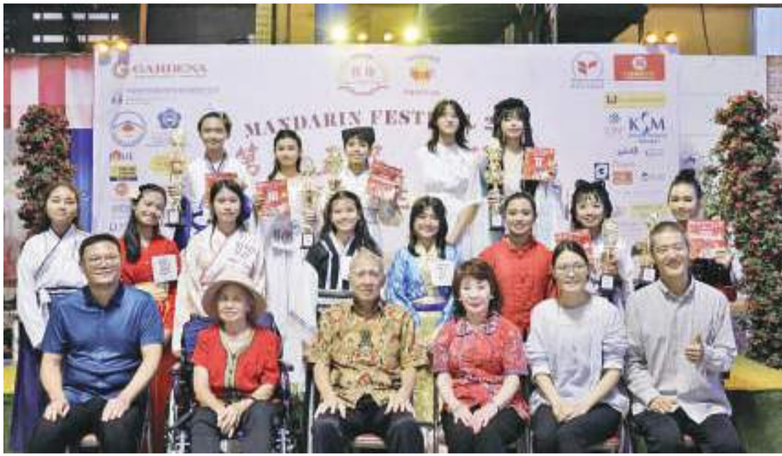
贵宾与评委与初中参赛者合照