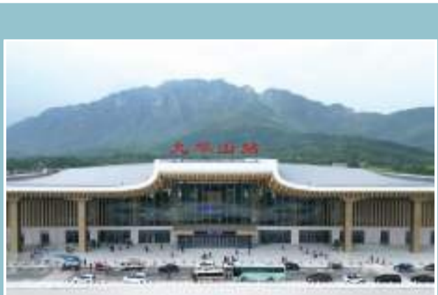
九华山站站房。

同时,为使大桥更好地融入周边景观,设计单位精心设计大桥造型,以守护绿水青山为设计底色,大桥整体造型犹如一行展翅的白鹭,跃于青山绿水之间,实现“山水桥”和谐共生。 范克龙