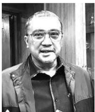
国会第十委员会副主席尤素夫 (Dede Yusuf)

【本报讯】5月12日，国会第十委员会副主席尤素夫 (Dede Yusuf) 驳斥总统府特别助理比利 (Billy Mambasar) 的声明。尤素夫表示，所谓国会议员的不少家属和亲近人士都获得大学智慧卡 (KIP) 的赞助，这不是真的。大学智慧卡仅适用于符合条件的民众。官员的孩子、富人的孩子或成功商人的孩子不应该获得赞助。国会确实有权推荐任何被认为值得接受大学智慧卡计划的