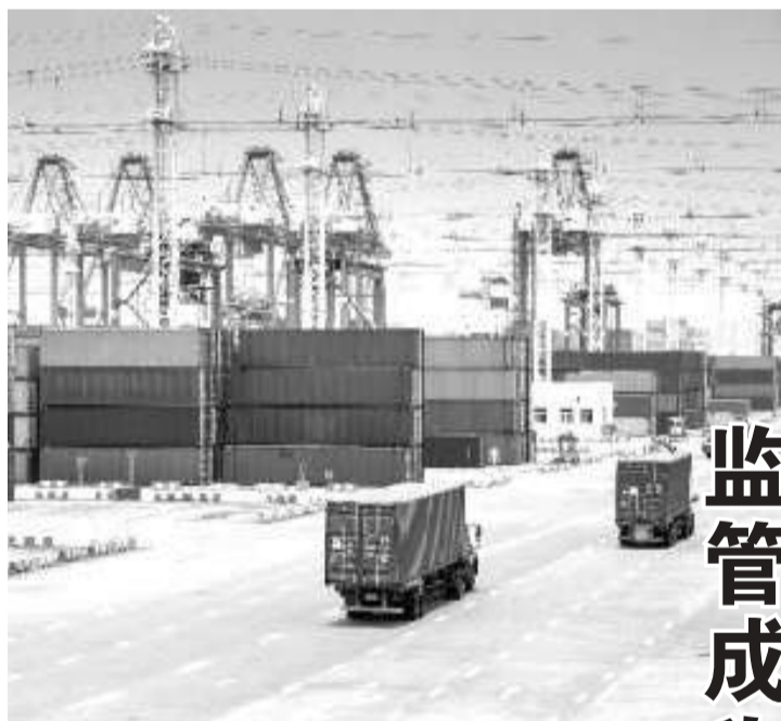
监管成为全球品牌进入国内市场的挑战

物进口通知机制负责的，因此不收取进口关税。对于运回国的遗体服务，由特殊货物进口通知机制提供，征税为零。海关总署并没有对棺木征税。运送棺木的费用与运送服务公司有关，因此与海关总署无关。尤斯蒂努斯解释道，遗体的进口处理费用是处理遗体运送的成本，即仓库租赁、救护车等，其中在进口方面没有征收进口关税与税收。(亮剑)