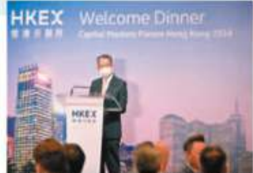
◆沙特證券交易所和香港交易所早前共同舉辦「資本市場論壇」，陳茂波在論壇的歡迎晚宴上發言。