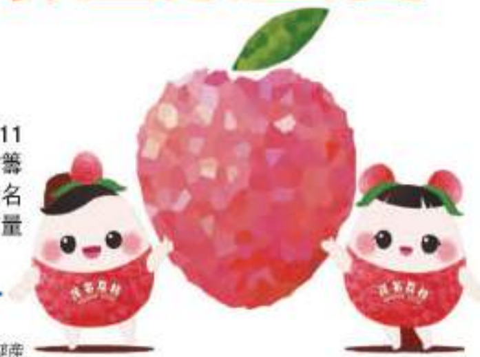
荔枝龍眼產業高質量發展。

本屆大會期間還將組織茂名市土特產展覽展示，展現茂名作為廣東、中國乃至世界第一大荔枝產區，在荔枝龍眼產業方面的豐富產品，以及其他特色產業產品，為即將到來的海內外遊客展現和準備茂名特色手