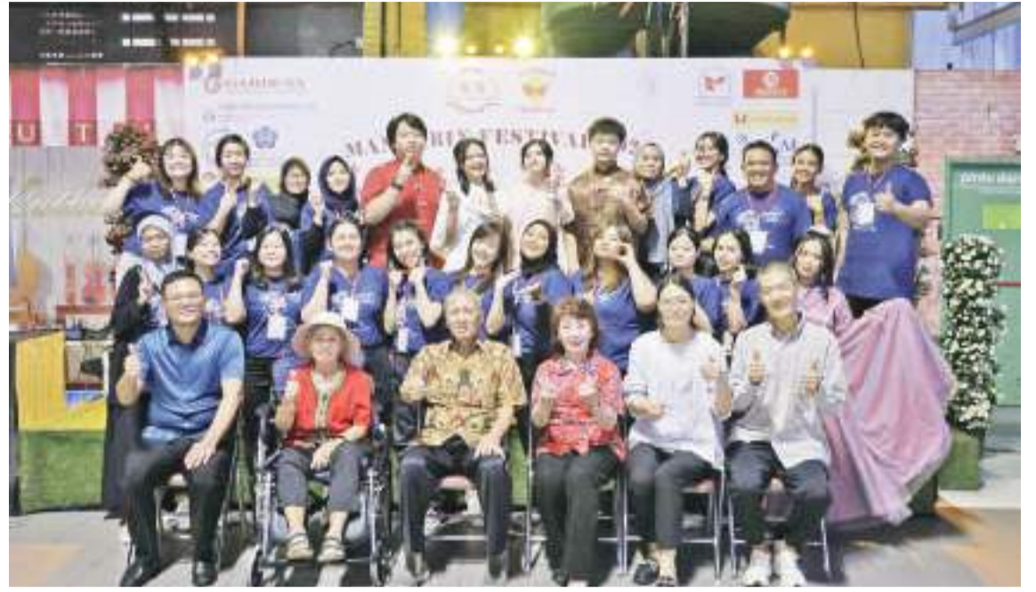
主持人与工作人员大合照