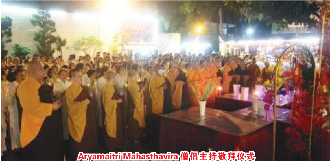
Aryamaitri Mahasthavira 僧侣主持敬拜仪式