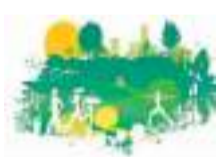
绿色旅游 美好生活

彩云湖的花，是率性自然的花。这片湿地为花儿提供了良好的生长环境，在鸟粪、树叶以及水中诸多养料的滋养下，花儿长得干净、饱满又鲜嫩、艳丽。尽管有着姣好的容颜，这里的花儿