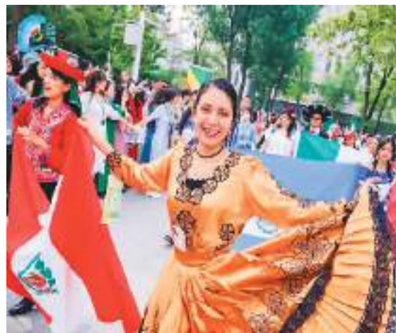
日前，北京语言大学第十九届世界文化节游园会举办，展现文化交流魅力。上图和左图均为活动现场。