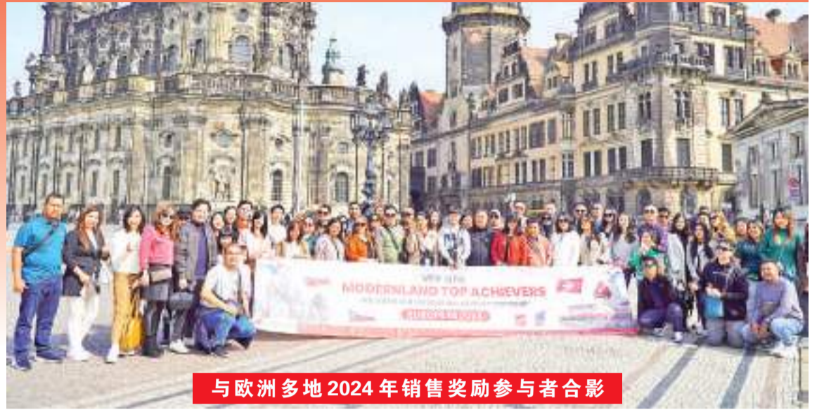
与欧洲多地 2024 年销售奖励参与者合影

【本报讯】PT Modernland Realty Tbk 或 Modernland 成功实现住宅市场营销销售额 14,589.4 亿盾，截至 2023 年第四季度同比增长 70%。这一积极成就的贡献主要来自城市开发产品的销售，包括雅加达花园城市、Kota Modern 和 Modernland Cilejit。