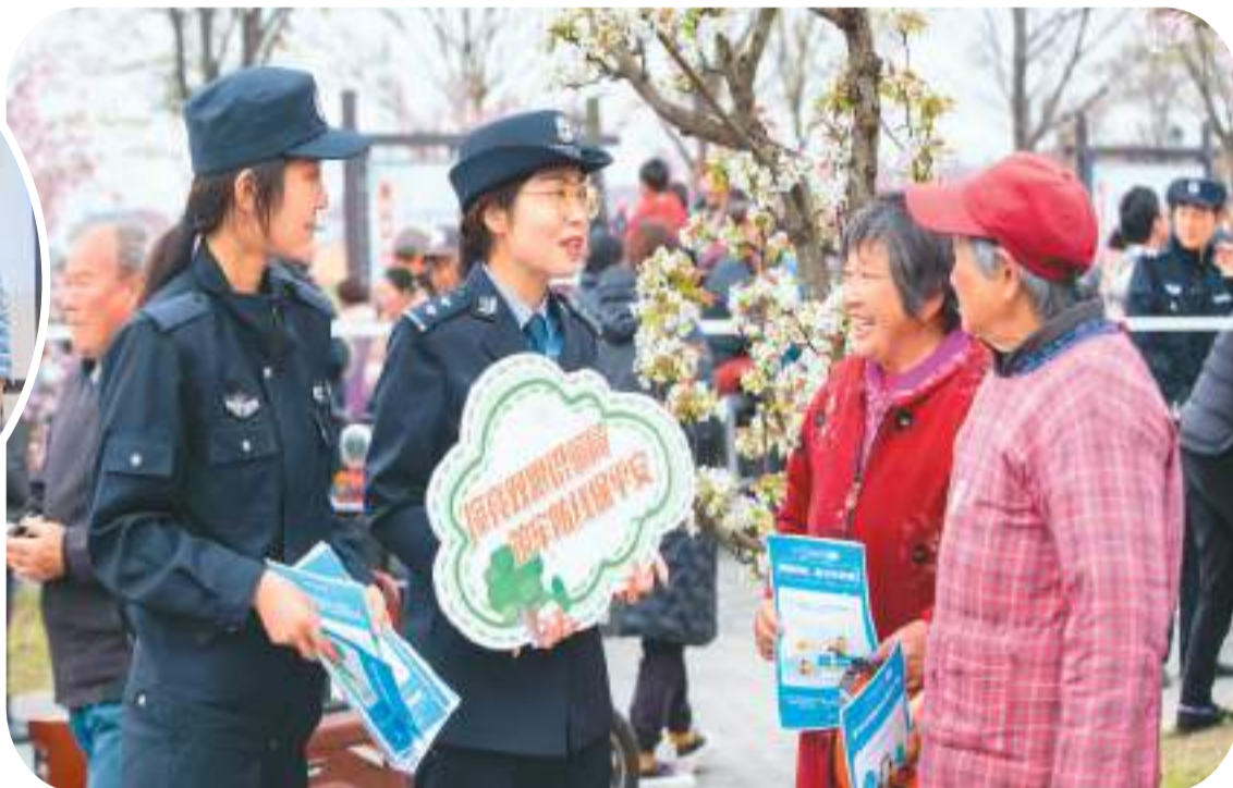
▶ 江苏省海安市公安局民警向老年人宣传反诈知识。