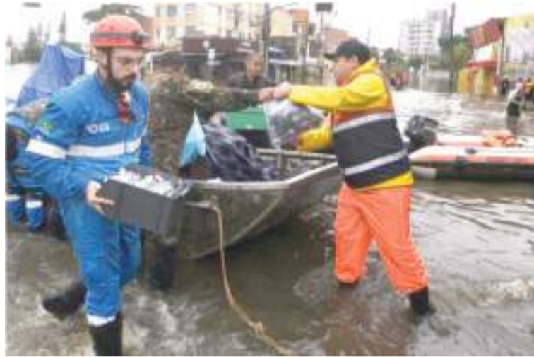
5月10日，救援人员在巴西南里奥格兰德州卡诺阿西市用船搬运被淹医院的设备和药品。