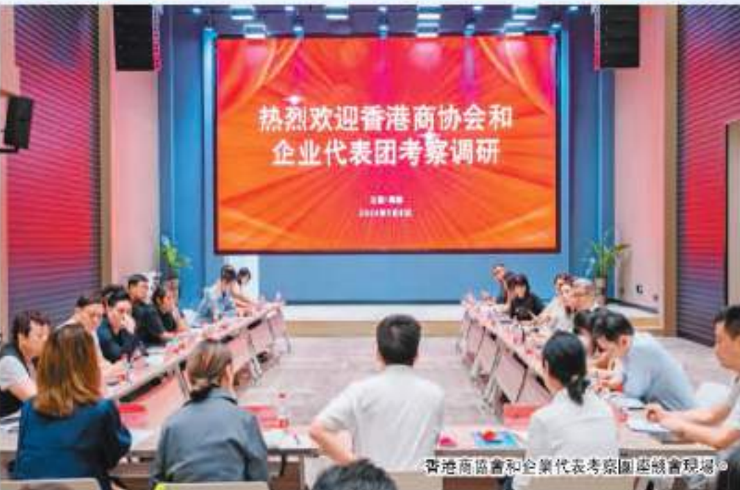
香港商協會和企業代表考察團團會現場。