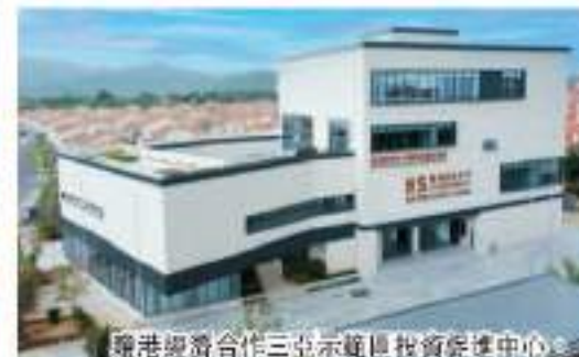
三亞海棠區風光圖。