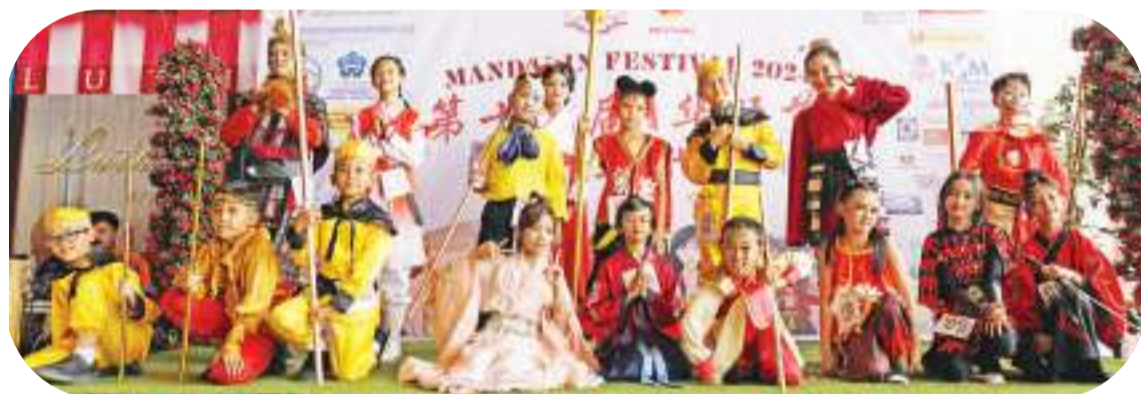
小学高年级组各显神通