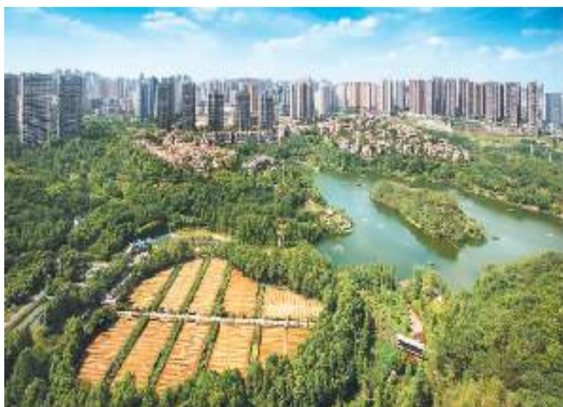
绿意盎然的彩云湖已成为人们了解山城重庆的又一窗口。