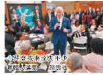
◆ 拜登或將面臨不少年輕選民，路透社

香港文匯報訊 美國年輕人普遍對美國總統拜登政府實施TikTok禁令感到不滿。據路透社4月底進行的民調，美國半數35歲以下的年輕人反對封殺TikTok。美聯社的調查則發現，在2020年總統大選時，拜登贏得61%的30歲以下選民和55%的30至44歲選民支持。《華爾街日報》指出，拜登若要成功連任，年輕選民的取態非常關鍵，政府一意孤行封殺TikTok，只會令年輕人感到被疏遠和被政客背叛，拜登在今年11月的大選將會失去不少年輕選民，為這項禁令付上政治代價。 團隊開設賬號被轟虛偽 美國多達三分之一的30歲以下選民透過TikTok獲取信息，TikTok的支持者表示，他們需要尋找發聲途徑，針對拜登的怒火勢必對選舉結果造成影響。許多TikTok帖文也抨擊拜登面對國家仍有許多問題未解決，卻花時間和年輕人喜愛的自我表達方式，既荒謬又侮辱。 28歲的民主黨政策顧問策略師亨利表示，封殺TikTok法案與援助以色列法案一併通過，但許多年輕人同時反對這兩項法案。亨利指出，許多年輕人感覺到「當我們有用時，你們便利用我們，但根本不關心我們的聲音或生計。」 拜登競選團隊今年入駐TikTok，但關注者不多，且留言充斥對拜登的憤怒。競選團隊使用他們認為對美國「有害」的應用程式的舉動，被民眾炮轟虛偽。 拜登或將面臨不少年輕選民，路透社