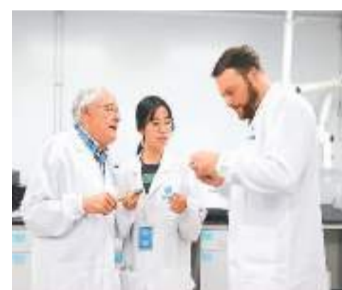
台州市黄岩区江口街道招商引才和人才引智融入侨务工作，引入顶尖人才。图为欧洲科学学院院长（左）携团队与中企研发人员讨论。

为吸引更多海外人才，台州市侨联实施了多项举措。一是持续深化“创业中华 智造台州”品牌内涵，通过举办高校海归创新创业科技成果洽谈会，吸引长三角地区高校生物医药、智能制造、新材料、元宇宙等领域专家学者、海归人才落户台州。二是搭建“侨联+高校侨联+引才工作站+海外智囊”引才网络。与7家长三角地区高校建立引才合作伙伴关系，积极收集优质科研成果项目，建立“高校科研成果库”，并力促其与“企业需求库”匹配对接。目前，项目库里共有高校科研项目331个。三是依托建立台州驻俄罗斯、巴西、澳大利亚、加拿大多伦多等16家贸易联络站，将台州优势产业、优质产品、重点企业和海外特色投资项目对接，借力当地侨商侨领优势，助推引进海外高层次人才和项目。