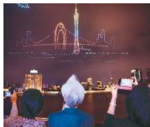
图为近日，人们在广东省广州市白鹤潭大湾区艺术中心观看无人机表演。