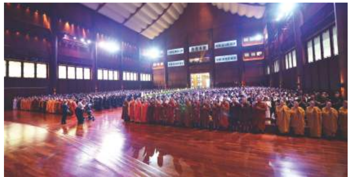
共有四十七位佛教諸山長老與法師、四十九位宗教人士與受邀嘉賓，以及两千八百八十六位民眾一起虔誠浴佛。