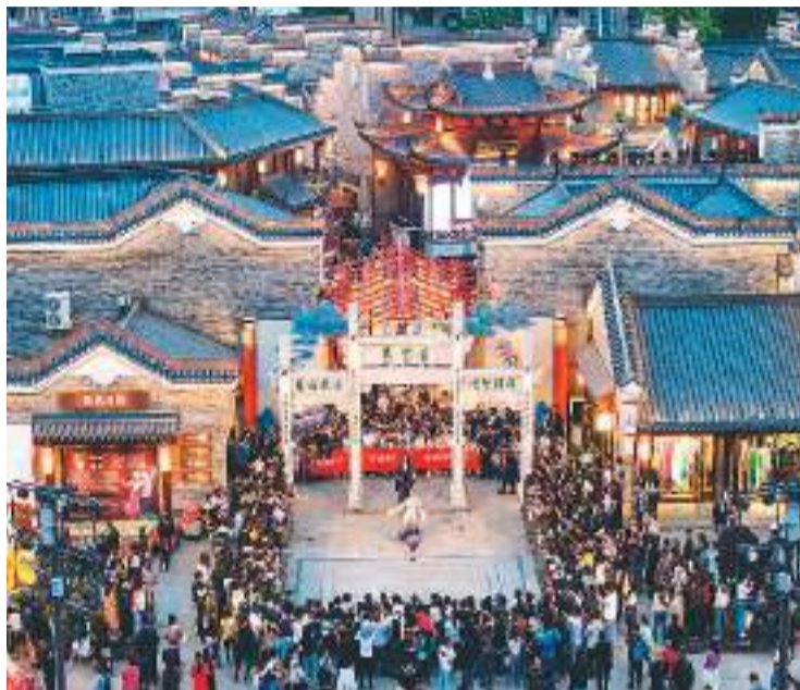
“五一”假期，湖北省襄阳市文旅市场火热，众多游客来此感受古城文化，乐享假期。

苏州广电旗下的苏州数智影视文化产业园以现有载体和广电优势，将打造街区型、开放式文化产业园作为发展方向，通过与广电媒体的深度合作，产业园不断拓展影视制作、音