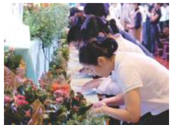
「禮佛足、接花香、祝福吉祥」隨著司儀的口號，人人緩緩走向浴佛台，彎下腰虔誠浴佛。