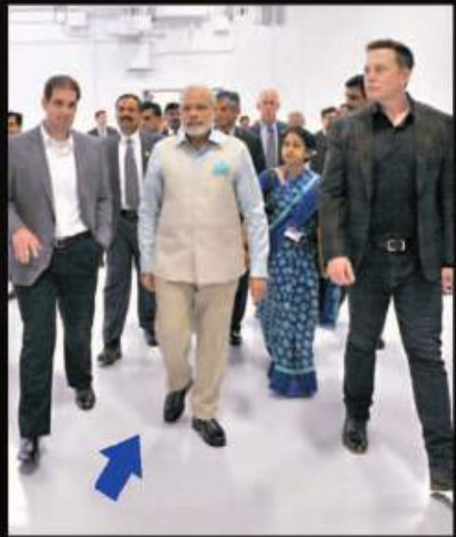
◆ 印度總理莫迪（左）曾到訪Tesla在加州的工廠，與馬斯克（右）會晤。 網上圖片