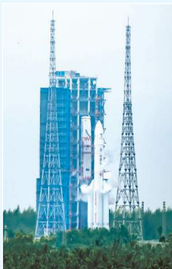
图为5月3日17时27分，嫦娥六号探测器由长征五号遥八运载火箭在中国文昌航天发射场发射。

近日，嫦娥六号探测器由长征五号遥八运载火箭在中国文昌航天发射场成功发射，开启世界首次月球背面采样返回之旅。多家外媒报道称，这是“一项非凡的任务”，是“人类探索太空的重要一步”。