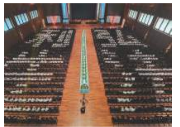
今年的浴佛典禮，共有一千三百九十二人組成「弘法利生」圖騰。