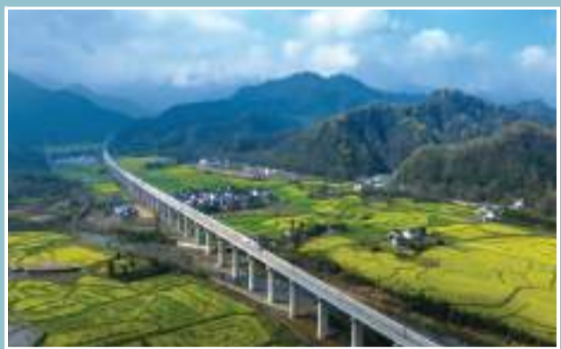
池黄高铁沿线山水如画。