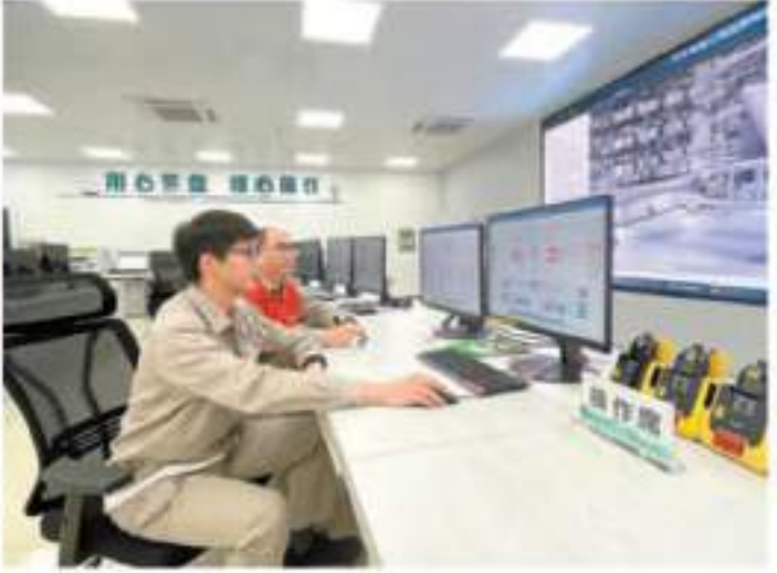
閩粵聯網公司雲霄換流站運維人員加強首次滿功率運行時的運維監盤。

是國家「十四五」規劃現代能源體系建設的重要工程,對於推進國網、南網兩大電網體系互聯互通,實現能源資源安全新戰略,實現能源資源大範圍優化配置具有重要意義。廣東電網有關負責人表示,廣東、福建兩省通過閩粵聯網工程,實現電力互補互濟,調劑餘缺,應急情況下可以互為備用、相互支援,進一步提升極端條件下的保供電能力和事故應急處置能力。該工程投運以來累計輸送電量超53.4億千瓦時,其中福建送廣東33.3億千瓦時,廣東送福建20.1億千瓦時,進一步提高了廣東、福建電網資源優化配置能力和經濟運行水平。