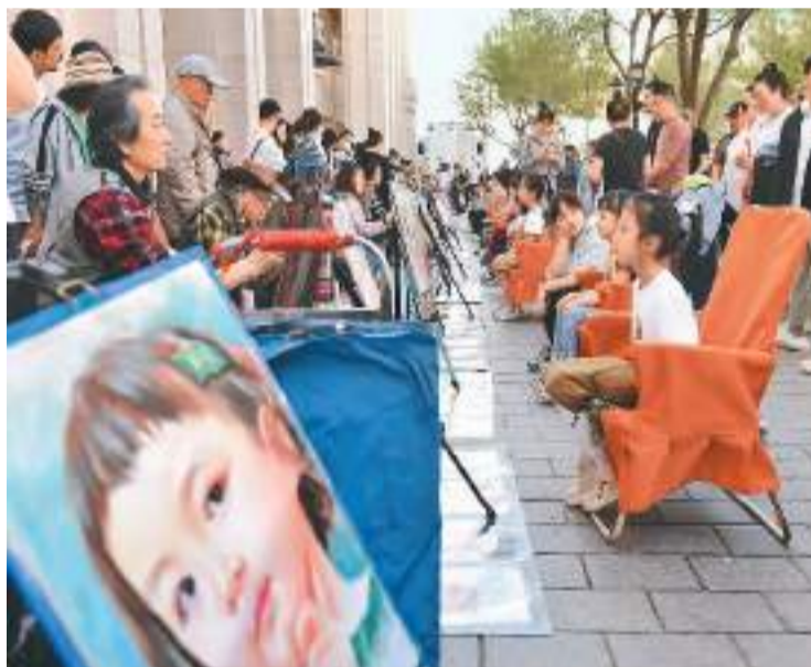
5月1日，游客在哈尔滨中央大街上画肖像画。