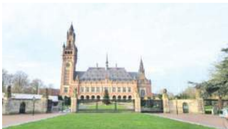
这是2023年12月30日拍摄的联合国国际法院所在地——荷兰海牙和平宫。

今年1月26日，国际法院发布具有约束力的“临时措施”，要求以色列遵守《防止及惩治灭绝种族罪公约》，防止在加沙地带发生针对巴勒斯坦人的种族灭绝行为。3月6日，南非政府敦促国际法院采取新措施，以尽快结束加沙地带出现的大范围饥饿现象。本月10日，南非请求国际法院把要求以军撤离拉法列入追加临时措施。