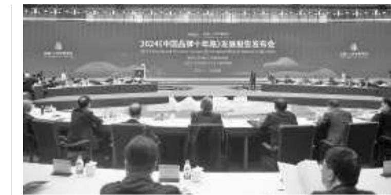
《中国品牌十年路》发展报告在浙江德清发布。这是5月12日拍摄的2024《中国品牌十年路》发展报告发布会现场。

与会者表示,中国品牌建设的格局和面貌在这十年中发生了较大转变,品牌建设的体制机制进一步完善,品牌建设的国际化进程取得积极进展,一大批具有全球竞争力和影响力的中国品牌正在走向国际,走向世界。