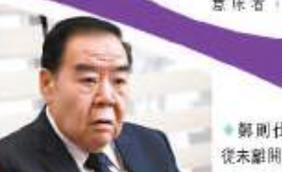
◆鄭則仕稱從未離開TVB。