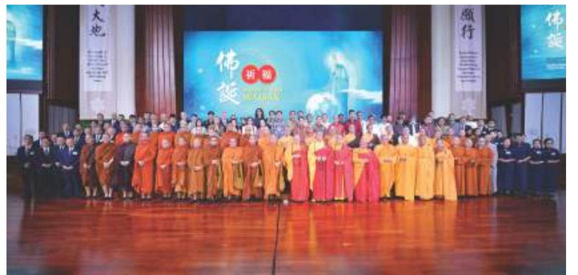
浴佛典禮結束之後，佛教諸山長老與法師、宗教人士、受邀嘉賓、慈濟志工一起合照。