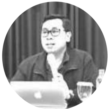
财政部长特别专员尤斯蒂努斯 (Yustinus Prastowo)

【本报讯】财政部长特别专员尤斯蒂努斯 (Yustinus Prastowo) 表示，有关进口棺木必须缴纳30%的进