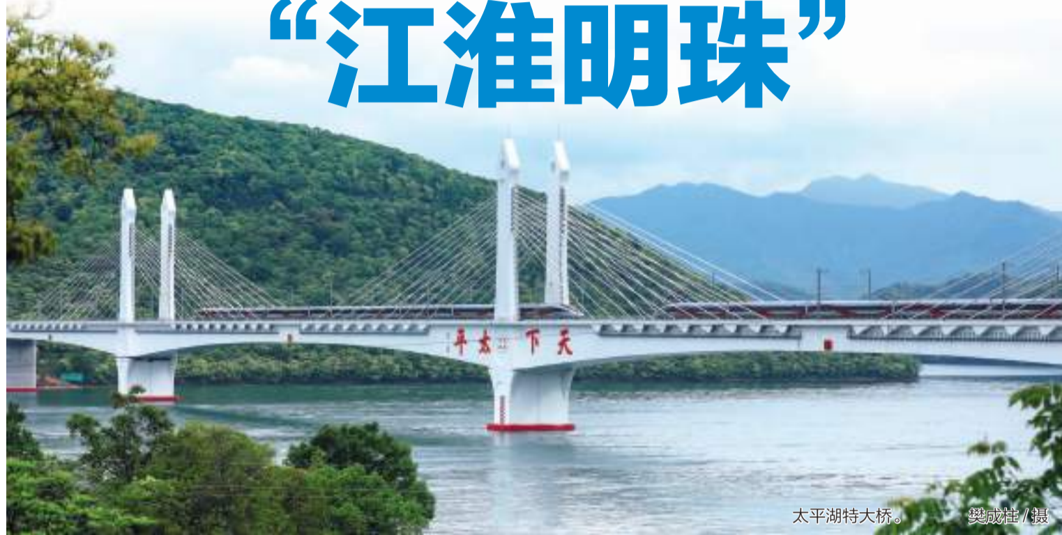
太平湖特大桥。