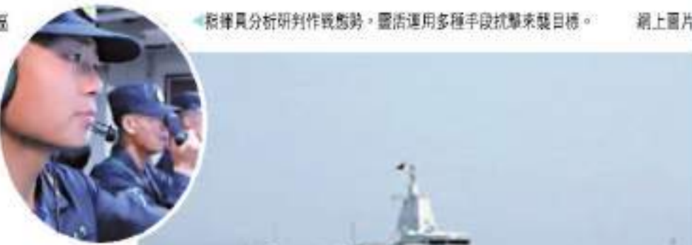
戰法訓法分析研判作戰態勢，靈活運用多種手段抗擊來襲目標。

香港文匯報訊（記者 葛洪 北京報導）近日，南部戰區海軍某驅逐艦支隊「萬噸大驅」遠海編隊與海口艦、昆明艦、威事艦等多型主戰艦艇組成訓練編隊，赴南海某海域實戰化訓練。南部戰區發信公報號稱，此次訓練重點圍繞對海作戰、防空反導、反潛作戰等課目展開，有效檢驗了多項戰法訓法運用成效，進一步锤炼各作戰平台以及編隊實戰化訓練水平，為靈活開展軍事鬥爭、提高及時妥善應對複雜情況的能力打下堅實基礎。