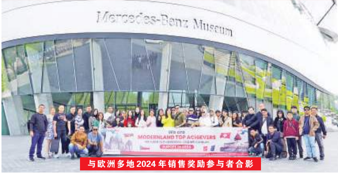
与欧洲多地 2024 年销售奖励参与者合影