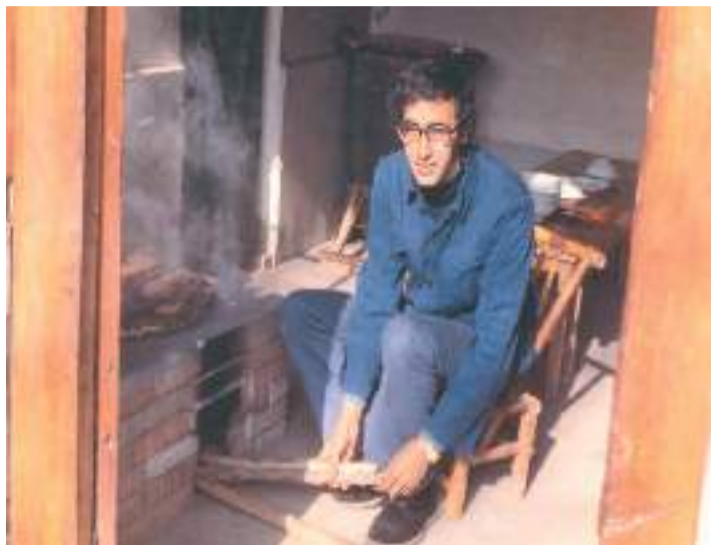
上世纪70年代白乐桑在北京留学期间，到农村时留影。

从上世纪60年代末学习汉语，法国著名汉学家白乐桑和汉语结缘已逾50年。白乐桑表示，中法建交以及两国文化交流是他汉语人生的关键，也是法国汉学与汉语教学研究发展的基础。在60年的发展历程中，法国汉学形成了自己独特的研究内容与焦点话题，并不断延伸、突破；汉语第二语言教学学科在法国得以建立，并在法国汉语大纲编制、中欧汉语水平对标认定、汉字门槛等级设置、“字本位”教学理念等方面，不断结出硕果。