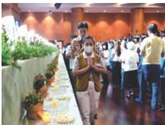
除了在靜思堂的講經堂，印尼慈濟也在國際會議廳、福慧廳、喜舍廳，準備浴佛台提供大眾浴佛。