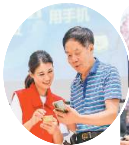
▲ 志愿者在福建省福州市鼓楼区安泰街道山社区教老人使用智能手机。

信网络谣言、被诱导打赏等问题不时出现。越来越多的公众意识到，数字技术适老化，不仅要让老年人“方便上网”，更要为老年人营造清朗安全的上网环境。