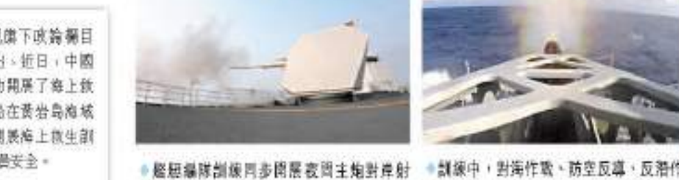
近日，南部戰區海軍某驅逐艦支隊「萬噸大驅」遠海編隊與海口艦、昆明艦、威事艦等多型主戰艦艇組成訓練編隊，赴南海某海域實戰化訓練。

張軍社指出，菲律賓拉攏美國、與美國搞所謂的聯合演習，目的是要依靠美國等域外力量為其保護執權行軍提供打氣、壯膽，明顯是在拉大旗幟虎皮，「無論如何，解放軍都絕不會屈服於外來威脅和脅迫。中國軍隊將堅定維護國家主權和海洋權益。」