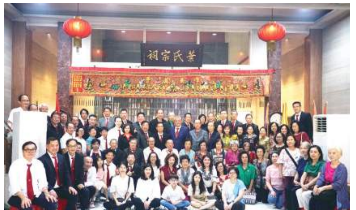
全体叶氏宗亲合影