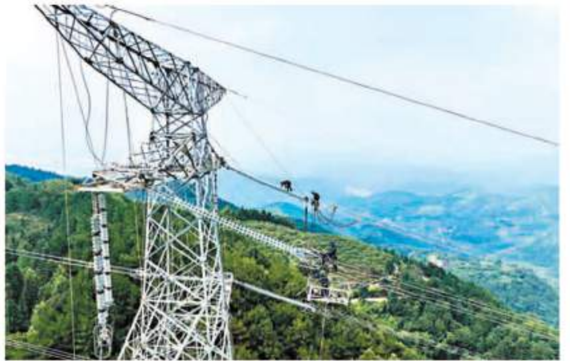
閩粵聯網工程創新多項技術,實現重要技術國產化率100%。圖為工人檢查維修輸電網。

香港文匯報訊(記者 方俊明 廣州報道)閩粵聯網工程首次「滿負荷」送電!香港文匯報記者12日從南方電網廣東電網公司獲悉,「閩粵聯網工程」11日首次以200萬千瓦滿通道能力送電廣東,將持續10天,累計送電量將達到2.8億千瓦時,可供4.6萬人使用一年,緩解廣東供應壓力。廣東電網公司表示,閩粵聯網工程對於推進國網、南網兩大電網體系互聯互通,實現能源資源大範圍優化配置具有重要意義。下一步,廣東電網將深化閩粵電力互送交易,更好服務粵港澳大灣區高質量發展。