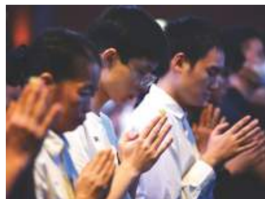
浴佛典禮尾聲，人人虔誠祈禱。