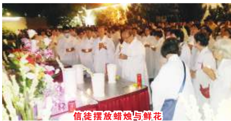
信徒摆放蜡烛与鲜花

【本报讯】广化一乘禅寺庆祝佛历2568/公历2024年卫塞节活动，已于5月12日(星期日)下午5时，在雅加达广化一乘禅寺大寺堂广场盛大举行。 供斋僧大会是佛教信徒对尊师最高尚的崇敬仪式，即佛教信徒们顺时针慢步围绕着制定尊像缓行三圈；800名信徒参加了当晚的活动。 供斋僧大会可谓是佛教均次于卫塞节的重大节日，甚至在一些佛教国家