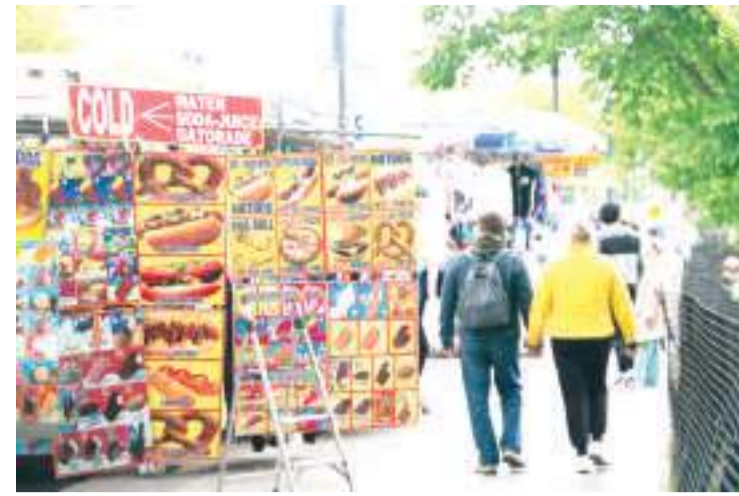
4月25日，在美国首都华盛顿，游客从白宫附近一辆食品售卖车旁经过。

厄尔尼诺现象会导致巴西西北部干旱、南部强降雨，今年情况尤甚。研究人员认为，气候变化正导致极端天气愈加频繁。