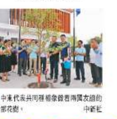
中柬代表共同種植象徵著兩國友誼的榕樹花樹。