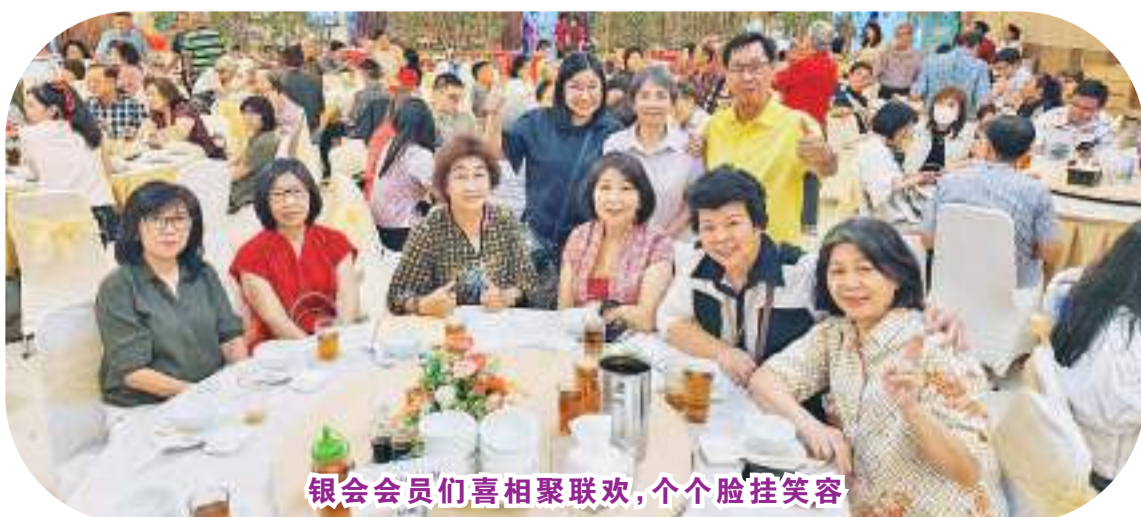
银会会员们喜相聚联欢，个个脸挂笑容