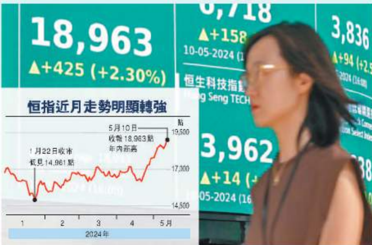
◆恒指5月10日逼近19,000點收市，報18,963點，單日升425點或2.3%，成交金額為1,710.01億港元，市場預期後市會維持「大漲小回」格局。