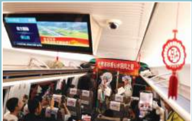
池黄高铁首班列车从九华山站发车。关敬生 范克龙/摄