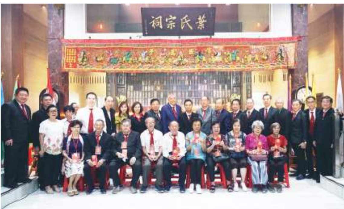
80岁以上宗长们接收敬老尊贤红包后与各位理事合影