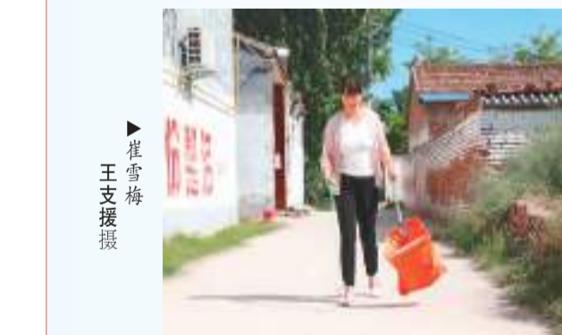
▶ 崔雪梅 王支拍摄