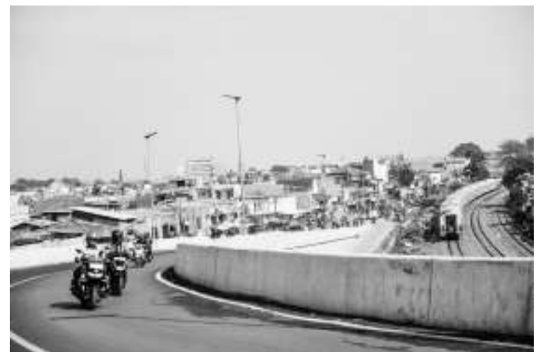
万隆 Ciroyom 高架桥竣工 5月13日,西爪哇省万隆的Ciroyom高架桥建设项目已经竣工,希望有了这座高架桥,就可缓解交通堵塞现象。