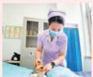
在中國中醫科學院西醫醫院山西醫院中醫護理門診，護理為患者做艾灸護理。