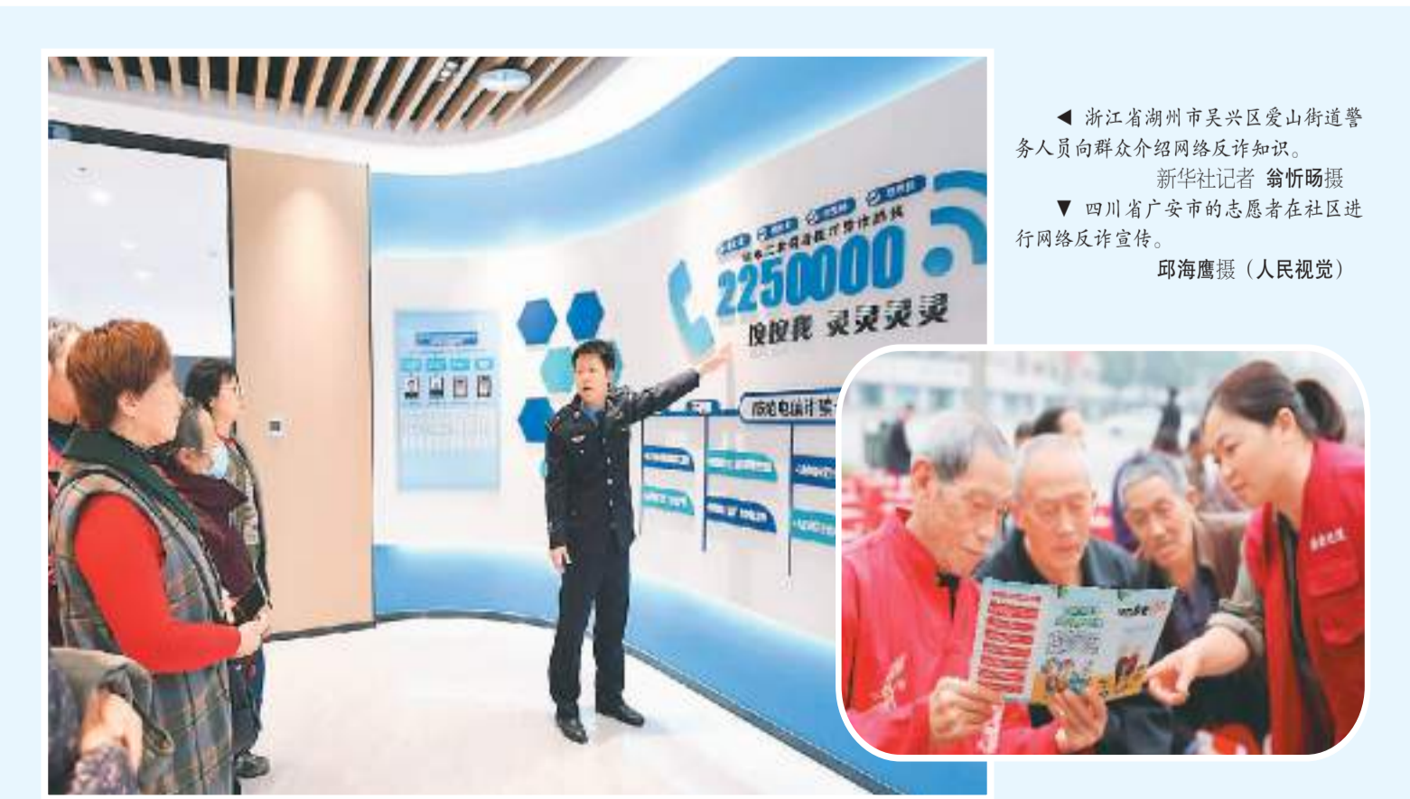
▲ 浙江省湖州市吴兴区爱山街道警务人员向群众介绍网络反诈知识。

据介绍，企航自贸港一站式服务平台汇集各类政务服务、招商服务和专业服务，一端与企业主体相连，另一端与专业服务机构相连，为重点企业提供包括政策、财税、金融、人力资源、知识产权等在内的服务。