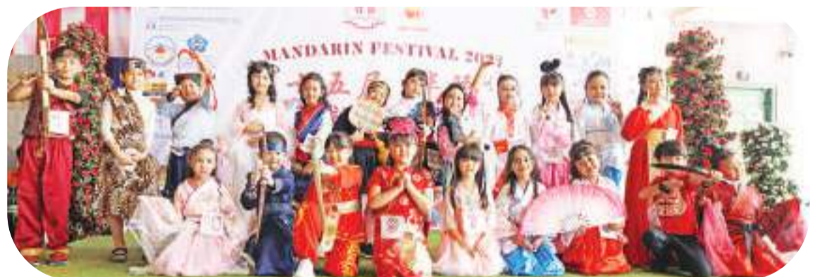
小学低年级组可爱造型