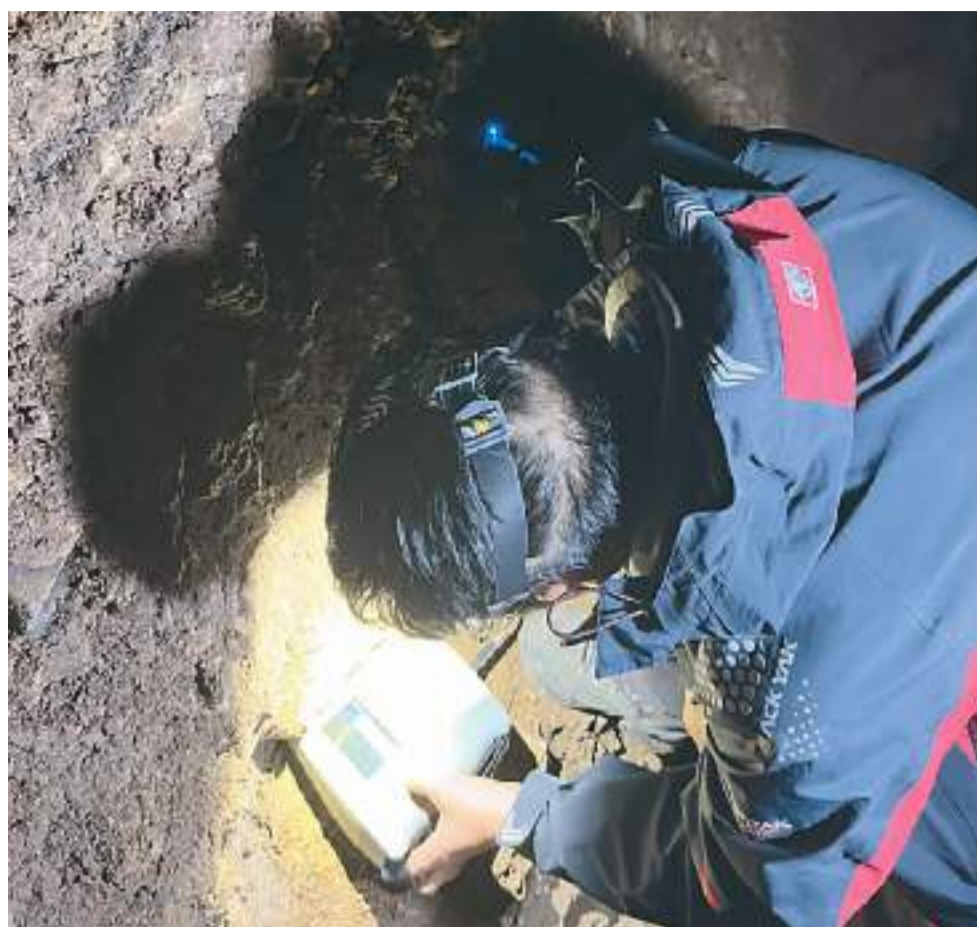
研究团队成员在采集研究样品。

研究团队相关负责人表示，该项综合研究将柳江人化石真正归入全球早期现代人演化序列，为探讨整个欧亚大陆现代人的迁徙扩散模式提供了关键的化石和年代数据。