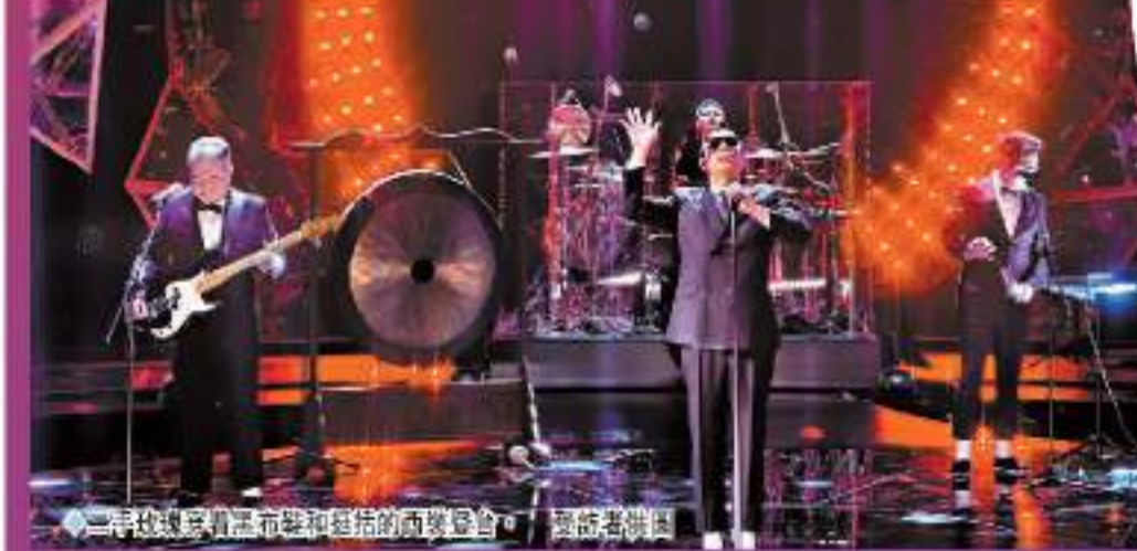
◆二手玫瑰穿黑布鞋和能搭的服裝登台。