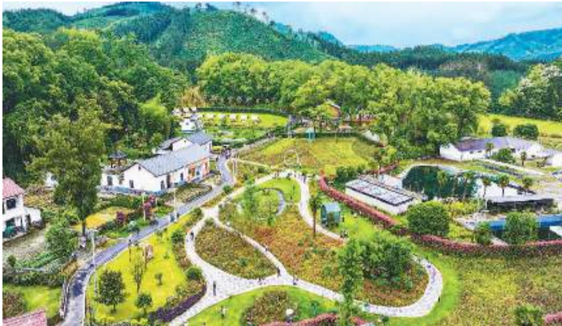
游客在江西省宜春市樟树镇村五斗米农场休闲游玩。

来到北京市昌平区兴寿镇下苑村，游客可去旧书市集淘一本好书，也可走进“村咖”品一杯咖啡，或是实地走访艺术家工作室，体验高品质的乡村文化生活，如今已成为下苑村乡村旅游的一大“卖点”。