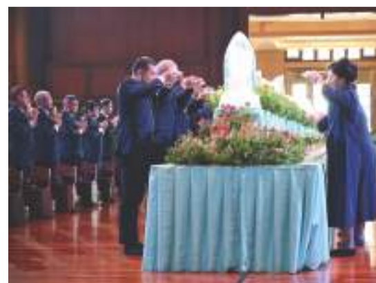
慈濟委員上前供燈燭、香湯、花香。