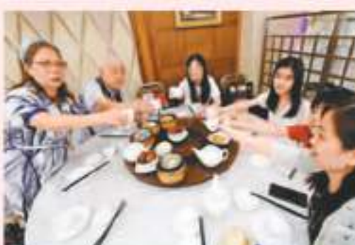
◆香港有不少市民11日提早於酒樓慶祝母親節，香港文匯報記者涂穴攝

香港文匯報訊（記者 吳健賢）香港有不少市民11日已經提早於酒樓慶祝母親節。香港文匯報記者11日中午到旺角一間酒樓，只見全場幾乎坐滿客人，有市民則提前到旺角花墟買花和訂花。但酒樓和花店表示，受北上和外銷消費影響，今年母親節的生意不太樂觀。今年市道反應「慢熱」。曾有兩名女兒的女士兒孫滿堂，她表示以往母親節時也十分熱鬧，因為母親節正日外出人多，故特此提早到酒樓慶祝母親節，「最重要一齊吃飯，有子女同輩舉，（心情）就好，願望是有飯吃，子女平安。」倫敦大酒樓副總經理蘇黃敏表示，由於部分家