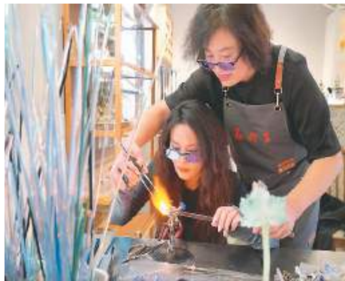
山东省淄博市博山区被誉为“中国琉璃之乡”，琉璃生产历史悠久。近年来，当地琉璃创作技法与产品样式不断创新，吸引了越来越多的关注，受到市场欢迎。图为5月9日，在博山区颜神古镇的“石榴王”手造琉璃坊，游客（前）体验琉璃灯制作工艺。