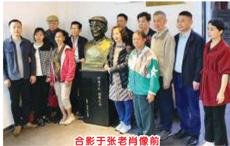
合影于张老肖像前