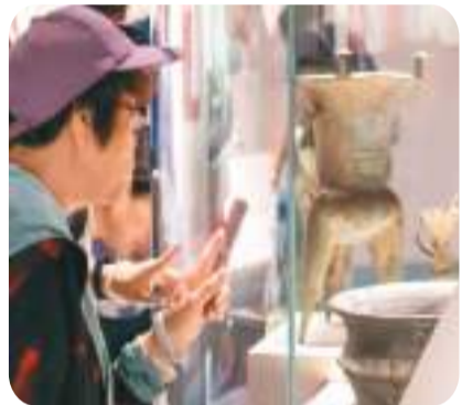
▲ 观众在参观展出的文物。

为安全运输这批数目多、器型大、年代久的文物，策展团队特别定做了一批包装箱，并同物流公司反复核对各个环节。口径66厘米的春秋王子午鼎，其鼎盖由专家们一致评估为状况不宜空运，只得被“忍痛割爱”留下来。