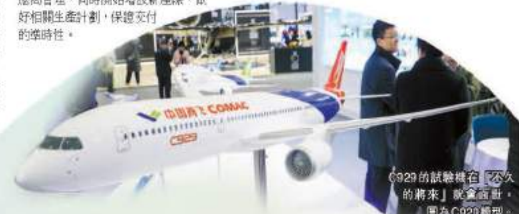
C929的試驗機在「不久的將來」就會面世，圖為C929模型。