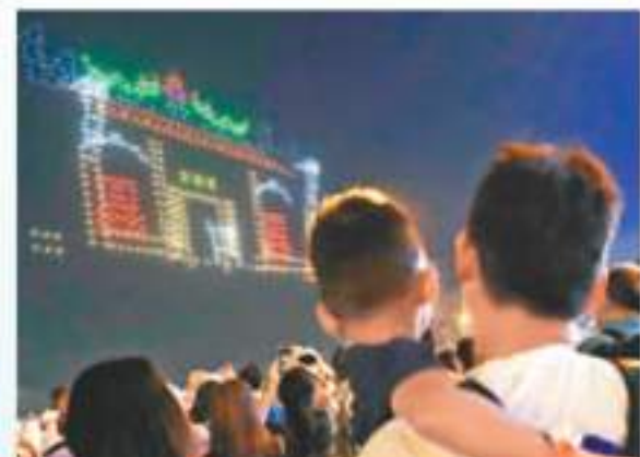
◆ 無人機變幻成空中廟宇。