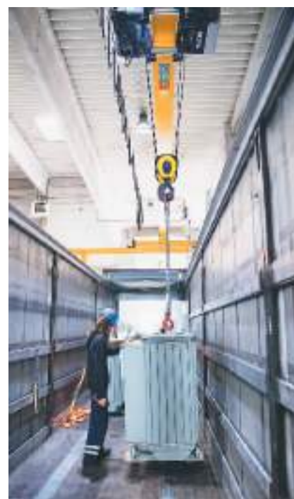
工人在位于匈牙利布达佩斯的中欧商贸物流合作园区仓储区域将货物装车。

“人与自然的关系十分密切。随着现代社会的发展,人们更多关注自身的发展,却忘记了自己与所有生灵一样,都是自然不可分割的一部分。”帕夫莱塔·戴维多娃说,“这也是为什么我们需要更多这样的电影。再不行动起来,这些动物未来可能只能存在于电影中。我们要更加关注全人类共同的家园。”