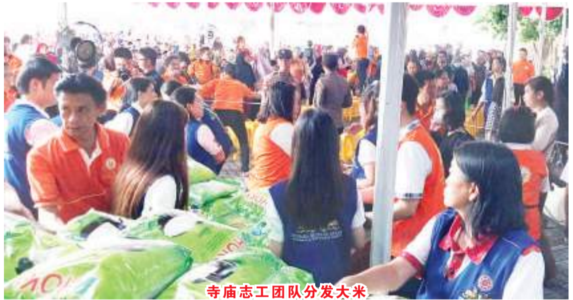
寺庙志工团队分发大米