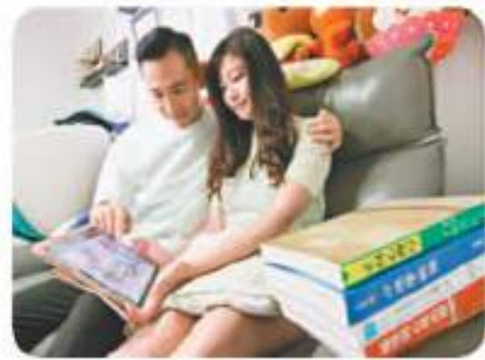
◆為把握女童的「黃金學習期」，鄭太太還補兒童心理學，查閱相關書籍及研究。

鄭氏夫婦於2018年結婚，翌年已決定參與寄養計劃，自此打消生育計劃。以往是標準「工作狂」的鄭大坦言嚮往自由，卻喜歡小朋友，「但喜歡不代表要擁有，既然有那麼多小朋友需要人照顧，我們又擁有資源，何不為徬徨無助的小朋友伸出援手？」誰與受從來不是絕對，在夫婦倆無私付出的過程中，小生命的來臨也為他們帶來意外的喜悅。早年，在她家寄養的另一名兩歲女童與他們格外有緣。「她與我們家中所有長輩都十分投緣。」她加入這個大家庭時，鄭氏夫婦正經歷家庭成員重病及離世，女童卻陪伴他們度過艱難的時刻，「她是我們的開心果，很感恩她的來臨。」鄭氏夫婦還打破慣例，與女童親生家庭成員有聯絡，還協助女童生母求職。面對普天同慶的母親節，鄭氏夫婦認為幸福可以好簡單。鄭太太說：「最重要的是幫助現時寄養的小朋友追上學業。母親節當日會簡單簡單一家人開心吃餐便飯，因為陪伴大家已是最好的母親節禮物，開心的話每一日都是母親節。」