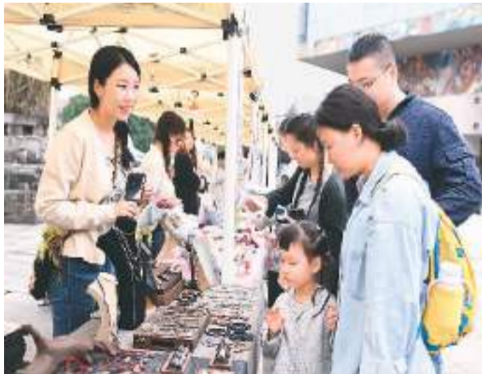
位于重庆市高新区虎溪街道的四川美术学院手工艺艺术系原手工艺创意集市，每逢周末和节假日开幕。集市提供摊位和基础配套，青年学子只需带上自己的创意产品即可“拎包创业”，展出并售卖首饰、陶艺等手工艺品。因为市民在该集市选购商品。

陕西省杂交油菜研究中心育种团队从含油量在40%左右的油菜出发，采用目标性状定向选育、生态穿梭选育、小孢子培养与品质性状选择相结合的技术方法，进行了大量的组合筛选，不断聚合高油基因，历经多年科研努力，最终获得含油量达66%的特高油油菜种质资源。