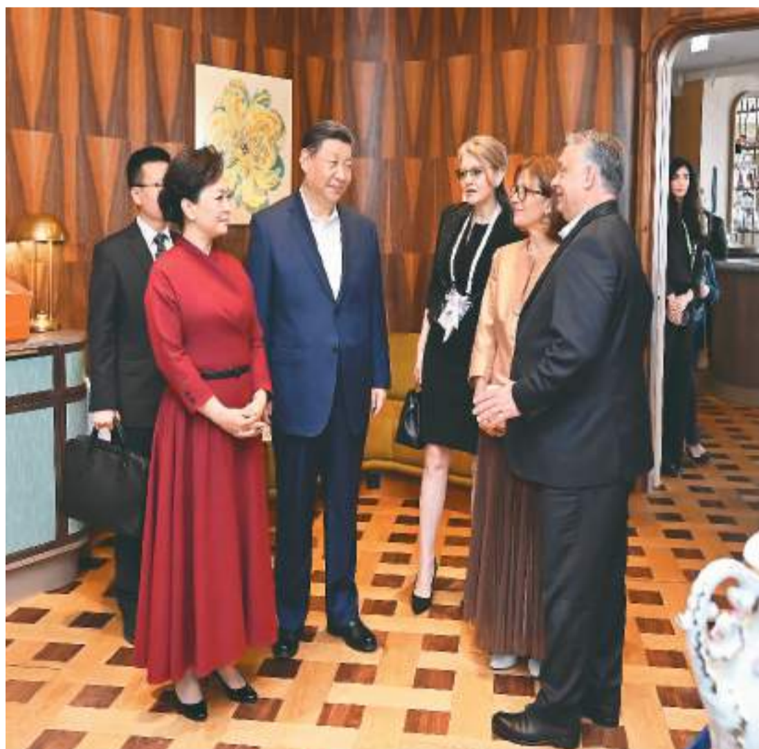
当地时间5月10日中午, 国家主席习近平和夫人彭丽媛在布达佩斯应邀出席匈方总理欧尔班和夫人举行的饯行活动。