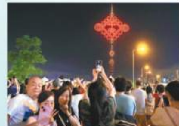
◆ 無人機砌出平安結。