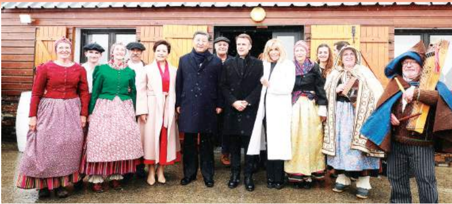
当地时间5月7日，应法国总统马克龙特别邀请，中国国家主席习近平乘专机离巴黎赴法国西南部上比利牛斯省访问。两国元首夫妇在图尔马莱山口“牧羊人驿站”共同欣赏当地村民表演的具有浓郁南法风情的牧羊人之舞，并同他们亲切合影。

在此访中，习近平同法国总统马克龙举行会谈时说，中法关系60年珍贵历程，将使我们更好思考如何