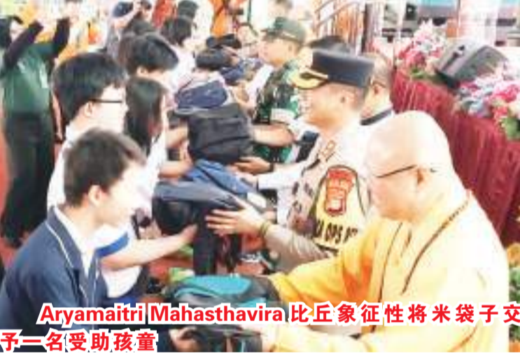
Aryamaitri Mahasthavira比丘象征性将米袋子交予一名受助孩童

【本报讯】广化一乘禅寺庆祝2024年卫塞节慈善筹委会于5月11日(星期六)早上9点,在广化一乘禅寺广场举办分发两千袋爱心食米予邻近弱势群体家庭活动,并得到当地市政府及军警官员的关注,以及热情出席见证。