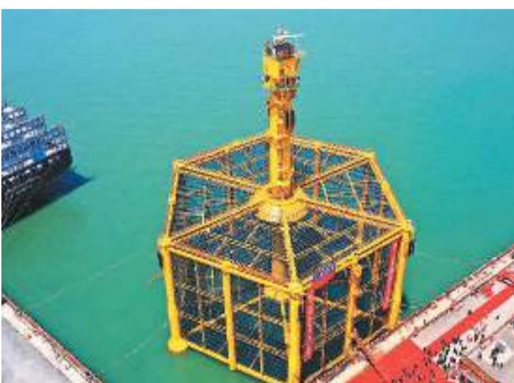
5月9日,山东青岛造船厂建造的“深蓝2号”大型智能深海养殖网箱实现陆地完工。该网箱全潜状态设计养殖水体达9万立方米,是目前中国应用海域最远、适用水深最深、养殖水体最大、功能性能最先进的深远海养殖网箱装备,搭建一体化数字化管理模式,可逐步实现深远海无人养殖。

据介绍,巴基斯坦空间技术研究所和上海交通大学于2023年初启动巴基斯坦方卫星联合研制,2024年按计划完成与嫦娥六号探测器的总装、测试和发射场准备,5月3日随嫦娥六号探测器发射升空。巴基斯坦方卫星项目成功验证了纳卫星月球轨道探测技术,探索了中巴月球与深空探测任务合作模式。