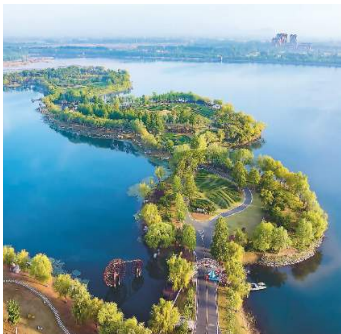
江苏省连云港市东海县西双湖国家湿地公园岸绿水清、草木葱茏,美景如画。近年来,东海县不断加大水资源和湿地保护力度,打造“城市绿肺”,持续改善人居环境,让市民乐享生态建设成果。

林剑表示,中方严肃敦促日方恪守中日四个政治文件的有关原则和精神,以实际行动体现坚持一个中国原则的承诺,不得以任何形式纵容支持“台独”分裂势力,切实维护台海和平稳定而不是相反。“我们正告民进党当局,勾连外部势力进行谋‘独’挑衅绝不可能得逞,出卖国家民族利益必将遭到历史清算。”他说。