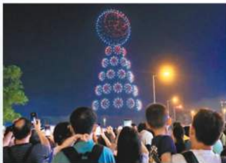
◆ 小平安包集組成一個立體包山。