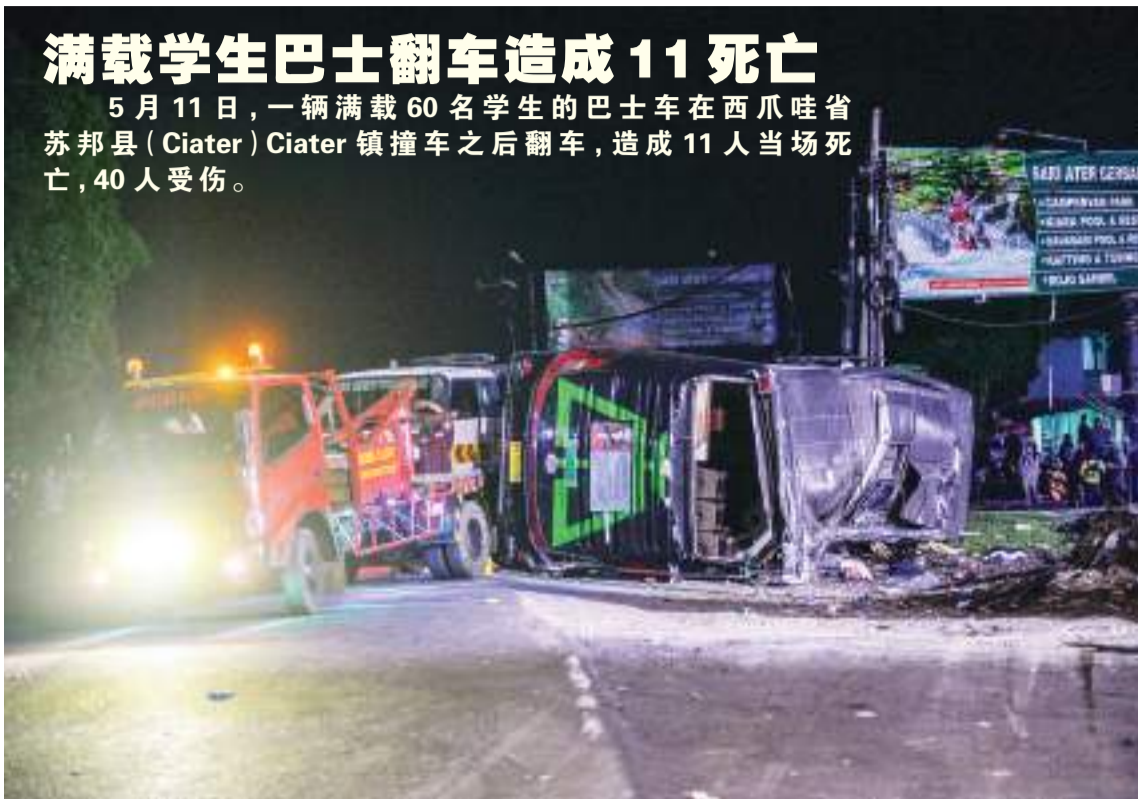
满载学生巴士翻车造成11死亡 5月11日, 一辆满载60名学生的巴士车在西爪哇省苏邦县(Ciater) Ciater镇撞车之后翻车, 造成11人当场死亡, 40人受伤。