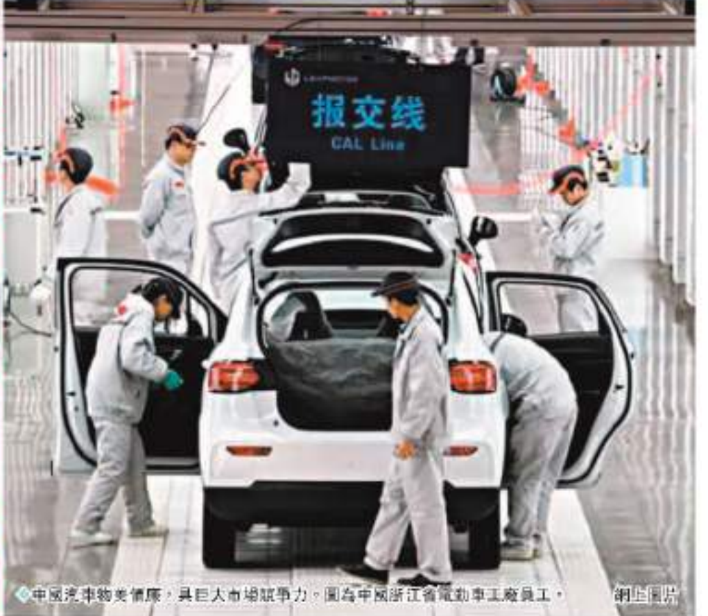
中國汽車物美價廉，具巨大市場競爭力。圖為中國浙江省電動車工廠員工。 網圖