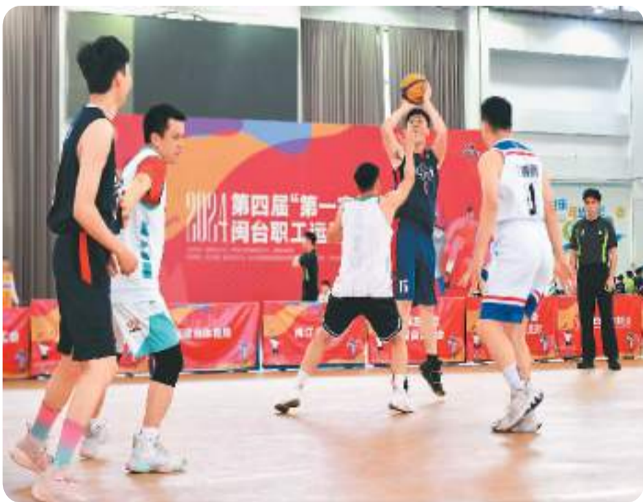
第四届“第一家园”闽台职工运动交流赛近日在位于福建福州的闽江学院开幕。比赛共设慢投垒球、三人制篮球、羽毛球等3个比赛项目，吸引来自福建及台湾的22支职工球队、230余名职工参赛。