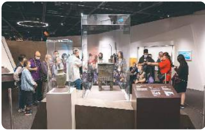
▲ 观众在香港历史博物馆参观“天地之中——河南夏商周三代文明展”。