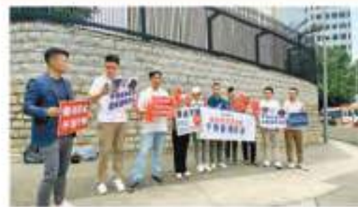
至灣區代表昨日到美國駐港總領事館抗議。

【香港商報訊】記者周偉立、李銘欣報導：針對美國「國會—行政部門中國委員會」發表所謂年度報告，抹黑香港人權自由狀況，攻擊香港國安法和特區司法制度，特區政府及外交部駐港公署均表示強烈不滿，敦促美方恪守國際法原則和國際關係基本準則，立即停止干涉香港事務和中國內政。