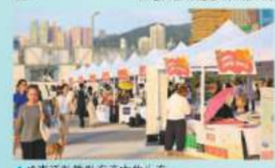
◆ 盛事活動帶動海旁市集生意。