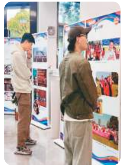
▼ 两岸青年观看展览。