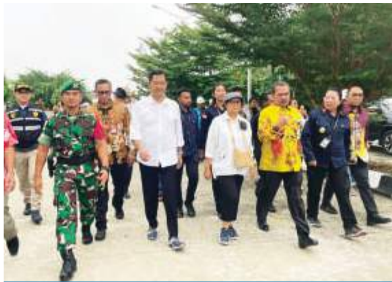
印尼与巴布亚新几内亚加强边境合作 5月11日, 外交部长雷特诺(前右三)出席在查雅普拉(Jayapura)举行的印尼与巴布亚新几内亚两国部长级会议。双方将讨论关于边境合作管理等议题。