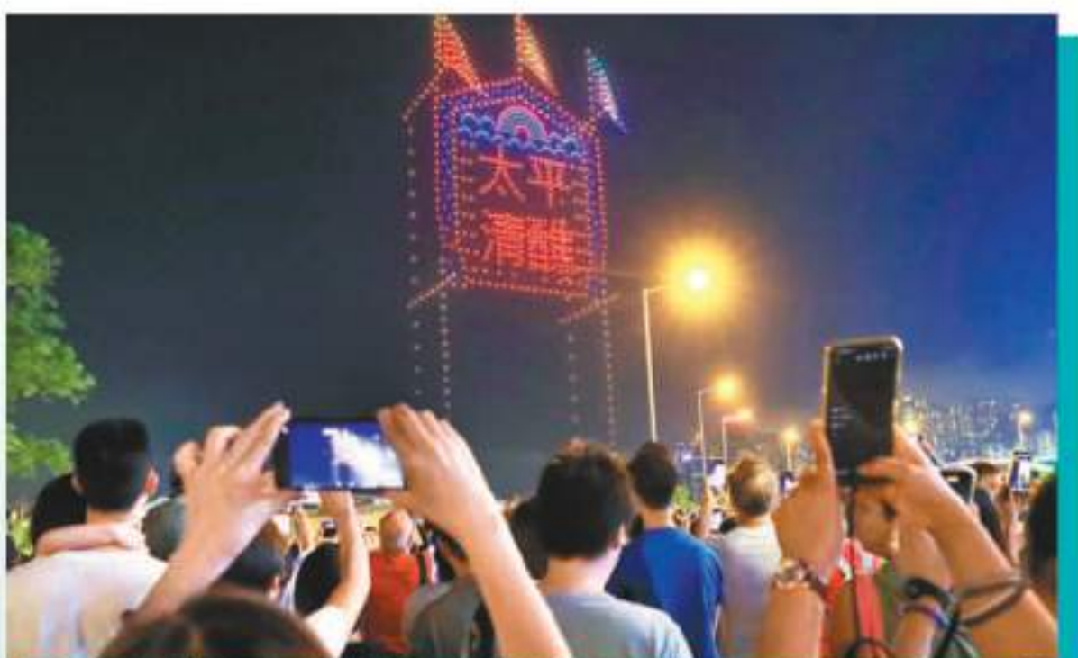
◆ 灣仔海濱上演以傳統、太平清醮兩大傳統節慶為主題的無人機表演。

余先生帶同兒子排隊領取免費雪糕，「排隊過程很熱，大汗淋漓，但吃到一支免費雪糕真係開心。」他表示，晚上的無人機匯演十分精彩，體現香港特色文化。亦有市民指，活動可讓大眾預早慶祝今日母親節的喜悦。有市民指支持多舉辦同類活動，建議也可舉辦龍舟仔等傳統節慶小食。