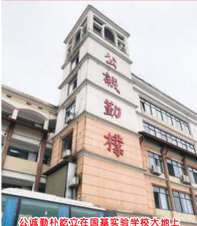
公诚勤朴屹立在国基实验学校大地上