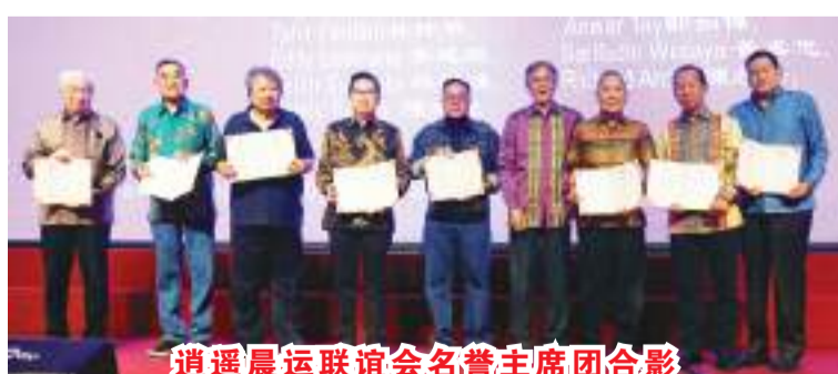
逍遥晨运联谊会名誉主席团合影