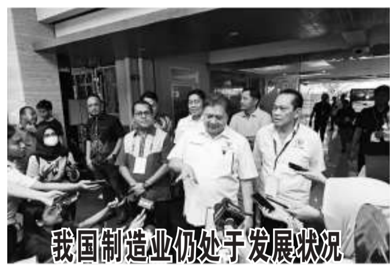
5月11日，经济统筹部长艾朗卡(Airlangga Hartarto)声称，尽管全球的经济还在放缓的情况下，我国的制造业仍处于发展状况。

约达990万吨(千升)的Pertalite汽油，政府制定的今年份额约共3170万吨，其中巴厘的份下份额约达22.1万吨，已经供应的达到7万2900吨。 为确保含津贴燃油的供应能够正确到位，政府自2022年7月份已向普罗大众进行了宣传和教育活动，谁有权可享用含津贴Pertalite汽油。 除此之外，北塔米纳公司也通过正确到到额，推动了含津贴燃油供应数字化系统，也就是对使用Pertalite汽油的车辆进行登记，使加油站在执行加油任务时，就能真正的正确到位。 他补充说，“我们也非常感谢，执法机构和大众一直对Pertalite汽油的供应保驾护航，让弱势群体能真正享用上述含津贴能源。”(Sm)