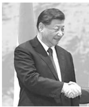
2022年11月16日，佐科维总统在巴厘会见中国主席习近平的情景。

此前，中国还帮助建设了一些新城市；其中包括2019年的新行政首都新阿拉曼的中央大楼。中国和肯尼亚签署了一项价值6.65亿美元的合作协议，以在非洲国家发展