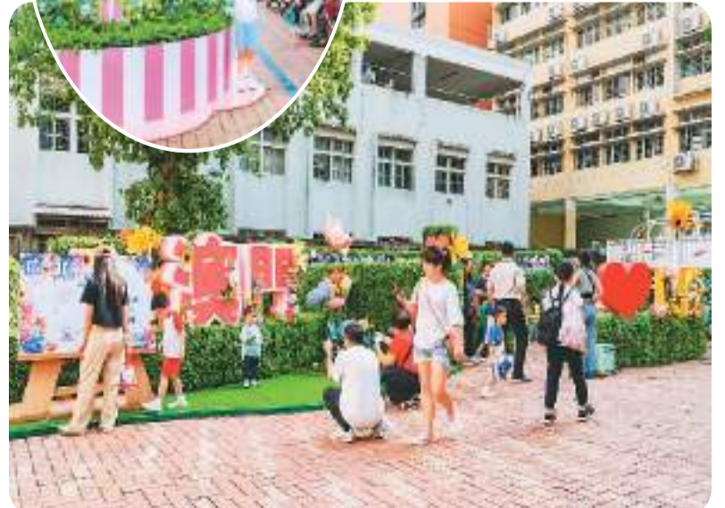
▲ “愿望花廊”装置。 ▼ “绿野迷踪”装置。

澳门旅游局局长文绮华介绍，澳门5月起将陆续举办“FUN享乐游澳门—社区旅游驻点导赏服务”“亲子游澳小城消费嘉年华”等更多特色活动，宣传推广澳门社区旅游。希望通过创新数字化手段，发挥“旅游+”跨界融合的联动效应，将旅游活动及资源延伸至更多社区，为社区吸引更多客源，推动社区旅游经济发展。