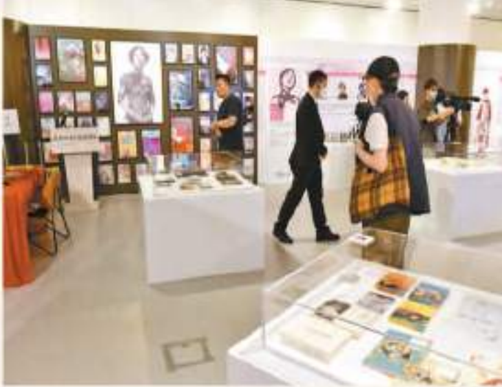
是次主題展覽展示24位重要南來作家的手迹和物品，逾數逾300件。