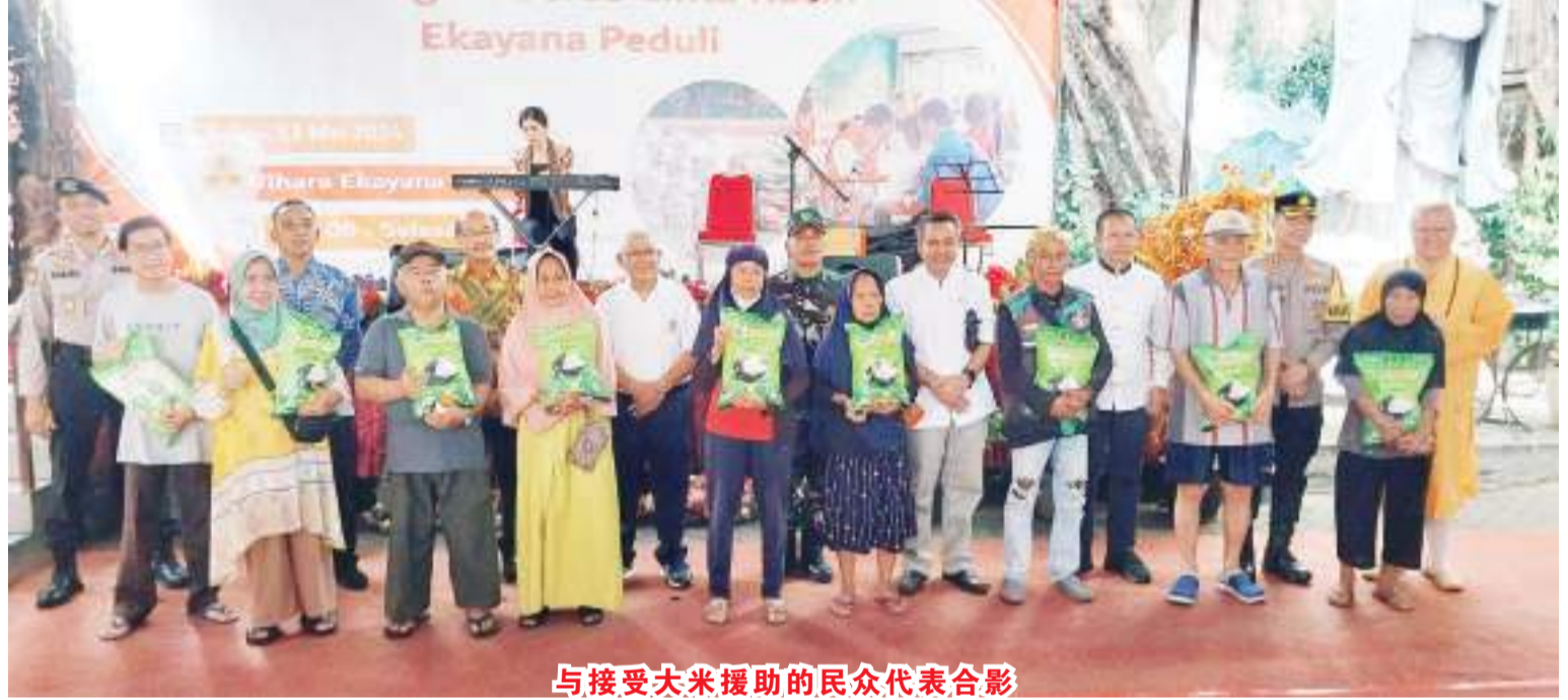
与接受大米援助的民众代表合影

动,包括: Karuna Duta 团队对医院进行爱心访问活动、5月1日的清理寺庙活动、5月5日的捐血活动,并将持续至5月23日(周四)的庆祝卫塞节活动。祝愿大家充满爱心相顾! (Bam、亮剑)