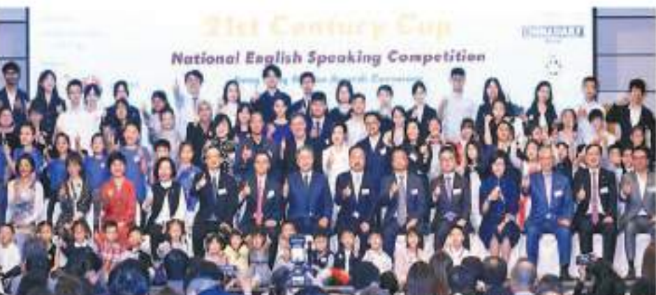
「21世紀杯」全國英語演講比賽(香港賽區)昨日舉行頒獎典禮。

【香港商報訊】記者唐恒恒報導：中國日報及中國日報香港版旗下教育品牌VDO英語聯合主辦的2024年「21世紀杯」全國英語演講比賽(香港賽區)昨日舉行頒獎典禮，政務司副司長卓永興致辭稱，今日比賽有200間香港學校超過1200名學生參加，並將悉香港學生過去幾年會贏得兩次全國冠軍，希望本港代表能再次取得好成績。他表示，特區政府會繼續落實並完善《青年發展藍圖》中160多項措施，並且鼓勵在場人士參與將於8月10日舉行的「青年發展高峰論壇」。