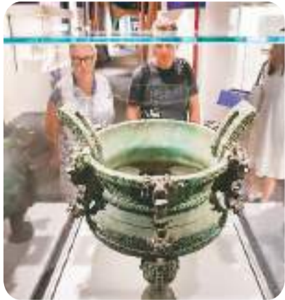
▲ 观众在参观展出的文物。

一年后，在港豫两地合作下，遍布河南8个地市、15家文博机构的150余组文物，汇聚于香港历史博物馆的“天地之中——河南夏商周三代文明展”，宛如穿越时空而来，讲述着历史的壮阔波澜。