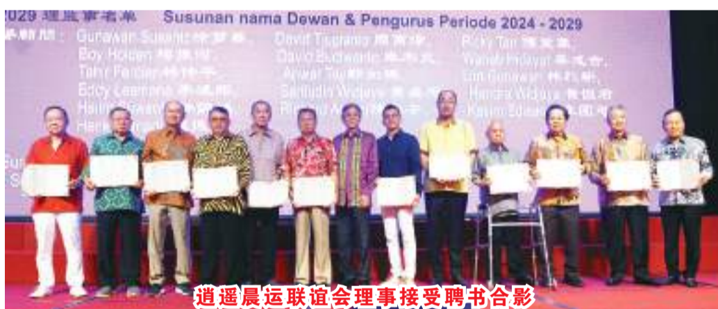
逍遥晨运联谊会理事接受聘书合影