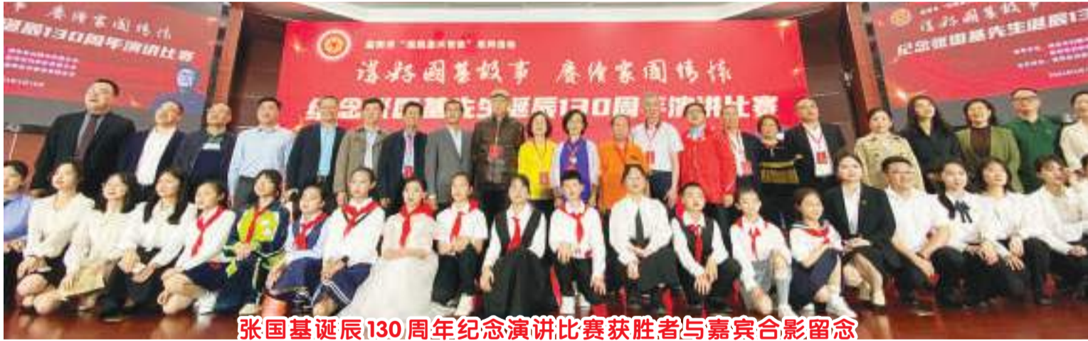
张国基诞辰130周年纪念演讲比赛获胜者与嘉宾合影留念