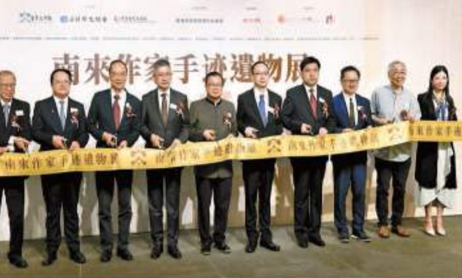
「南來作家手迹遺物展——走進文學時光的卷軸」昨日開幕，一舉嘉賓主持剪綵。

【香港商報訊】由香港文學館、香港作家聯會及中國現代文學館主辦的「南來作家手迹遺物展——走進文學時光的卷軸」昨日在香港中央圖書館開幕，展出24位重要南來作家的手迹和物品逾300件，當中近200件為原件，是香港歷年最具規模的南來作家主題展。據了解，今次展覽介紹的作家如許地山、張愛玲、蕭紅、戴望舒、葉靈鳳、梁羽生、金庸、劉以雲、曹聚仁、徐訏、黃慶雲等，他們或在港寫下經典之作，或參與各類文學活動，在香港留下文學足跡，並以文學和文字為媒介為香港帶來新的文化氣象，促進香港文學的發展。