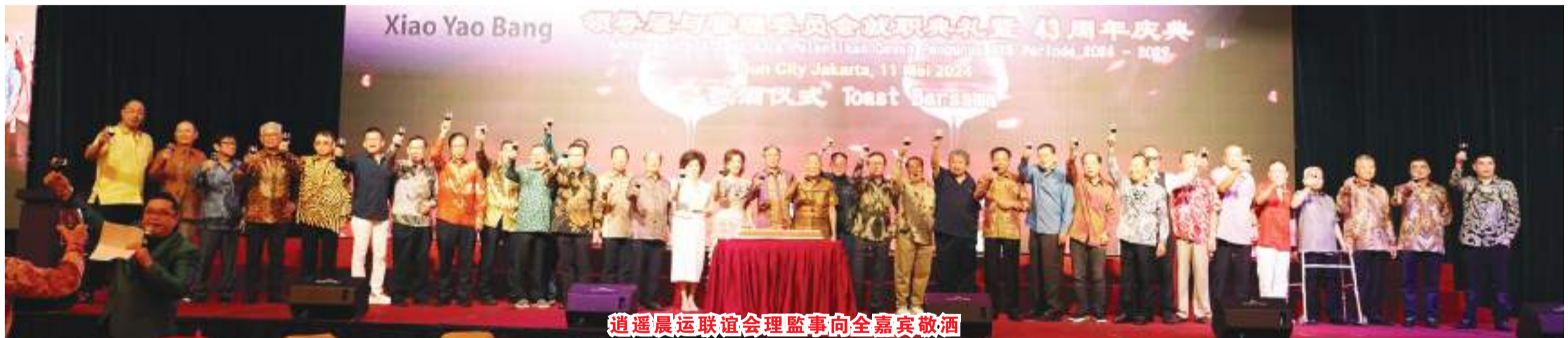
逍遥晨运联谊会理事向全嘉宾敬酒