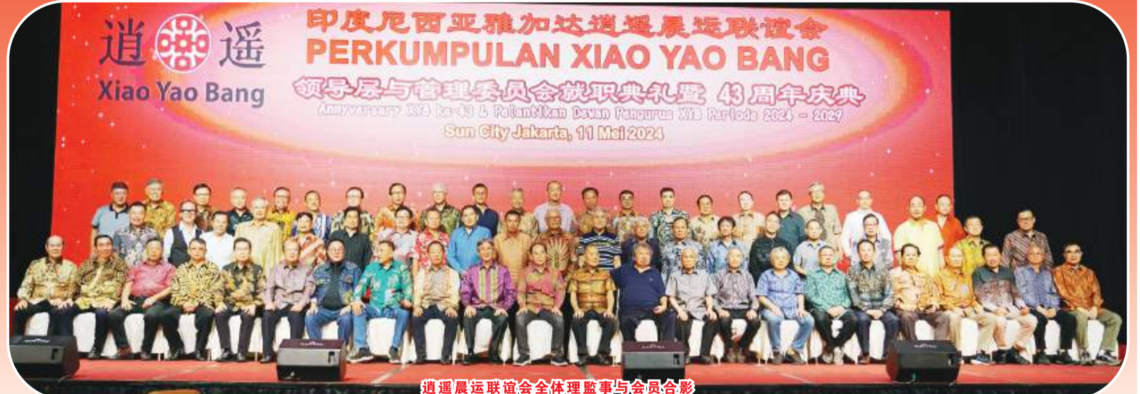
逍遥晨运联谊会全体理事与会员合影

【本报讯】2024年5月11日(星期六)18:00, 印尼雅加达逍遥晨运联谊会(简称XYB“逍遥帮”)理事就职典礼暨成立43周年庆典, 在雅加达太阳城国际酒楼大会议厅隆重举行。