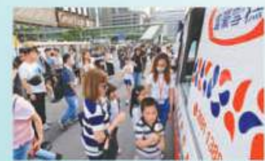
◆ 旅遊局派出雪糕車，向公眾及旅客免費派發雪糕。