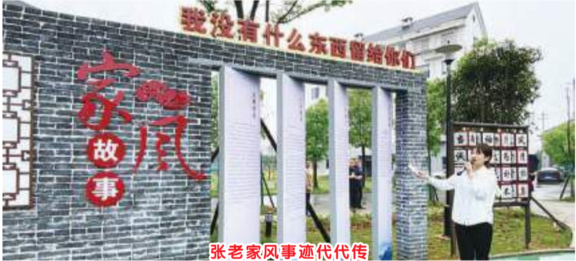
张老家风事迹代代传