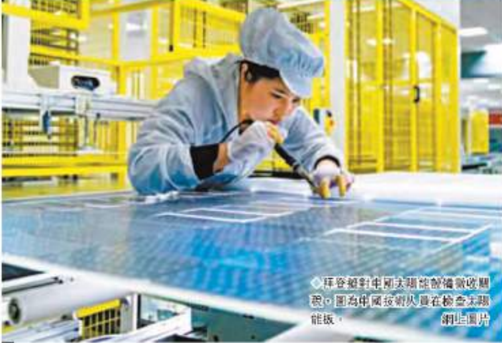
拜登對中國近期加徵關稅，圖為中國技術人員在檢查太陽能板。 網圖