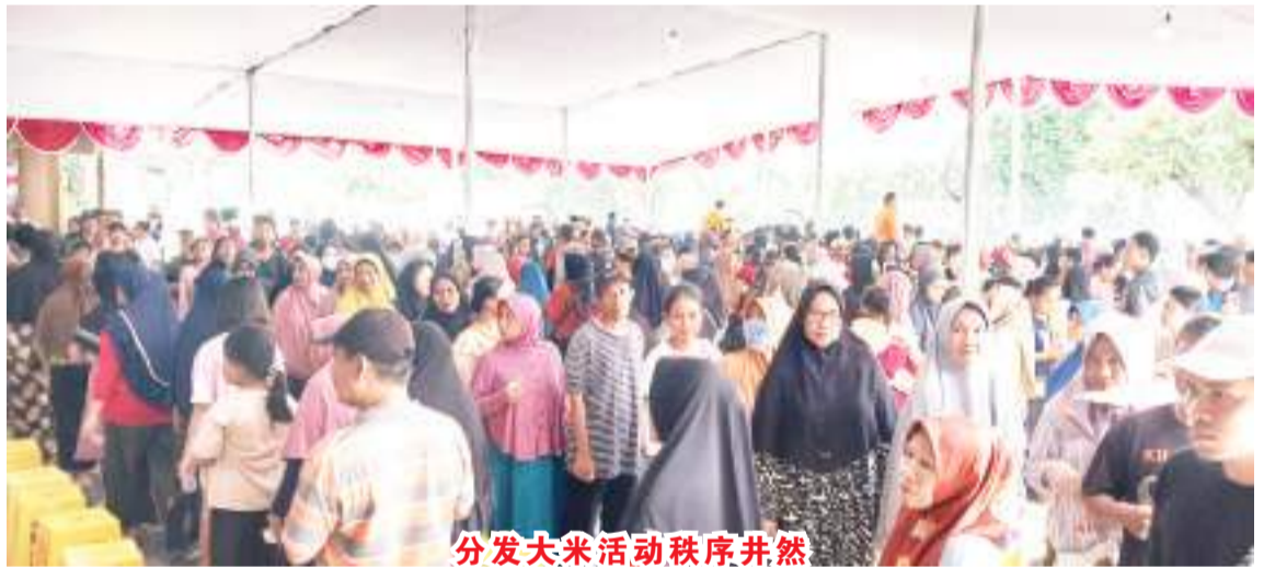
分发大米活动秩序井然