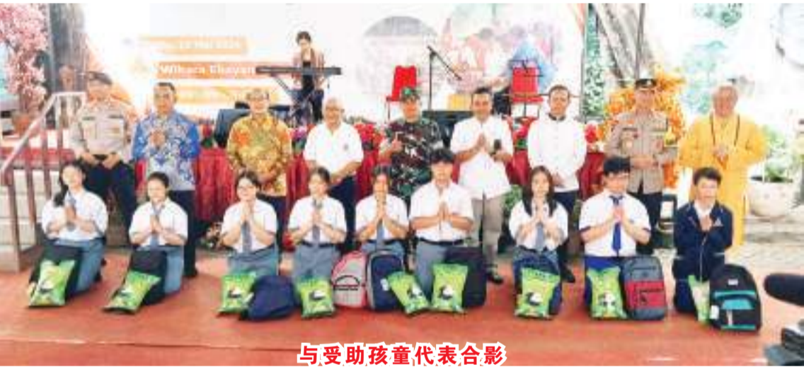
与受助孩童代表合影