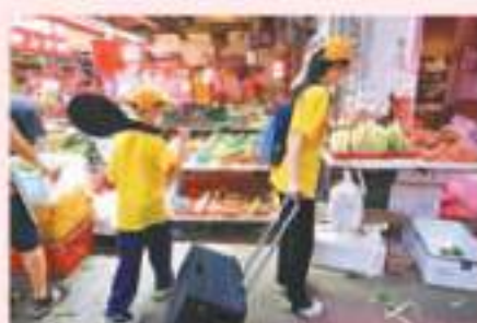
▲▲「恩仔」平常跟媽媽到街市「格價」，他教手工製作的康乃馨贈送給媽媽，並祝她母親節快樂。

在謝女士努力下，恩仔從輪椅代步漸漸學會乘輔助儀器行路，目前更無須依賴儀器行走，每一步都有汗有淚，「一開始扶着他，或者叫他扶着把手走樓梯，每天我都同他練習走路，每日幫他用萬油按摩至少20分鐘。」多年來堅持接受中醫針灸、敷中藥、西醫治療多管齊下，謝女士的嬰兒如今已經能自如行路以及跑步，「他之前行路是前腳掌落地，現在行路整個腳掌可以落地，只剩下後腳跟不能落地，行路時有些起伏。」她一臉自豪地說：「兒子現在能走能跑，還非常喜歡做運動，打羽毛球、跳繩等，更曾參加交際團去韓國比賽游泳。」採訪期間，感到無聊的恩仔起身跳起內地爆紅的「科目三」舞蹈，動作熟練流暢。沒有領取前夫撫養費以及醫藥資助，謝女士多