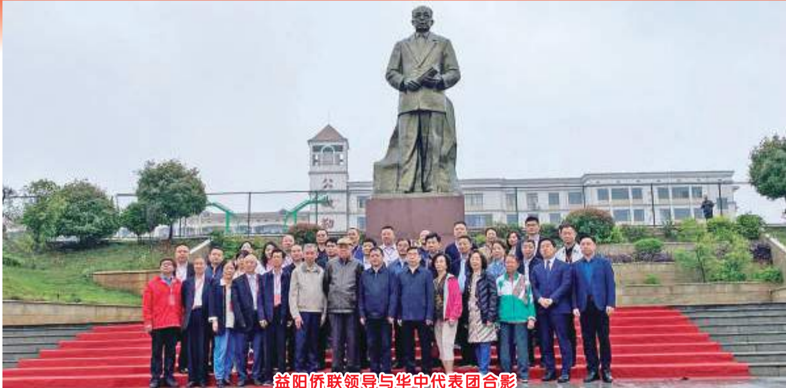
益阳侨联领导与华中代表团合影

【本报讯】为纪念张国基先生诞辰130周年,弘扬张国基先生事迹与精神,再现一代侨领崇高风范,益阳区美术家协会历时半年在张国基先生的故居等地采风创作了一批专题美术作品。这些作品和区书法家协会、诗联协会联合创作的书法作品一同在“讲好国基故事 赓续家国情怀”纪念张国基先生诞辰130周年书画展上展出。除此之外湖南省益阳市资阳区归侨眷联合会开展题为《讲好国基故事 赓续家国情怀》的演讲比赛决赛;参观益阳国际实验学校、国基教育馆;召开纪念座谈会;参观国基文化广场;参观明清古巷。最后参加国基纪念林种植活动。