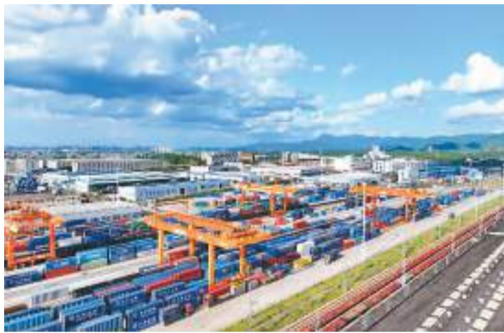
在江西省赣州市南康区，赣州国际陆港车来车往、货如轮转，起重机在装卸进出口货物集装箱。

“4月份，中国对新兴市场进出口持续向好，对欧美等传统市场进出口由降转增，加上较去年同期多2个