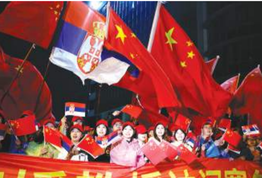
当地时间5月7日，中国国家主席习近平抵达贝尔格莱德，开始对塞尔维亚进行国事访问。在贝尔格莱德街头，华人华侨和中国留学生挥舞中塞两国国旗，热烈欢迎习近平主席到访。

8年前，塞尔维亚成为中国在中东欧地区首个全面战略伙伴。如今，在两国元首战略引领下，塞尔维亚又成为首个同中国共同构建命运