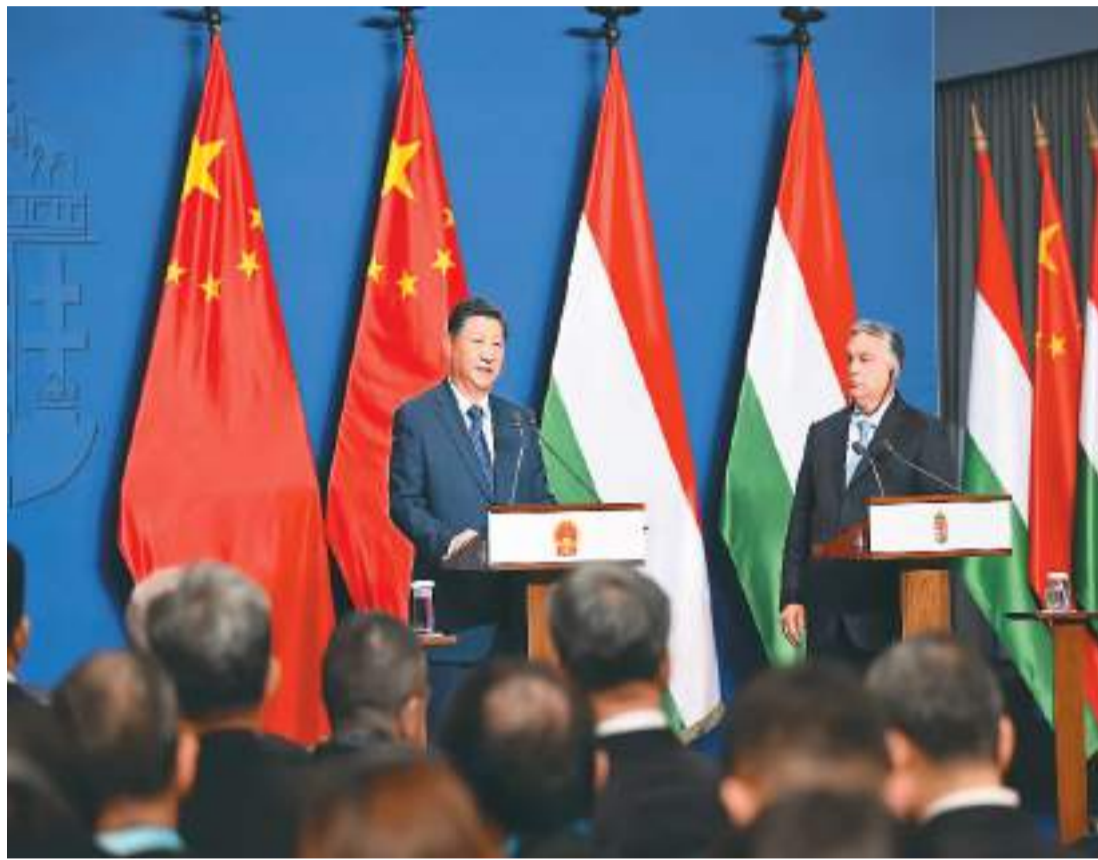
当地时间5月9日下午, 国家主席习近平在布达佩斯总理府同匈牙利总理欧尔班会谈后共同会见记者。