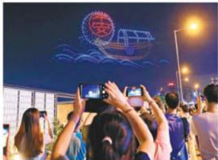
◆ 傳統漁船海派中載着巨型平安包。