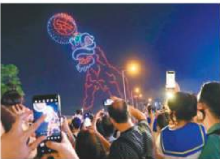
◆ 醒獅戲耍着平安包。