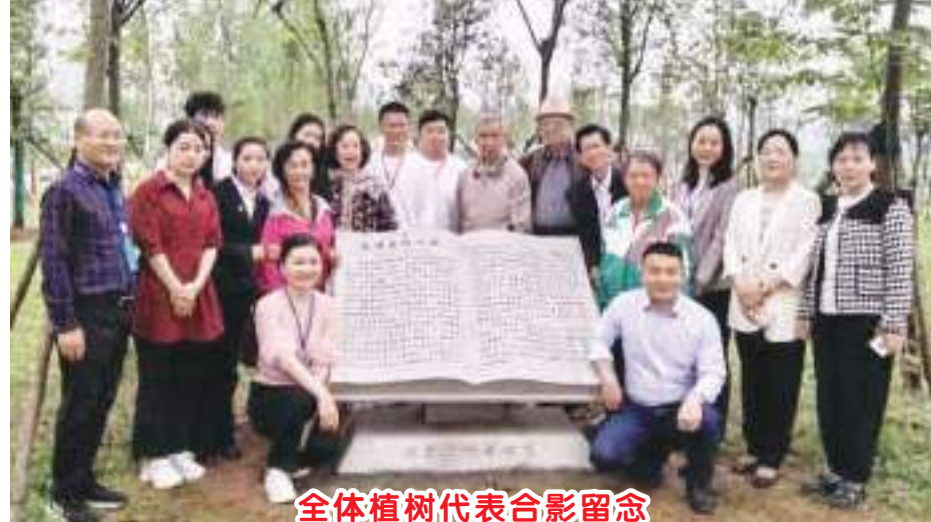
全体植树代表合影留念