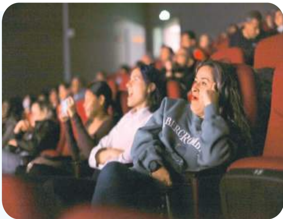
上图:外籍记者观看《雪豹和她的朋友们》影片。

随着场内灯光逐渐暗下,一座肃穆的雪山在屏幕上浮现,野生动物纪录电影《雪豹和她的朋友们》观影活动拉开帷幕。电影拍摄历时6年,由当地牧民深度参与,真实拍摄的雪豹故事深深打动了观影者。影片放映结束后,外籍记者与中方主创团队就生态环境保护、人与自然和谐共处等议题展开热烈交流。中国的雪豹故事走进外籍记者的心中,也将继续随着他们的述说走向世界。