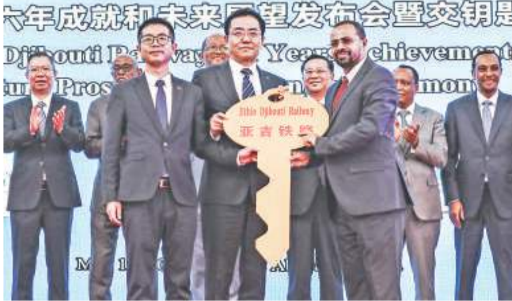
“授人以渔”的中国实践——写在亚吉铁路运营六年“交钥匙”之际 2024年5月10日，在埃塞俄比亚首都亚的斯亚贝巴布火车站，亚吉铁路中方联营公司负责人与当地业主负责人举行“交钥匙”仪式。新华社记者 刘方强 摄