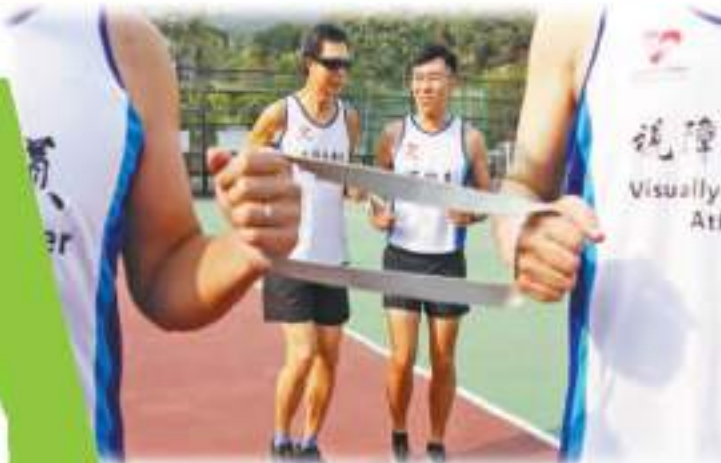
領跑員帶長的2呎，運動員與領跑員可因應需要靈活調整前長短，跑進人多時可繞一圓，縮短兩人之間的距離。