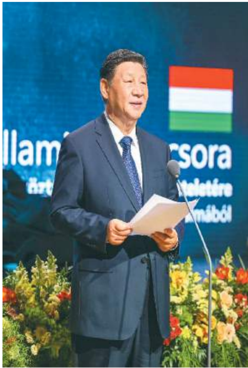
当地时间5月9日晚, 国家主席习近平和夫人彭丽媛在布达佩斯城堡山出席匈方总理欧尔班和夫人雷沃伊举行的隆重欢迎宴会。这是习近平在宴会上致辞。