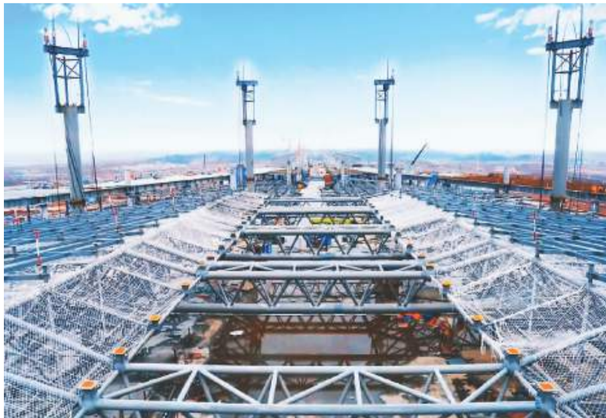
日前，长沙机场T3航站楼项目完成F大厅混凝土结构封顶。该项目由中建八局牵头联合体承建，总建筑面积约50万平方米，分为F区大厅及A、B、C、D、E区五条指廊，主楼共有4层。项目工程机坪规划近机位75个，可满足年旅客吞吐量4000万人次，是湖南省最大单体公共建筑工程。图为项目建设现场。