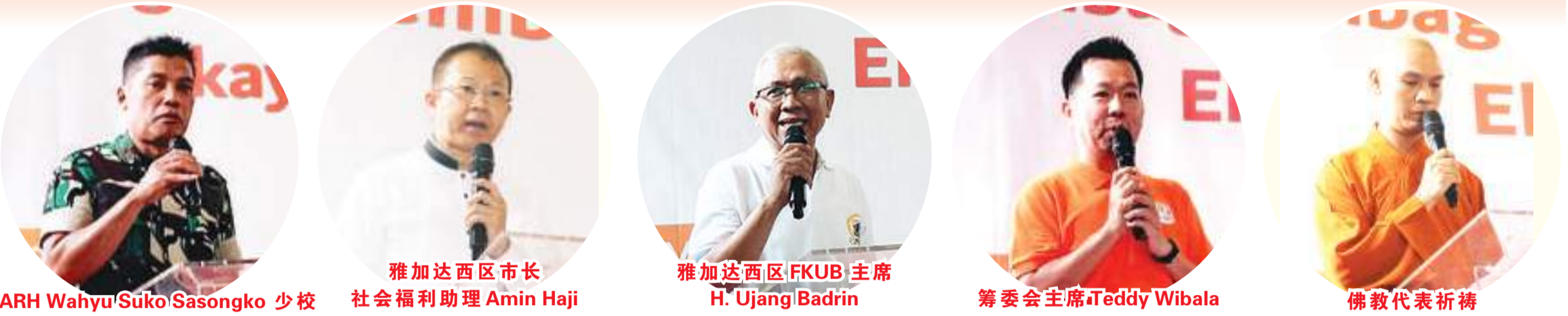
ARH Wahyu/Suko Sasongko 少校