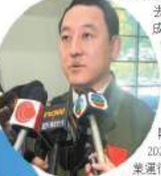
修宇表示，去年進港飛行令人終身難忘。