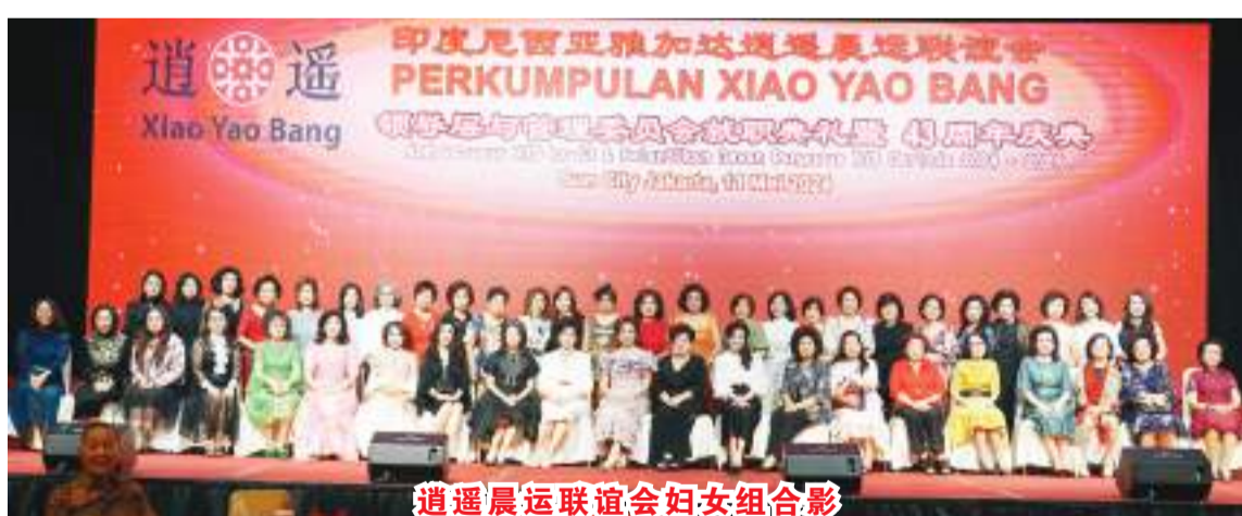
逍遥晨运联谊会妇女组合影